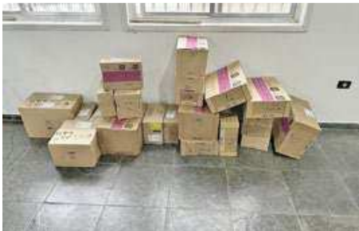
Carga havia sido roubada durante a manhã em Itanhaém

Ao verificar à distância o interior do veículo, o vere-