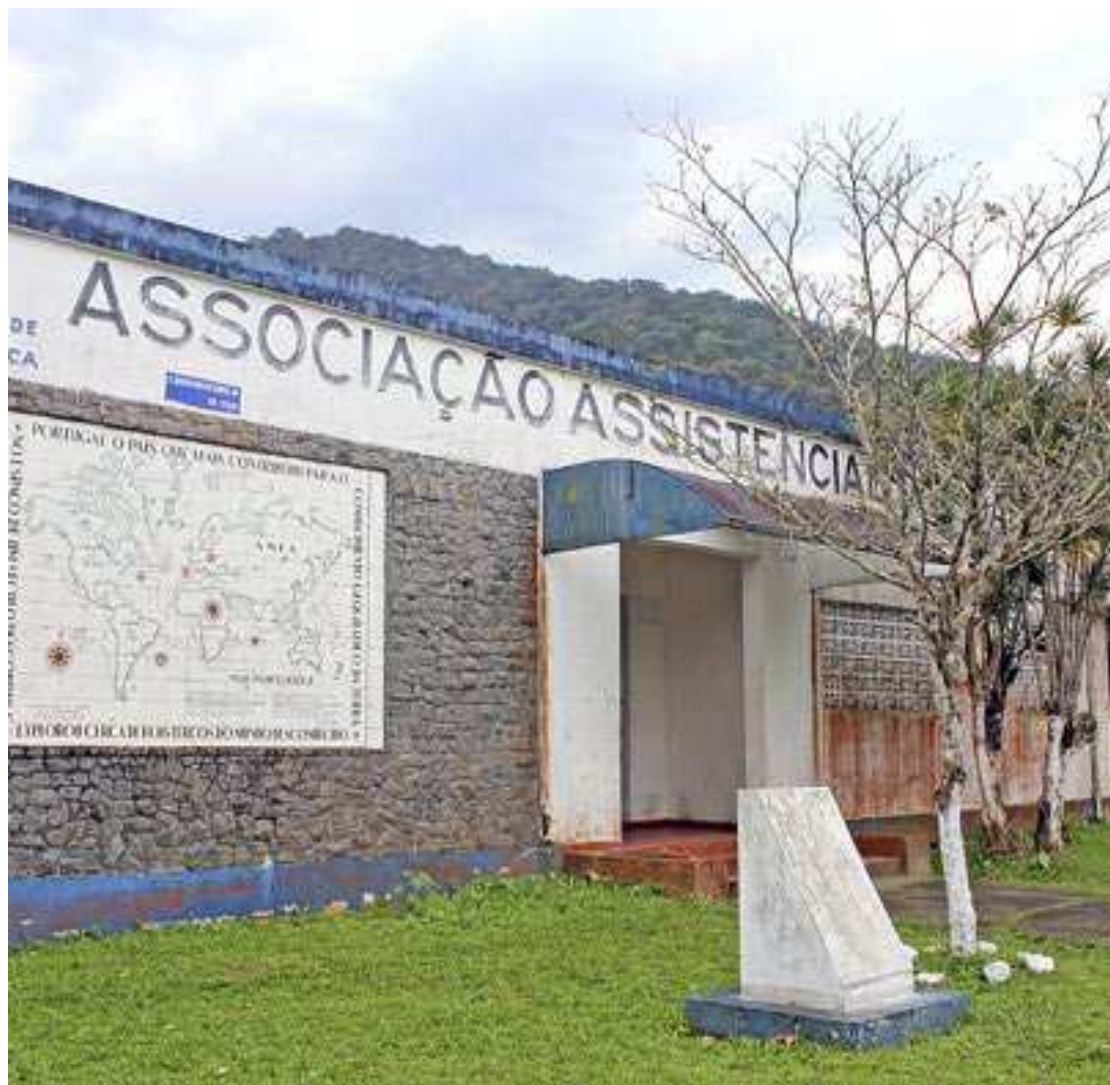
Parceria deve reformar imóveis e adaptá-los para a construção do hospital na Cidade da Criança

A área possui um campo de futebol oficial com vestiários e arquibancadas; uma quadra esportiva; oito pavilhões com 200 metros quadrados cada;