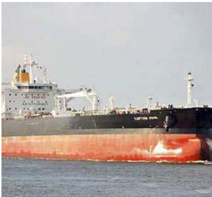
Navio MV Captain John P está na área de fundeio do Porto

Na última terça-feira, a Prefeitura de Santos confirmou o quarto caso de varíola dos macacos na cidade. Além dos quatro casos já confirmados, a cidade ainda tem dois suspei-