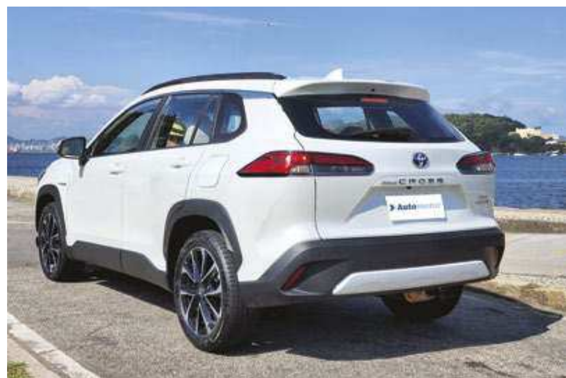
Todas as variantes do Corolla Cross têm as mesmas dimensões, com 4,46 metros de comprimento, 1,82 metro de largura, 1,62 metro de altura e 2,64 metros de distância de entre-eixos

A motorização híbrida do Corolla Cross, com potência combinada de 122 cavalos, entrega desempenho sem vocação para a esportividade. Porém, o conjunto híbrido move com eficiência o veículo.