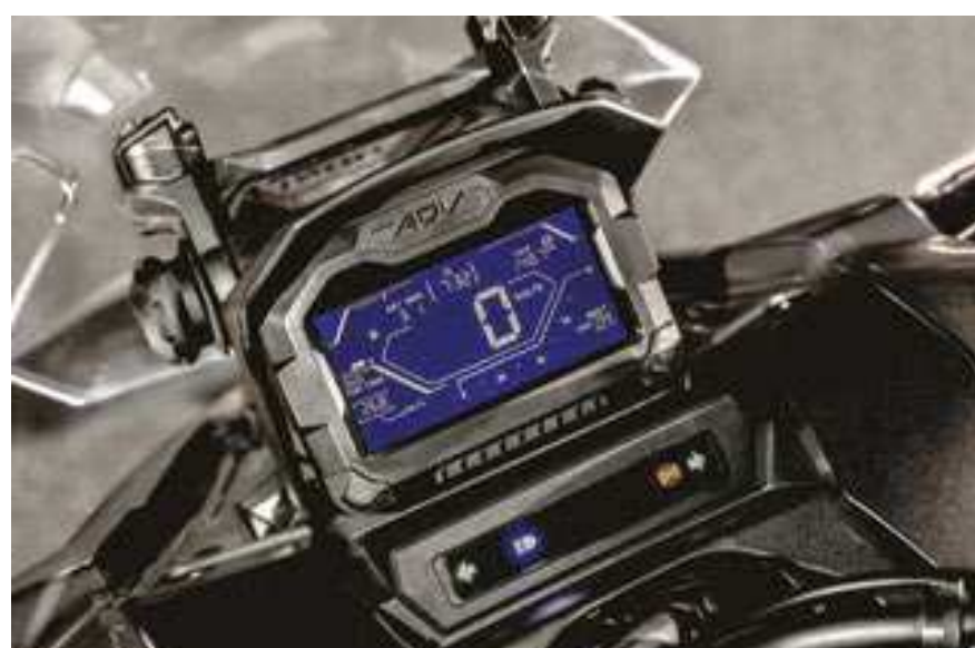
Itens tecnológicos e de conforto ajudam a tornar a ADV 150 mais atraente, como a Smart Key System (chave presencial), iluminação full-led e painel de LCD blackout