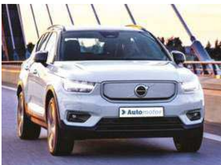
Volvo XC40 Recharge é exemplo de veículo 100% elétrico

O EV (Electric Vehicle) ou Carro Elétrico usa eletricidade para seu funcionamento, podendo ter um conjunto de motores, nos quais utiliza energia química de baterias recarregáveis que podem ser “repostas” em tomadas normais ou específicas conforme a corrente oferecida. Se um elétrico tem um