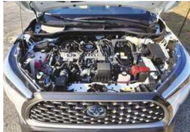
O motor é 1.8L VVT-i 16V de ciclo Atkinson com 101 cavalos de potência a etanol e 98 cavalos a gasolina

Todas as versões do Corolla Cross têm rodas de liga leve, sendo que na XRX Hybrid tem acabamento na cor preta e diamantada, com pneus são 225/50 R18. As cores disponíveis para o novo SUV são a sólida Branco Polar (a do modelo testado), as metálicas Preto Infinito, Prata Lua Nova, Cinza Granito, Vermelho Granada e Azul Netuno e a perolizada Branco Lunar. A topo de linha XRX Hybrid parte de R$ 206.190 em Branco Polar – as cores metálicas aumentam a fatura em R$ 2 mil e a perolizada, em R$ 2.300. O preço pode variar de acordo com a tributação e alíquotas específicas de cada Estado. (Luiz Humberto Monteiro Pereira, da AutoMotrix)