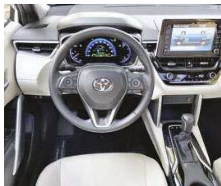
O volante de três raios com controles de áudio e computador de bordo têm acabamento em couro