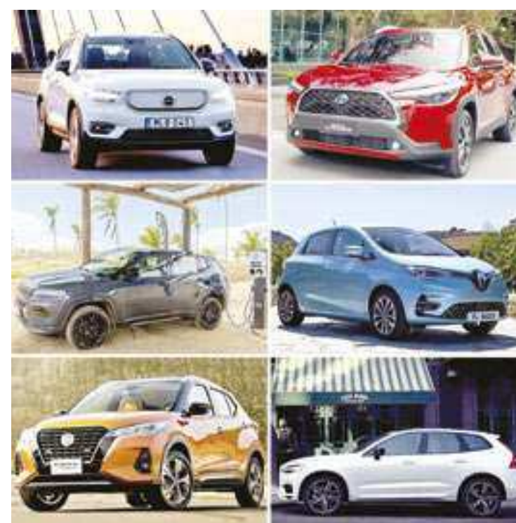
Tanto 100% elétricos como híbridos são tidos como veículos ‘verdes’

HEV (Hybrid Electric Vehicle) ou Carro Híbrido é mais versátil que o carro puramente elétrico, pois combina um motor a combustão com um ou mais motores elétricos, tendo, por isso, bastante autonomia. Os motores a combustão dos HEVs são movidos a gasolina ou flex (etanol ou gasolina). O motor a combustão impulsiona o carro e transfere parte da energia gerada para as baterias, fazendo a recarga. A energia de frenagem também ajuda a carregar as baterias. E o motor elétrico pode ser usado juntamente ao térmico, para aprimorar a eficiência do veículo e intensificar o torque ou para movi-