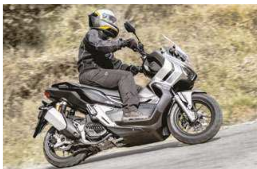
Na ADV, a versatilidade intrínseca às scooters foi ressaltada no projeto no qual o modelo foi dotado de uma parte ciclística de referência