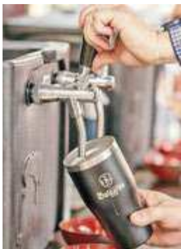
APL Sorocaba

São Paulo será representado pela Secretaria de Turismo e Viagens (Setur-SP), que contará com um estande de 97 m² para promover três polos cervejeiros do estado de São Paulo (Campinas, Sorocaba e Ribeirão Preto), a Rota Gastronômica Vale do Paraíba e Mantiqueira, o polo gastronômico de Rio Claro, além