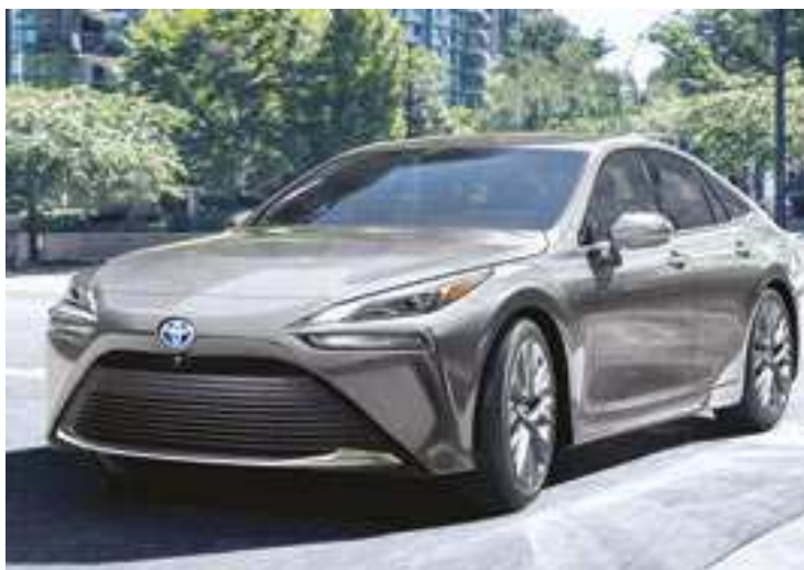
Toyota Mirai usa células de combustível, mas tecnologia está sendo mais desenvolvida na indústria de caminhões de longas distâncias

motor acoplado a cada eixo do carro, diz-se que ele tem tração integral. O veículo elétrico não tem nenhum tipo de propulsão a combustão, não gerando poluição ambiental. O motor elétrico é mais silencioso, tendo apenas um pequeno zumbido de ruído. Devido ao funcionamento simples, o propulsor elétrico dispensa uma caixa de câmbio com relações de marcha entre o giro do motor e das rodas. Por isso, os elétricos mais simples têm apenas duas marchas: a para frente e a ré. Exemplos: Volvo XC40 Recharge e Nissan Leaf.