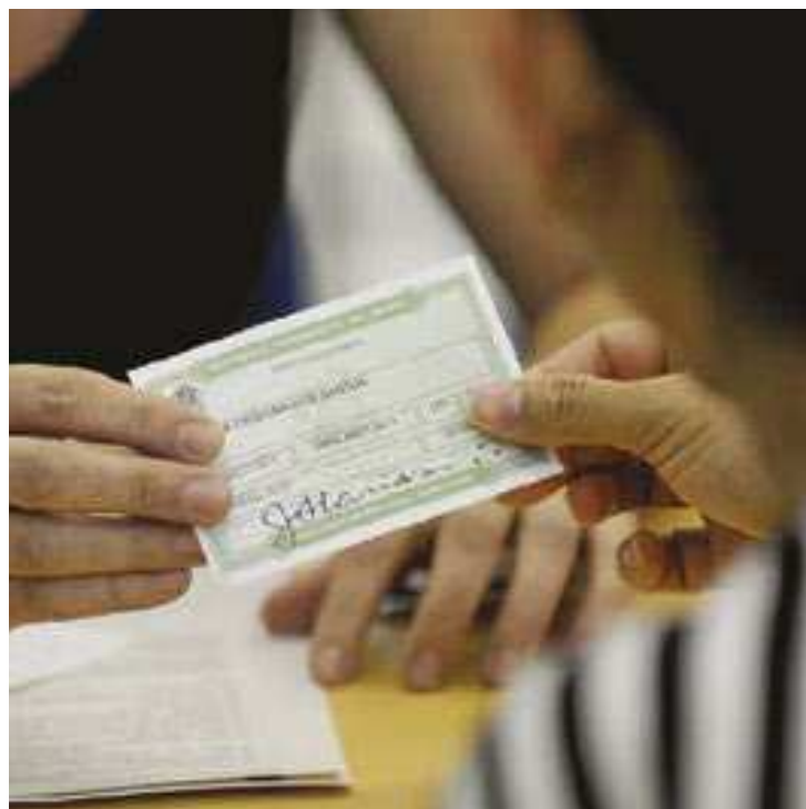
Segundo a Justiça Eleitoral, mais de 156 milhões de pessoas estão aptas a votar nas Eleições 2022, que ocorrem em outubro

O requerimento pode ser feito em qualquer cartório eleitoral pela própria pessoa interessada, munida de documento oficial com foto, ou por meio de curador, apoiador ou procurador. (AB)