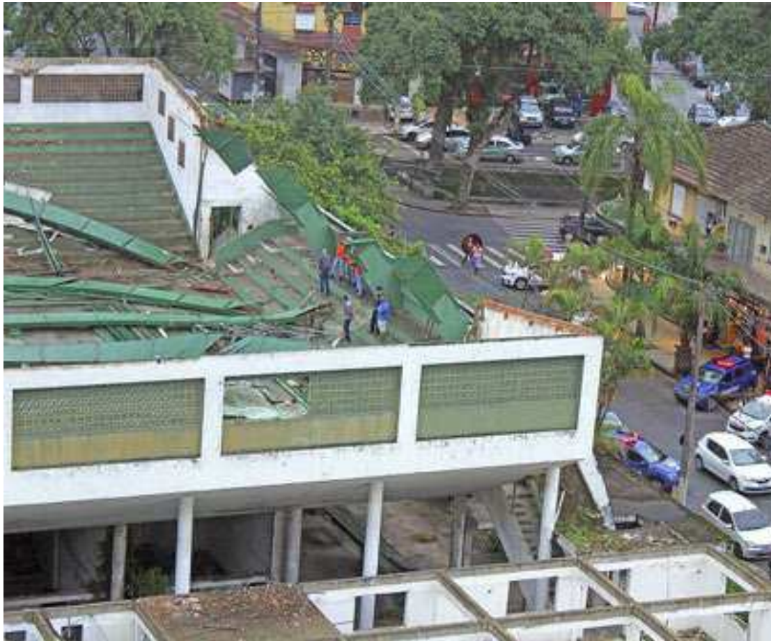
A causa do desabamento pode ter sido uma fadiga de uma das peças da estrutura do telhado

“Já tinham retirado todas as telhas, eles estavam fazendo [a obra] em etapas, mas infelizmente a estrutura cedeu”, completou. (Pedro Henrique Fonseca e Caio Fernandes)