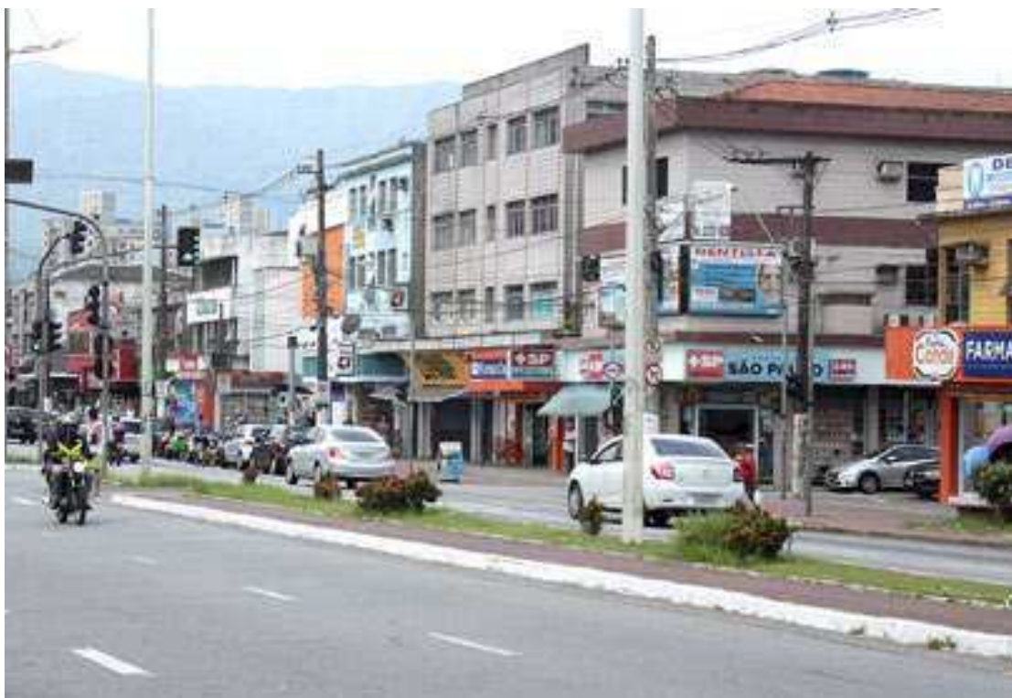
Os valores cobrados são o centro da polêmica, que gerou mobilização da população cubatense

Nesta nova proposta, os valores para comércios e indústrias não foram altera-