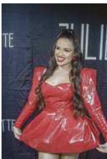
ANDRE MUZZELL / AGNEWS