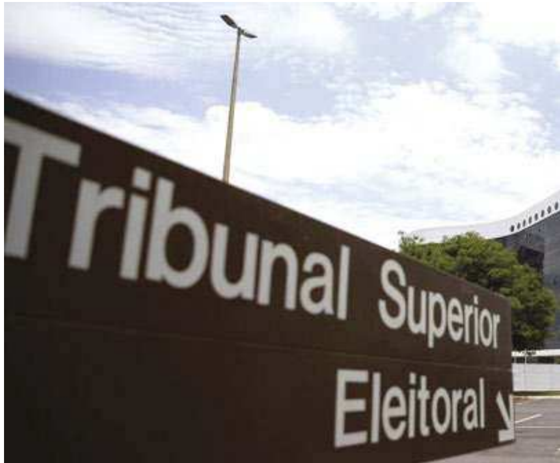
Sant'Anna estava no grupo de nove militares que começou a analisar o código-fonte das urnas

O presidente Jair Bolsonaro (PL) tem usado os questionamentos das Forças Armadas para ampliar ataques às urnas eletrônicas. (FP)