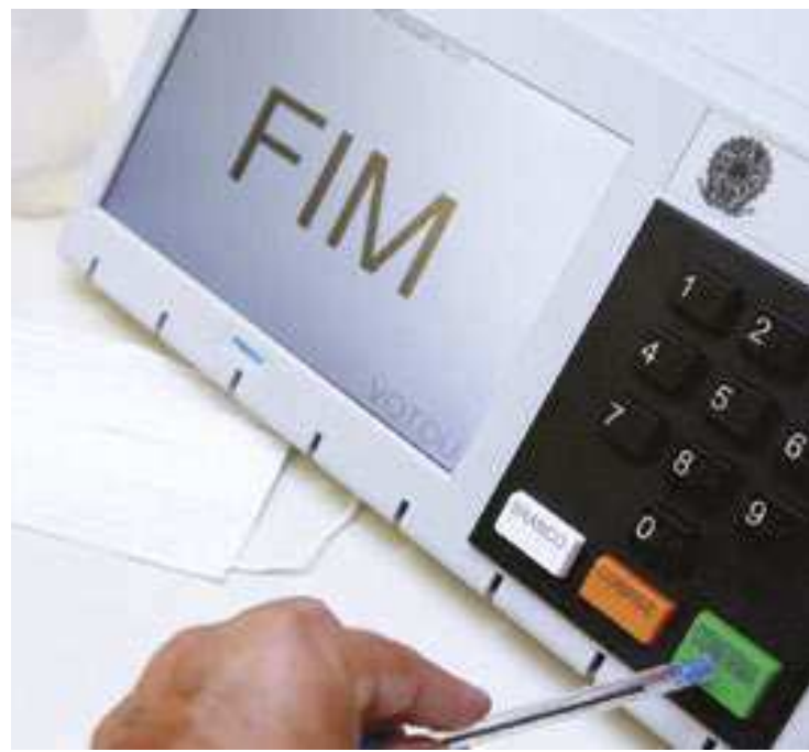
Ao menos 23 milhões de eleitores irão votar por vontade própria

A Constituição Federal estabelece o voto facultativo, ou seja, opcional, para os jovens de 16 e 17 anos de idade; pessoas com 70 anos ou mais e também para analfabetos. Só os eleitores que declaram não saber ler, nem escrever, ultra-