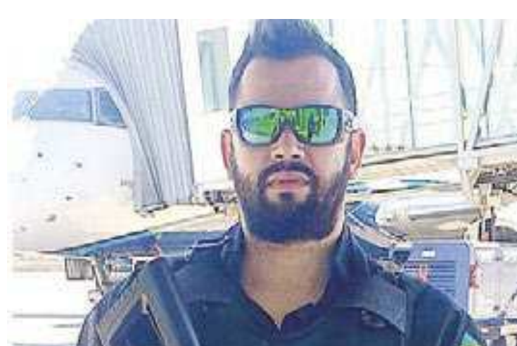
A Justiça do Paraná concedeu prisão domiciliar ao policial penal

O presídio, na região metropolitana da capital Curitiba,