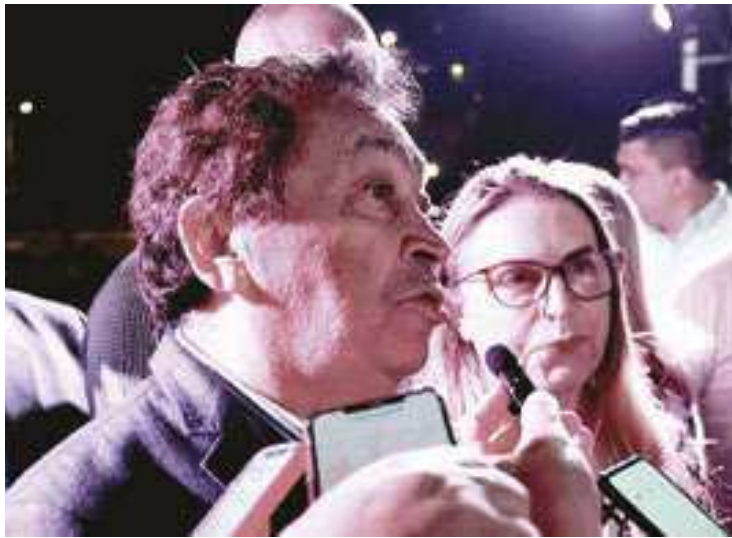
Prefeito Aprígio, de Taboão da Serra, durante coletiva de imprensa

Durante a inauguração do terminal de ônibus no Largo do Taboão, que interliga a cidade a estação do Metrô Vila Sônia, Aprígio disse que a mobilidade urbana e o transporte público são um dos princi-