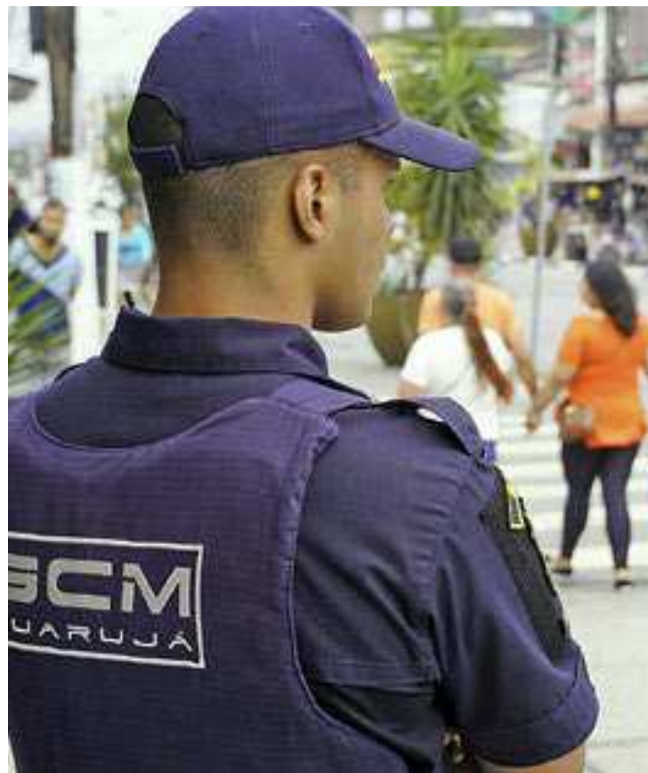
No Centro e nos bairros, a fiscalização acontece na Rua Mário Ribeiro, avenidas Puglisi e Adhemar de Barros, e na Enseada

Já no Centro e nos bairros, a fiscalização acontece na Rua Mário Ribeiro, avenidas Puglisi e Adhemar de Barros, além da região da Enseada. (DL)