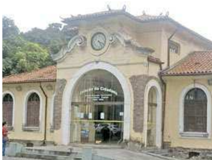
Atividades acontecem na praça em frente e internamente