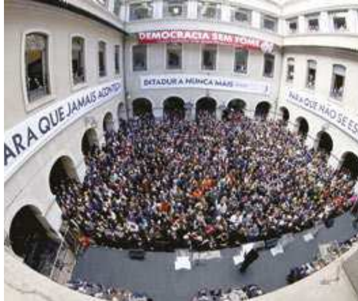
A cerimônia de leitura da carta teve início por volta das 10h

O ambiente envolveu em clima de denúncia, mas também de celebração pela mate-