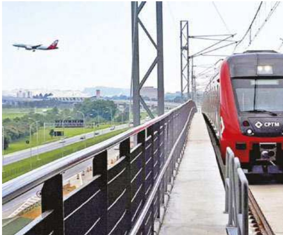
Trem para o Aeroporto de Guarulhos, conhecido também como Cumbica, na Grande São Paulo

ção Barra Funda passe a ser o novo terminal do serviço de trens que ligam a Capital ao Aeroporto (o que hoje ocorre na estação da Luz). Além da extensão da Linha-13 Jade, estão previstos outros investimentos como um reforço no suprimento de energia para alimentar a malha. Veja pelo site da Gazeta a nota completa da CPTM sobre as obras de melhoria na Linha-13 Jade.