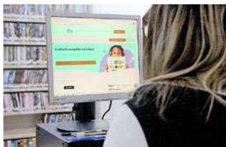
Com amplo acervo, a iniciativa busca a formação de novos leitores

O lançamento da Biblioteca Digital acontece a partir de hoje (11), em comemoração ao dia do Estudante. A apresentação pública será nesta sexta-feira (12), durante o Seminário Municipal de Políticas Públicas para a Juventude, que acontece no Centro de Capacitação do Professor e Teatro “Eva Wilma”, na Aveni-