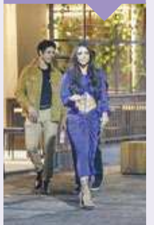
Victor Chapetta / AgNews

“Tô feliz, meu coração tá feliz, tá leve.”