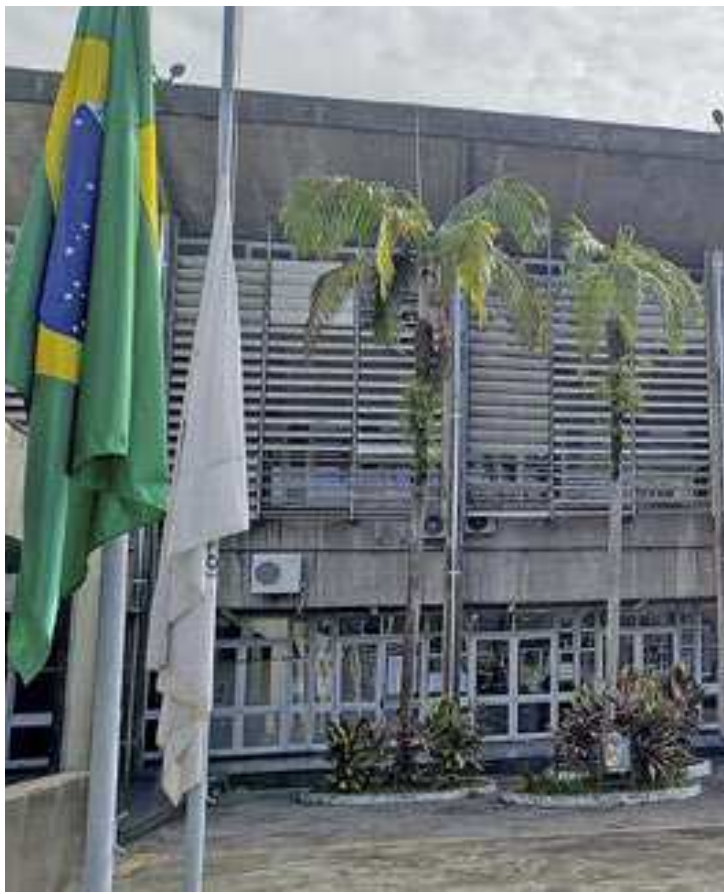
A Prefeitura ressalta que, desde que assumiu o primeiro mandato, em 2017, o prefeito vem prestando todos os esclarecimentos

Não houve a necessidade de recolher documentos, computadores e equipamentos dos locais diligenciados, segundo a prefeitura