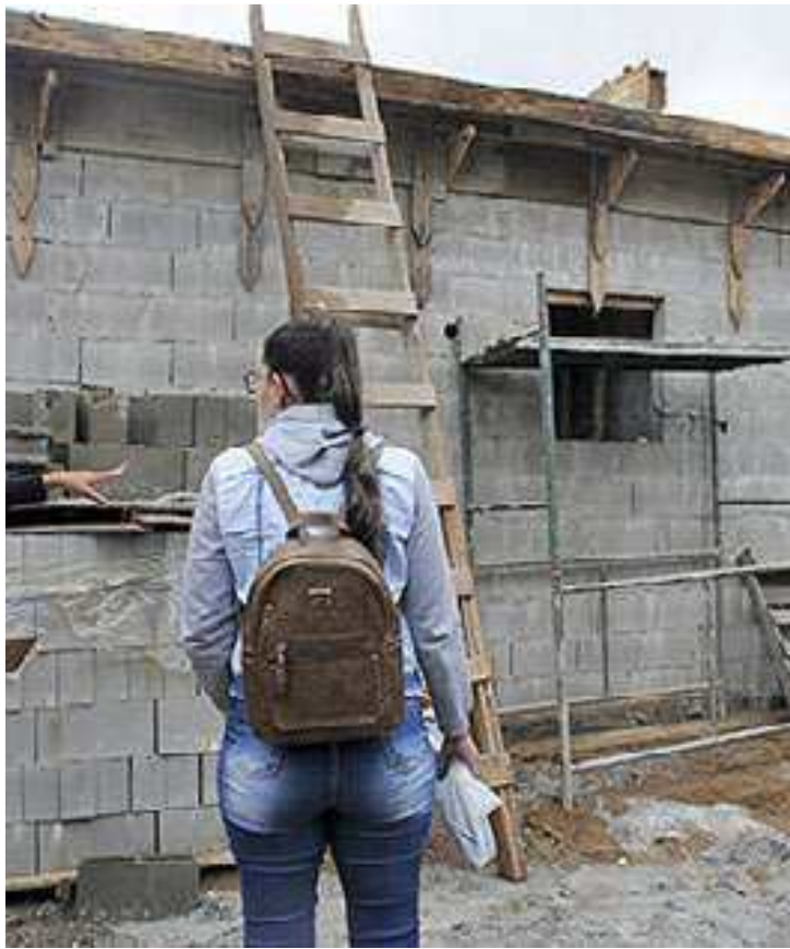
Programa atende integrantes do cadastro habitacional de PG

O servidor municipal tem benefícios estipulados em legislação específica, direcionado ao programa, onde é possível adquirir crédito parcelado em até 144 meses para auxílio a aquisição de imóvel, com desconto em folha. (DL)