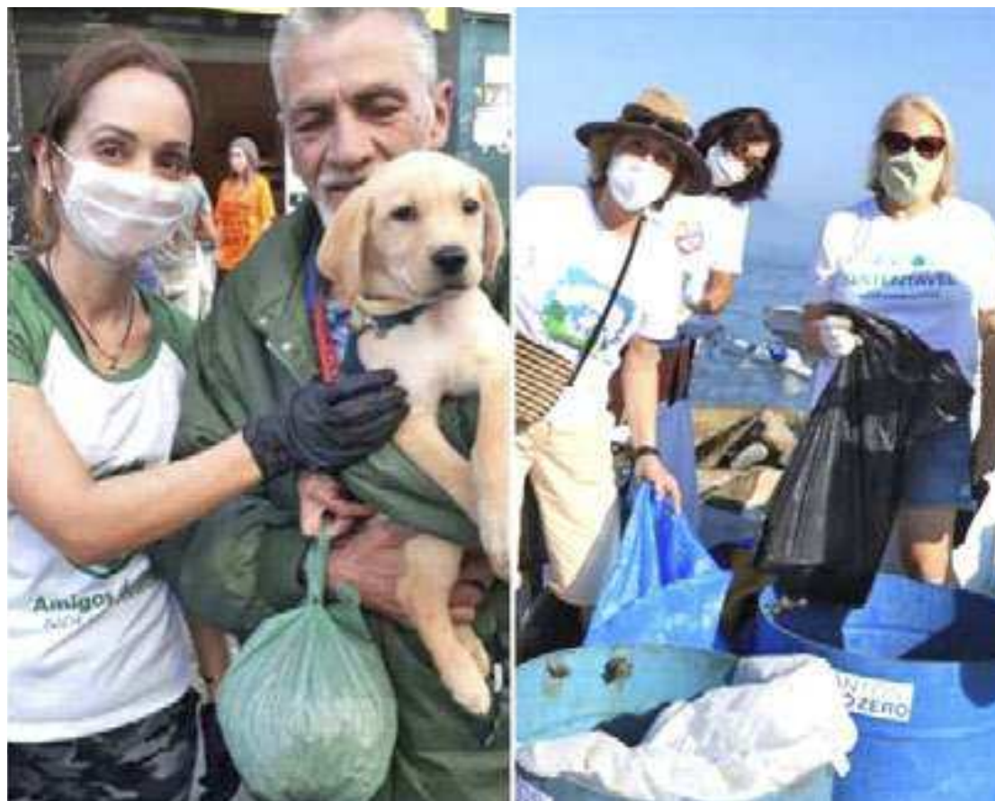
Três importantes projetos receberam incentivo para atuação na cidade de Santos