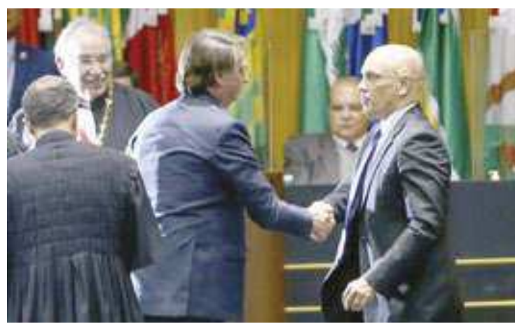
O ministro Alexandre Moraes assume a corte no próximo dia 16

Além de Moraes, o futuro vice-presidente do TSE, Ricardo Lewandowski, acompanhou a reunião com Bolsonaro no Planalto. Também participa-