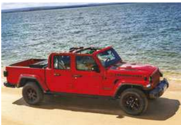
A picape tem 5,59 metros de comprimento, 1,89 metro de largura, 1,90 metro de altura, 3,48 metros de entre-eixos

brasileiro traz consigo uma elevada capacidade de transportar obstáculos devido a um conjunto de componentes e tecnologias. Tudo se inicia pela tração integral com relação reduzida 4:1 e o “crawl ratio” de 77:1. Ou seja, com 77 giros no motor para cada um dos eixos Dana 44, a Gladiator tem mais que o dobro de capacidade reduzida em relação a qualquer outra picape média do mercado brasileiro. O “crawl ratio” permite que a Gladiator entregue o máximo de força em baixa velocidade, aumentando a quantidade de torque disponível nas rodas. A “ostentação” fora-de-estrada do modelo da Jeep continua no bloqueio eletrônico dos diferenciais “Tru-Lok”. Esse recurso trava mecanicamente os eixos fazendo com que ambas as rodas tracionem na mesma velocidade, evitando o giro em falso das outras, eventualmente, sem contato com o solo, para superar os mais difíceis obstáculos. A versão Rubicon oferece duas maneiras de aumentar a direção: bloqueiam-