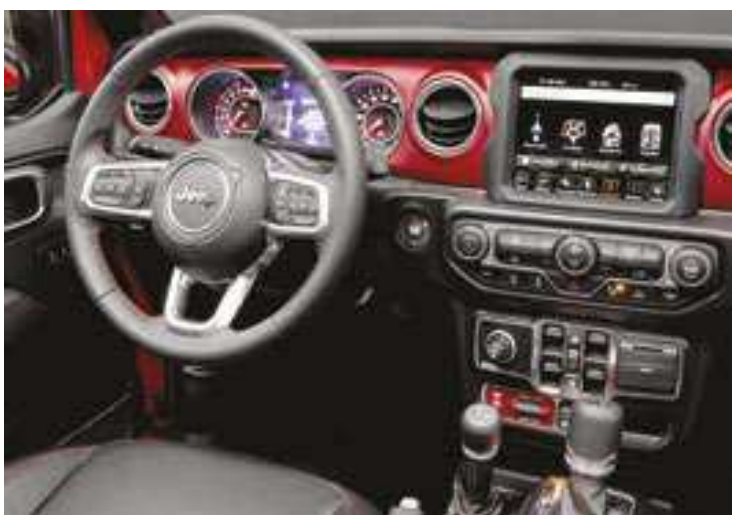
O interior da Gladiator contrasta com o visual externo, e traz um mundo moderno com conforto, comodidade e entretenimento

Caçamba: mil litros (674 quilos) Preço: a partir de R$ 499.990