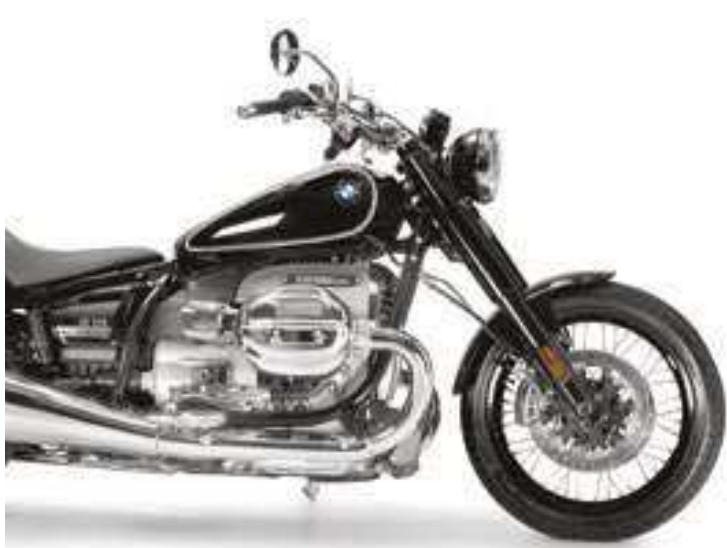
A R 18 é equipada com o maior motor boxer da BMW. Ele possui dois cilindros e foi desenvolvido para esse modelo