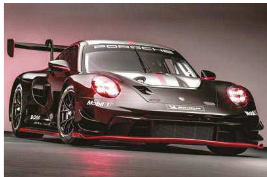
Apesar de ter nascido para as pistas, o novo 911 GT3 R tem base e estilo de um carro de produção

nos pneus traseiros, melho- rando a consistência do de- sempenho dos compostos em trechos mais longos. As pinças e os discos de freio no novo 911 GT3 R também são de com- petição. Os discos dianteiros de aço ventilados medem 390 milímetros de diâmetro e são acionados por seis pistões. Na traseira, estão pinças de quatro pistões e discos de 370 milí- metros. Um aplicativo de software sofisticado para o ABS de cor- rida de quinta geração reduz o desgaste dos pneus e freios, e o sistema de controle de tra- ção da Porsche recebeu um desenvolvimento adicional. (Daniel Dias, da AutoMotrix)