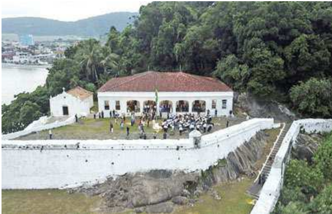
Nos primeiros 7 meses de 2022, cerca de 2.500 pessoas passaram pela Fortaleza da Barra Grande

Passou a concorrer ao título de Patrimônio Cultural da Humanidade pela Organização das Nações Unidas para a Educação, a Ciência e a Cultura (Unesco), em 2019,