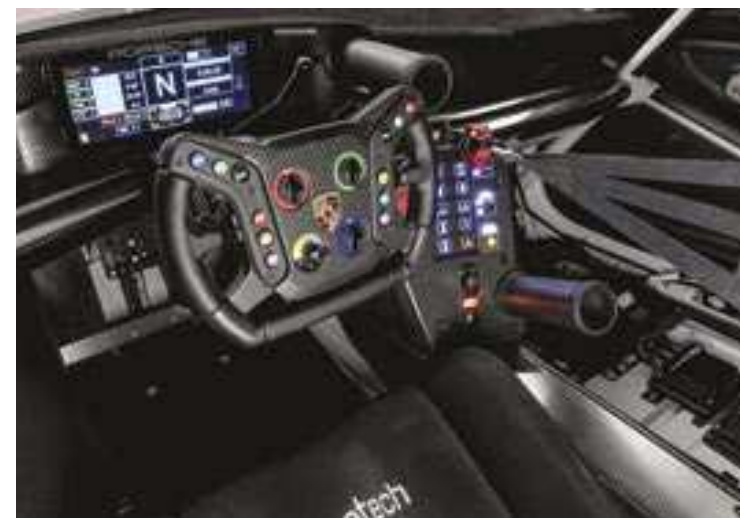
O design do volante incorpora elementos utilizados na Fórmula-1