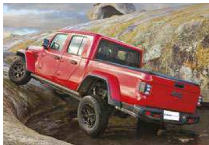
A topo de linha da Gladiator tem motor 3.6 V6 a gasolina, capaz de gerar 284 cavalos de potência a 6.400 rotações por minuto

A capacidade “Trailrated” é item de série na Gladiator Rubicon. Para ganhar esse selo, um veículo deve provar sua capacidade de resistir a um off-road poderoso. A avaliação é feita em cinco categorias: Submersão, Articulação, Barra Estabilizadora, Altura em Relação ao Solo e Manobrabilidade. Todas elas estão