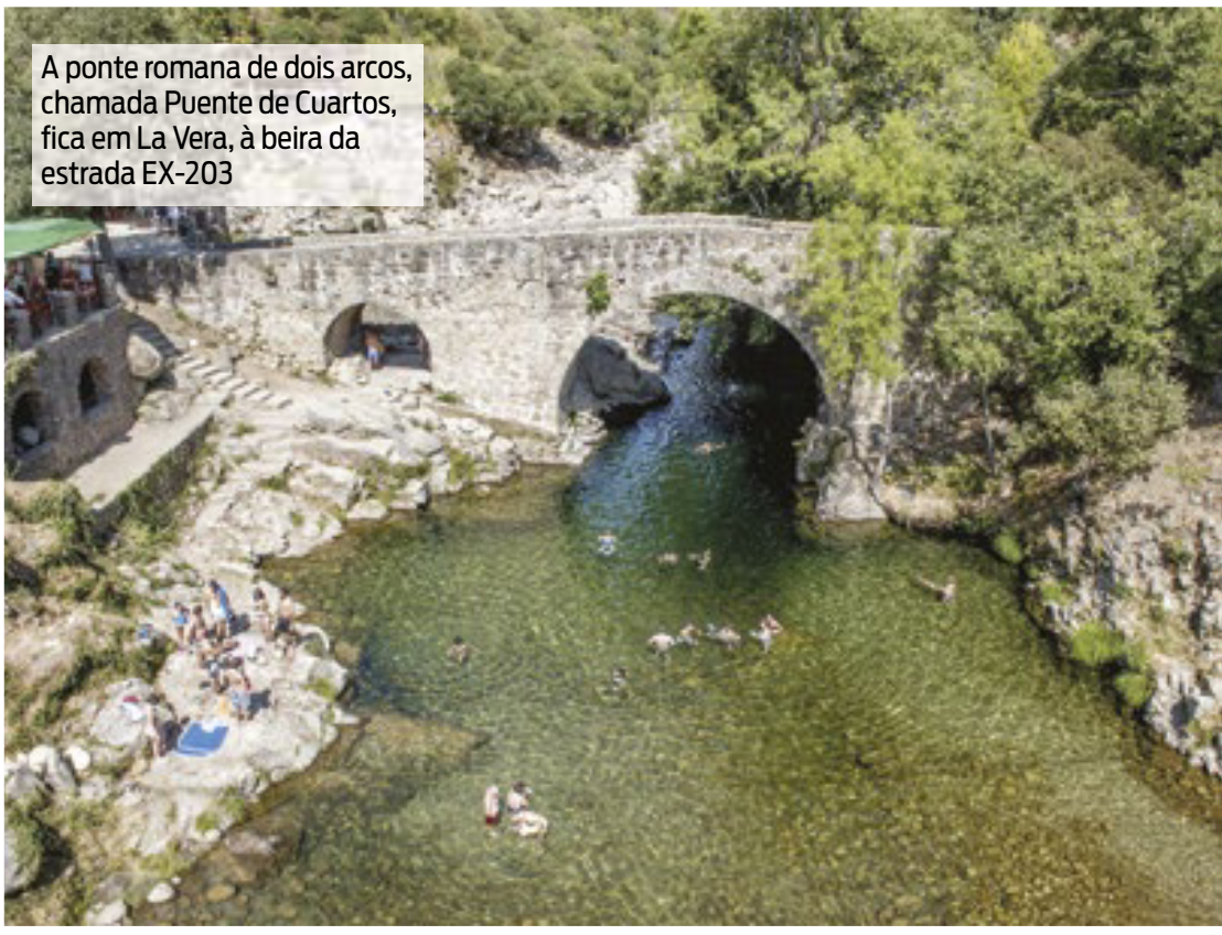
A ponte romana de dois arcos, chamada Puente de Cuartos, fica em La Vera, à beira da estrada EX-203