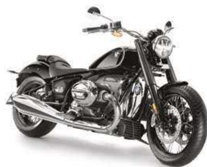
A R 18 mescla o estilo icônico dos modelos antigos com um visual moderno, sem perder de vista o design clássico e inspirado na R 5

Com suas linhas inspiradas na clássica BMW R 5 e toda tecnologia alemã para aproveitar a estrada, a cruiser R 18 foi lançada mundialmente em abril de 2020, tornando-se um sucesso. Equipada com o maior motor boxer já produzido pela BMW Motorrad, o modelo está sendo lançado agora no Brasil por R$ 139.900 e terá sua pré-ven- da iniciada no dia 18 de agosto. Os primeiros compradores ganharão o R18 Welcome Pack- age, um kit que conta com vá- rios itens exclusivos.