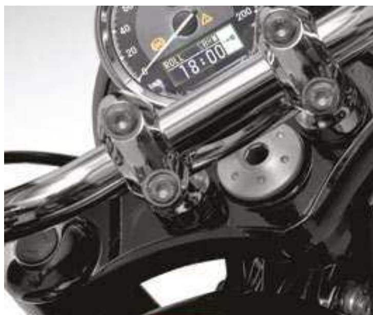
A nova R 18 também oferece os três modos de pilotagem padrão, para poder se adaptar às preferências individuais do piloto