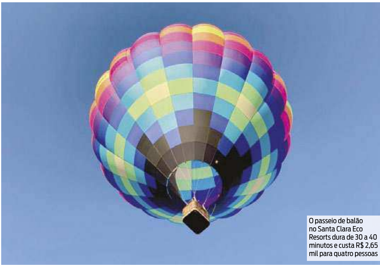
O passeio de balão no Santa Clara Eco Resorts dura de 30 a 40 minutos e custa R$ 2,65 mil para quatro pessoas