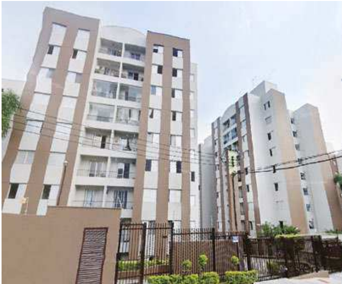
Os interessados em participar das disputas devem se cadastrar no site da Fidalgo Leilões

“Em alguns casos é possível o parcelamento de 20% de entrada e o restante do pagamento em até 59 parcelas, dependendo do lote”, diz o leiloeiro Douglas Fidalgo. (Gladys Magalhães)