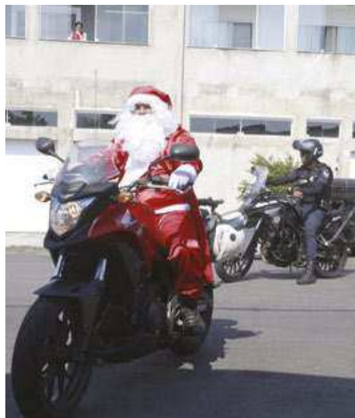
PREFEITURA MUNICIPAL DE GUARUJÁ

Horário: 9h30 e 15h30. Local: E.M. Professora Philo-