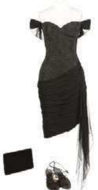
Réplica do icônico vestido “V de Vingança”, usado por Diana em 1994, deve ser vendida por algo entre R$ 49 mil e R$ 73 mil

Além da réplica do icônico vestido “V de Vingança”, que deve ser vendido por algo entre R$ 49 mil e R$ 73 mil, cha-