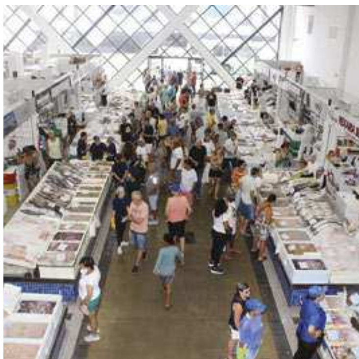
Entre os dias 28 e 30 de novembro, das 7h às 18h, os permissionários do Mercado de Peixes realizam o Festival da Tilápia

Rica em vitaminas D, A e B, a tilápia é vista como agente na prevenção de doenças cardiovasculares, na melhora da saúde de dentes, ossos, e na regeneração de tecidos e músculos. Para o festival, todos os comerciantes dos 20 boxes do Mercado se uniram para realizar negociações especiais com fornecedores e promover o evento.