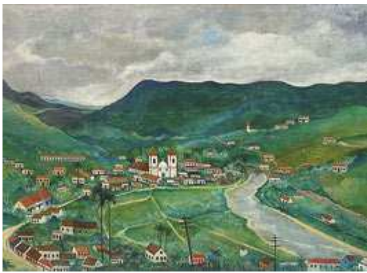
Obra de Alberto da Veiga Guignard tem o maior lance inicial do leilão

“É um leilão que nos deixa muito entusiasmados, por reunir um grande número de obras e nomes tão relevantes. Ao realizar este leilão, a Blombô oferece a oportunidade para colecionadores, independentemente do estilo da sua coleção, encontrar obras que possam valorizar