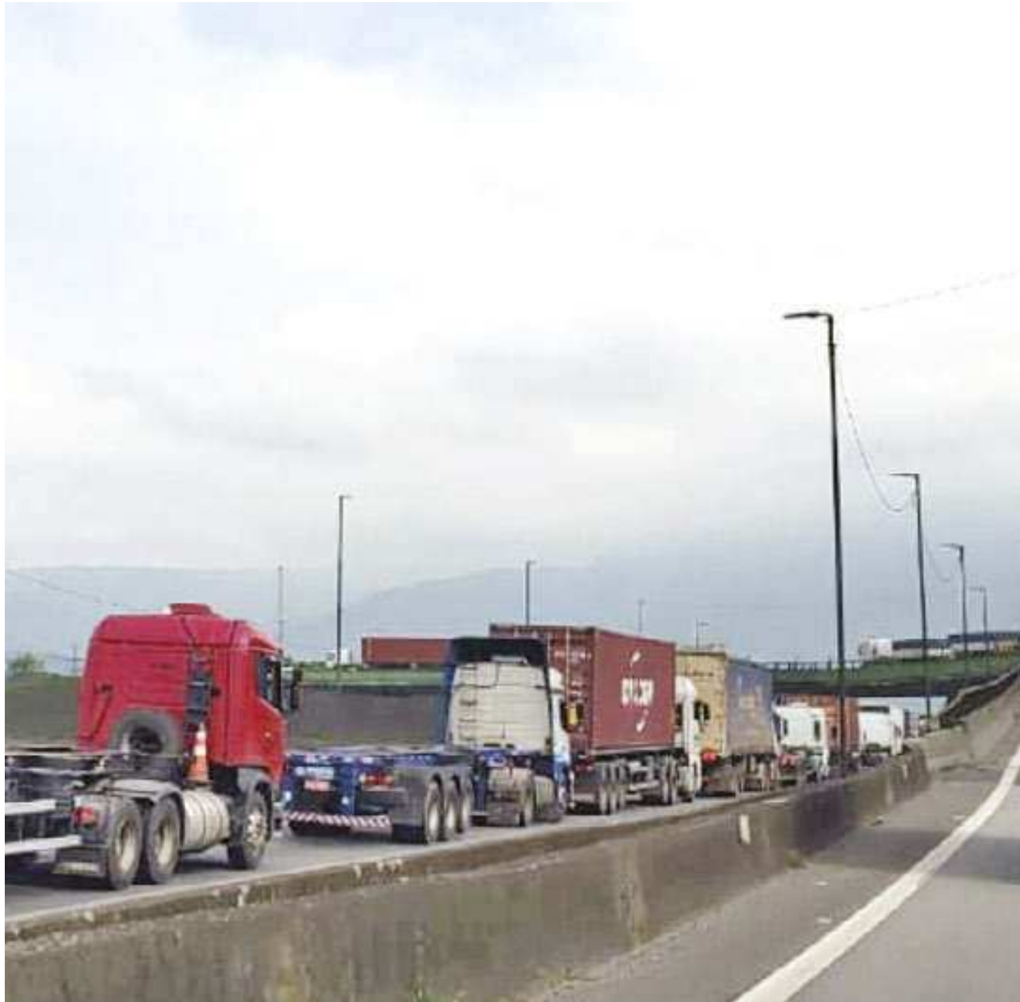
Congestionamentos na Cônego Domênico Rangoni estão causando traumas em caminhoneiros que flagram assaltos periodicamente

O caminhoneiro revela que nem a viatura da Polícia Militar, que fica na rotatória em frente ao Paço Municipal de Guarujá, na entrada da cidade, intimida os marginais. “Eles usam armas – revólveres e facas.