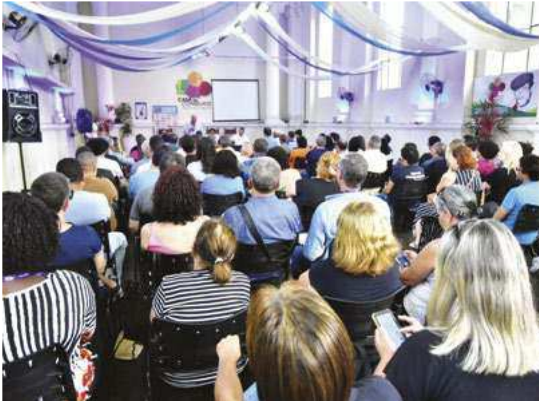
PREFEITURA MUNICIPAL DE PETRÓPOLIS

O edital foi publicado no Diário Oficial (D.O.) na semana seguinte e as inscrições foram iniciadas no dia 25 de novembro e seguem até 28 de dezembro e devem ser feitas pelo link: www.inqc.org.br , que estará disponível também no site da Prefeitura ( petropolis.rj.gov.br ). O pedido de isenção da taxa de inscri-