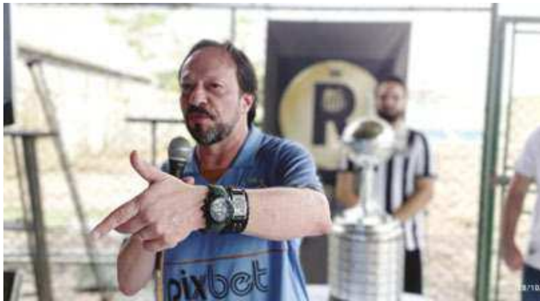
As eleições do Santos estão marcadas para o próximo fim de semana

mento], o que eu acho muito pequeno, menos de 10% de chance, a gente tem uma programação pra fazer o time