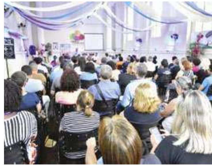
PREFEITURA MUNICIPAL DE PETRÓPOLIS

O edital prevê 73 vagas para preenchimento de cargos operacionais e administrativos, para contratação imediata. Além de vagas em diversos cargos para formação de Cadastro de Reserva, para futuras contratações da Companhia. Também há vagas destinadas para pessoas com deficiência, negros e indígenas. As provas acontecem no dia 28 de janeiro de 2024 e o resultado final será