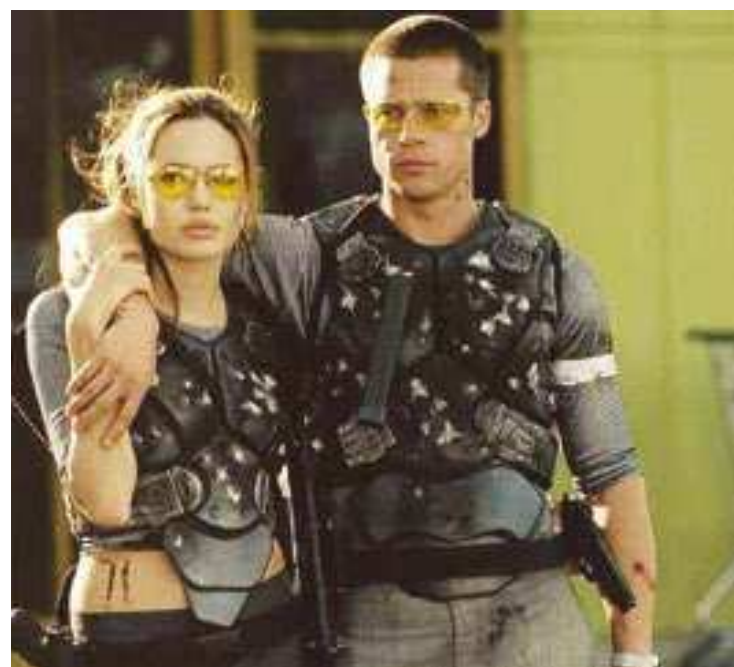
Brad Pitt e Angelina Jolie compraram o imóvel por US$ 3,5 milhões, em 2006; após a separação, em 2016, a mansão foi vendida

Brad e Jolie compraram o imóvel por US$ 3,5 milhões, em 2006. Após a separação, em 2016, a mansão foi vendida por US$ 4,9 milhões passando por vários proprietários, entre eles, o co-fundador da Microsoft, Paul Allen. Foi nessa mansão que Pitt criou a fundação Make It Right para ajudar vítimas do furacão Katrina, que devastou boa parte da cidade, um ano antes da