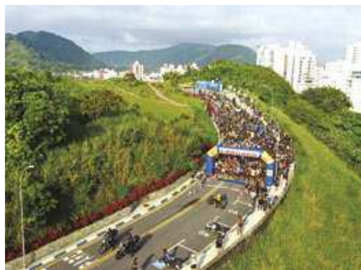
HELDER LIMA / PREFEITURA DE GUARUJÁ

Além do incentivo ao esporte, o evento tem como objetivos a inclusão social e confraternização entre os adeptos da modalidade. É aberto a atletas anônimos, amadores, profissionais, equipes, associações, federações, clubes e confederações. Para esta edição, a organização estima a presença de mil corredores, com faixa etária a partir de 16 anos de idade, divididos em 25 categorias, separados por idades de cinco em cinco anos, no masculino e feminino.