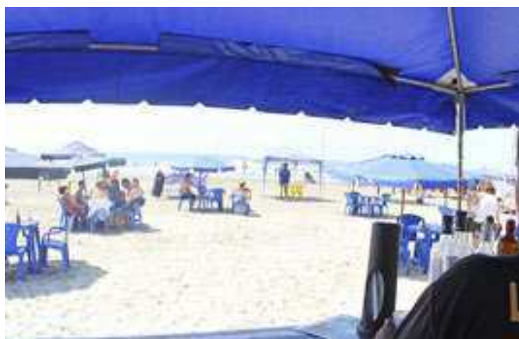
Para renovar a licença definitiva o ambulante deve comparecer na Secretaria de Finanças (Sefin), de segunda a sexta-feira

Apenas têm direito a esse prazo os ambulantes aprovados no curso anual obrigatório, porém, os ambulantes reprovados poderão requerer a renovação da autorização se comprovarem, mediante apresentação de documentos, “a ocorrência de caso fortuito ou força maior”. A lei considera ainda que a Administração Municipal pode determinar, a qualquer momento, a realização de recenseamento dos ambulantes para confirmação das infor-