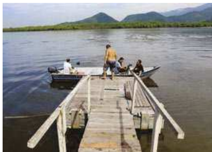
A Área de Proteção Ambiental Serra do Guararu, em Guarujá

A TPA é exclusiva para veículos de visitantes e isenta moradores de Guarujá, incluindo proprietários de casas de veraneio, além das oito demais cidades da Baixada Santista. O mesmo vale para au-