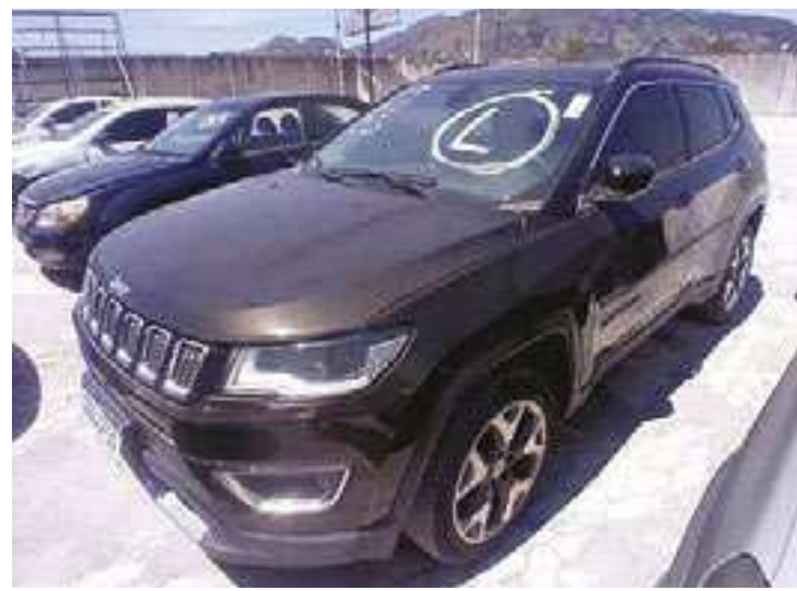
Ao todo estão disponíveis 322 veículos, incluindo carros e motos

Ao todo estão disponíveis 322 veículos, incluindo carros e motos, com lances iniciais até 80% abaixo do valor de mercado. Entre os lotes, vale destacar um Mercedes CLA 45 AMG, 2016, que pode ser arrematado a partir de R$ 78,7 mil. Há ainda um Jeep Compass Limited, 2018, que possui lance mínimo