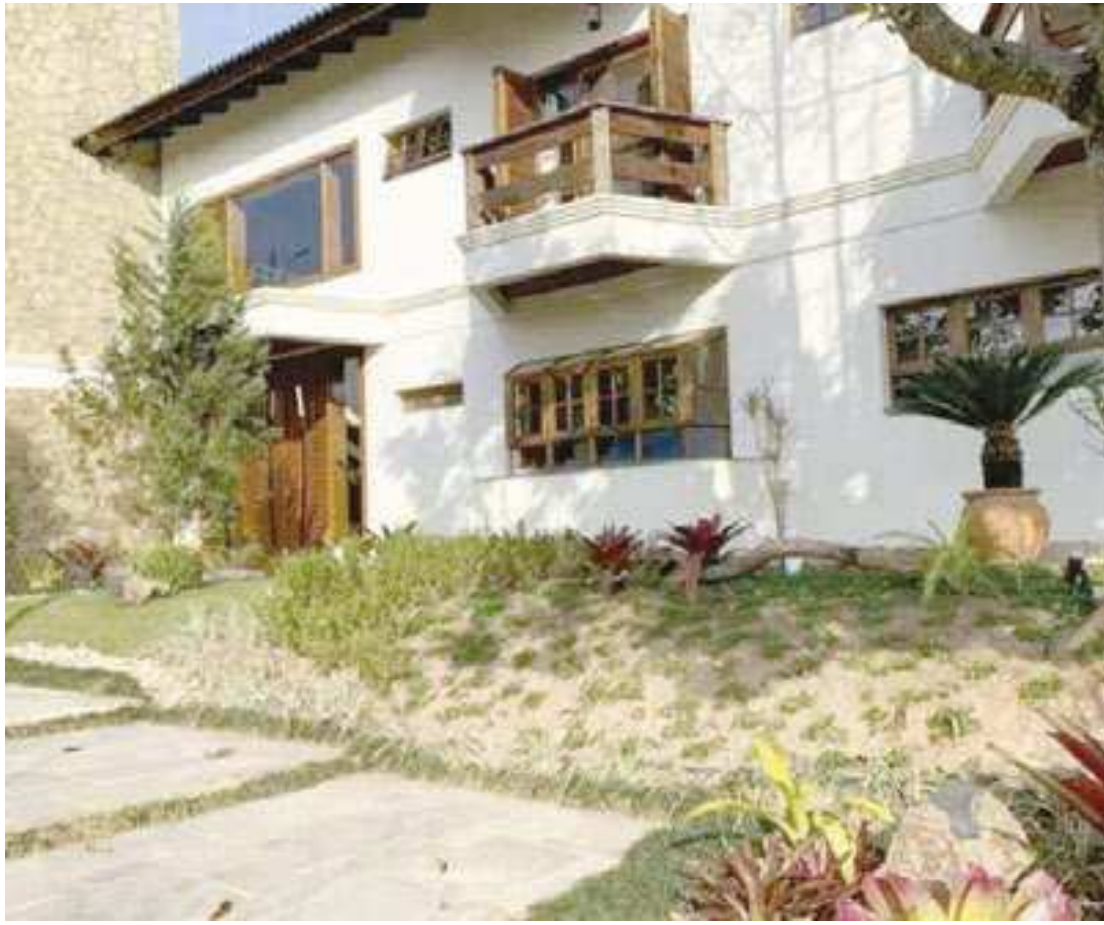
No certame, os lances iniciais para arrematar um imóvel variam de R$ 36 mil a R$ 6 milhões

No total, o estado de São Paulo conta com mais de 40 lotes disponíveis no leilão. Entre as oportunidades vale