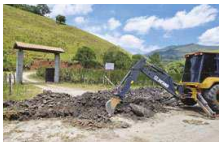
Um loteamento irregular não dá direito ao comprador sobre a posse do terreno, havendo prejuízos financeiros para o mesmo

vel, o interessado deve procurar a prefeitura para verificar sobre sua regularidade. Para obter informações, ligue para 4658-1723 ou 4616-0389 ou envie um email para: obras@