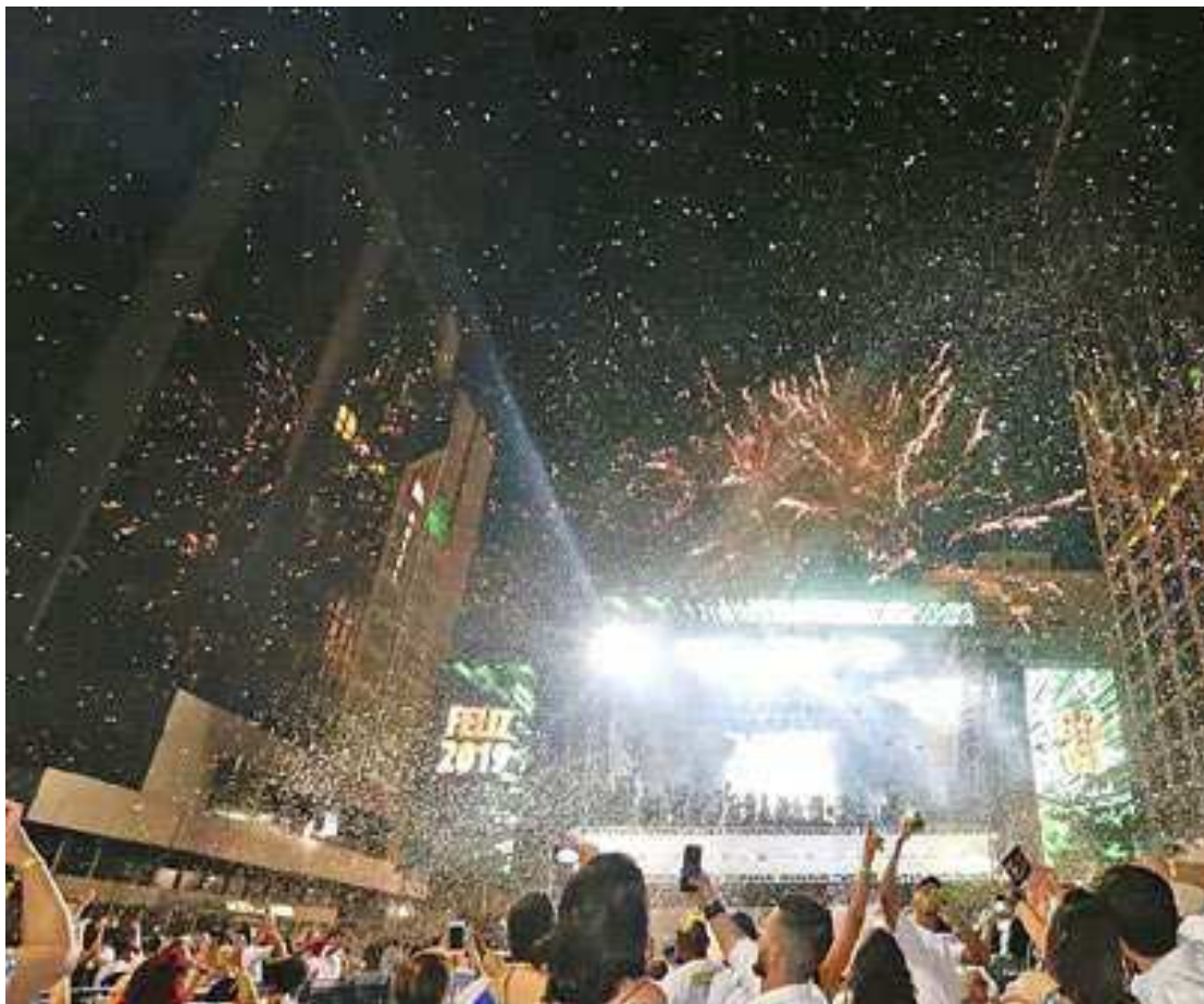
Este ano, a festa terá shows de Zezé di Camargo, Ton Carfi, Claudia Leitte, Chitãozinho & Xororó

O palco começará a ser montado neste sábado, com a parte estrutural sendo concluída no dia 27. As interdições acontecerão das 22h às 24h para descarregamento de materiais e de 0h às 5h para as montagens. A estrutura será retirada a partir do dia 1º de janeiro, logo após os shows para garantir o deslocamento seguro da população paulistana. (AB)