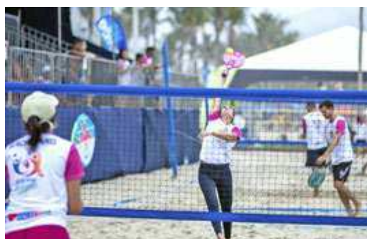
Para participar, os interessados devem se inscrever no Ginásio Municipal Alberto Alves, de segunda a sexta, das 9h às 16h

No local, basta preencher o formulário de inscrição e doar o alimento correspondente a cada modalidade. Os alimentos ar-