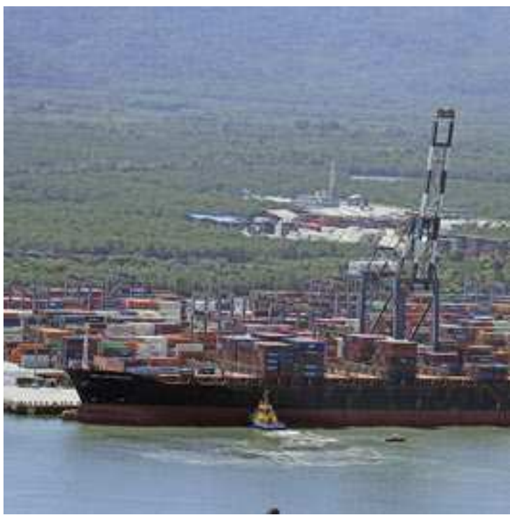
Os atrasos nas escalas dos navios contratados para embarque de café vêm subindo desde junho

“Há muita complexidade para se mensurar valores exatos, mas, sem dúvida, há prejuízo com custos que envolvem armazenagem adicional, pré-stacking e atraso no recebimento do pagamento pelo café, o que interfere e atrasa o