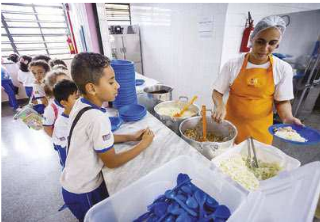
Seduc-SP propõe aumento de até 40% no repasse às prefeituras para alimentação escolar

“O planejamento para a alimentação escolar de 2024 leva em consideração as re-