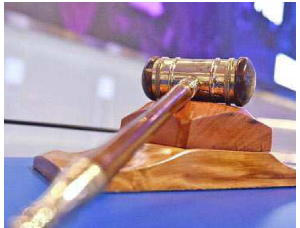
MINISTÉRIO DA INFRAESTRUTURA / AGÊNCIA BRASIL

» O órgão afirma que não entra em contato para informar sobre a realização de leilões e que o único canal disponível é o Sistema de Leilão Eletrônico, que é acessado pelo e-CAC (Centro Virtual de Atendimento ao Contribuinte)