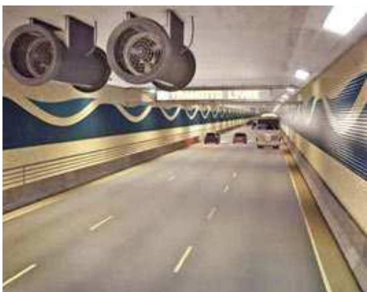
A construção da ligação seca está incluída no PAC

Já para a audiência pública marcada para o dia 18, também a partir das 9h, o local escolhido será o Teatro Municipal Procópio Ferreira, na