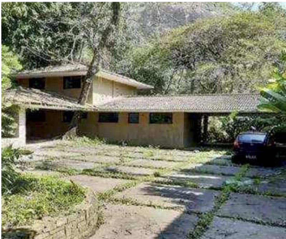
Entre os lotes disponíveis no leilão Santander e Zuk, há imóveis residenciais, comerciais e terrenos

No estado de São Paulo há 100 imóveis disponíveis no leilão. Um dos lotes é uma casa, de 56 m 2 , na cidade de