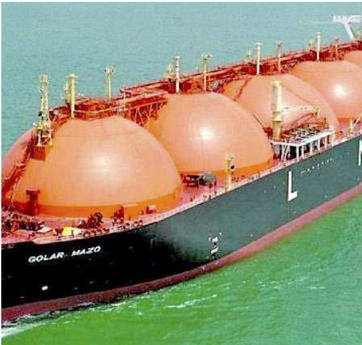
MP-SP prevê acidentes relacionados à ruptura catastrófica ou grande vazamento com ignição do gás armazenado nos tanques dos navios

No recurso, a Promotoria pede à Justiça a decretação de nulidade dos atos administrati-