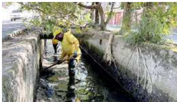
PREFEITURA MUNICIPAL DE GUARUJÁ

O prefeito de Guarujá, comemora o resultado e reforça que é fruto de uma mobilização coletiva. "Desde 2017, investimentos em pesquisas, projetos e regulamentações.