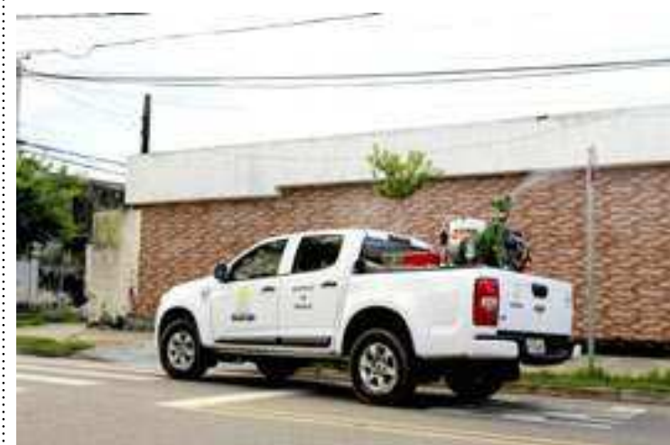
PREFEITURA MUNICIPAL DE GUARUJÁ

são contempladas. Devem ser vacinados, mediante apresentação de prescrição médica, a partir de 1 ano de idade, num esquema de 3 doses, a segunda após 2 meses da primeira e a terceira dose, 6 meses após a primeira aplicação. (DL)