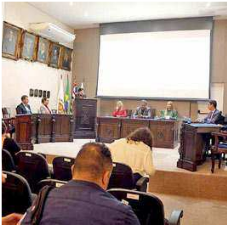
A primeira audiência pública está marcada para acontecer na Associação Comercial de Santos amanhã, dia 17

Dia 18 de abril, às 9h, no Teatro Municipal Procópio Ferrei-