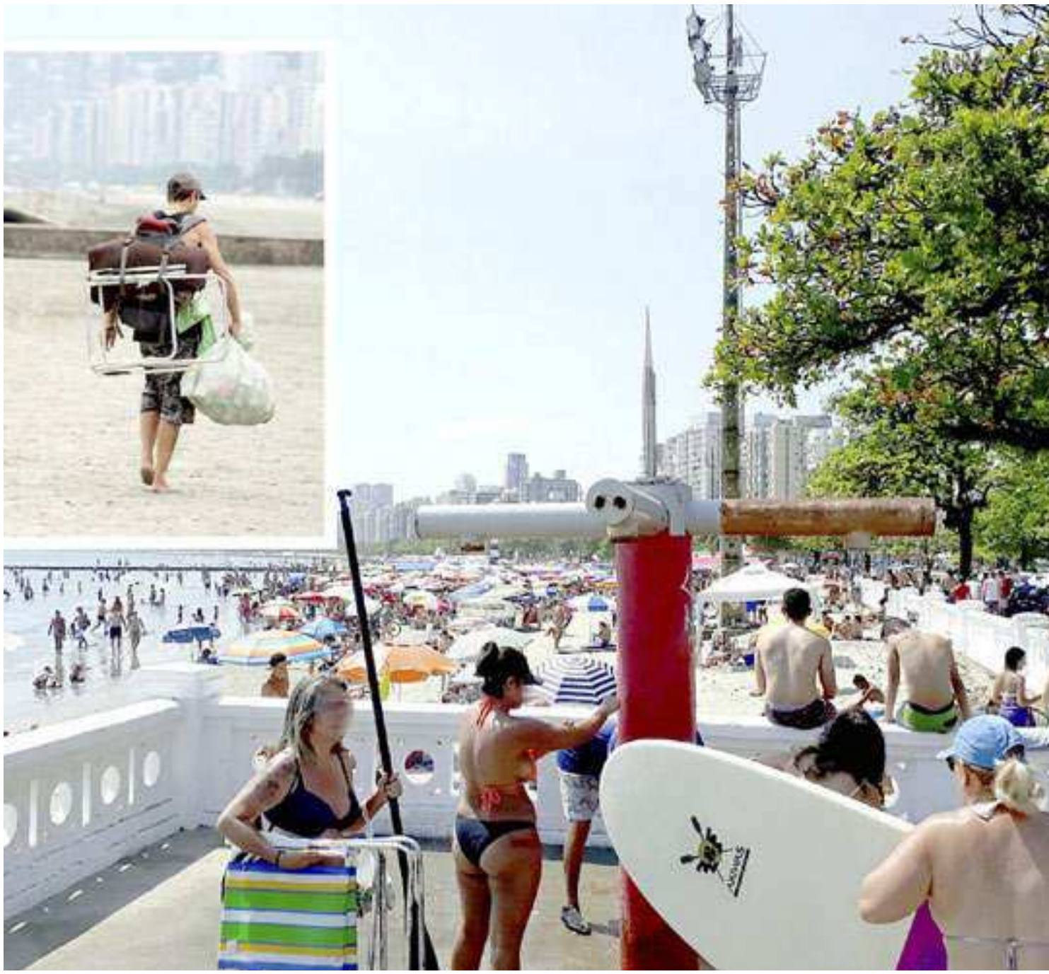
Chuveirinhos de Santos não só são usados para lavar pertences do cidadão (ã) em situação de rua (foto detalhe), mas de todas as pessoas

"Inicialmente, temos a impressão de ser um projeto com viés eleitoral, já que discretamente 'joga pra galera' o debate de um problema que é muito mais profundo do que simplesmente pessoas dormindo nas ruas e lavando suas roupas em chuveiros pú-