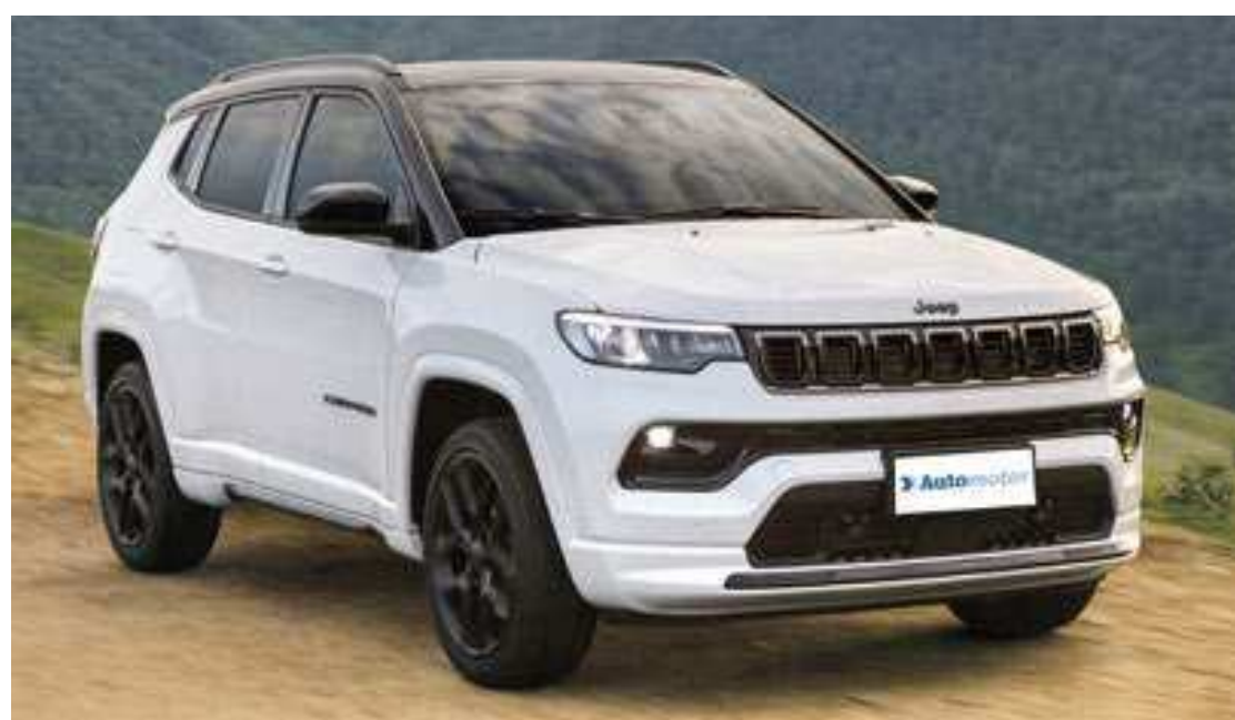
O SUV médio da Jeep acelera de zero a 100 km/h em 6,3 segundos e atinge a velocidade de 228 km/h