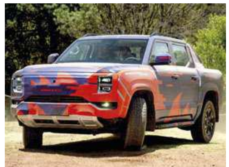
A picape híbrida plug-in da BYD terá motor a combustão

A picape da BYD virá de fábrica com a bateria Blade, que aproveita as vantagens de segurança inerentes aos materiais de fosfato de ferro e lítio. Ela emprega uma tecnologia de revestimento em pontos