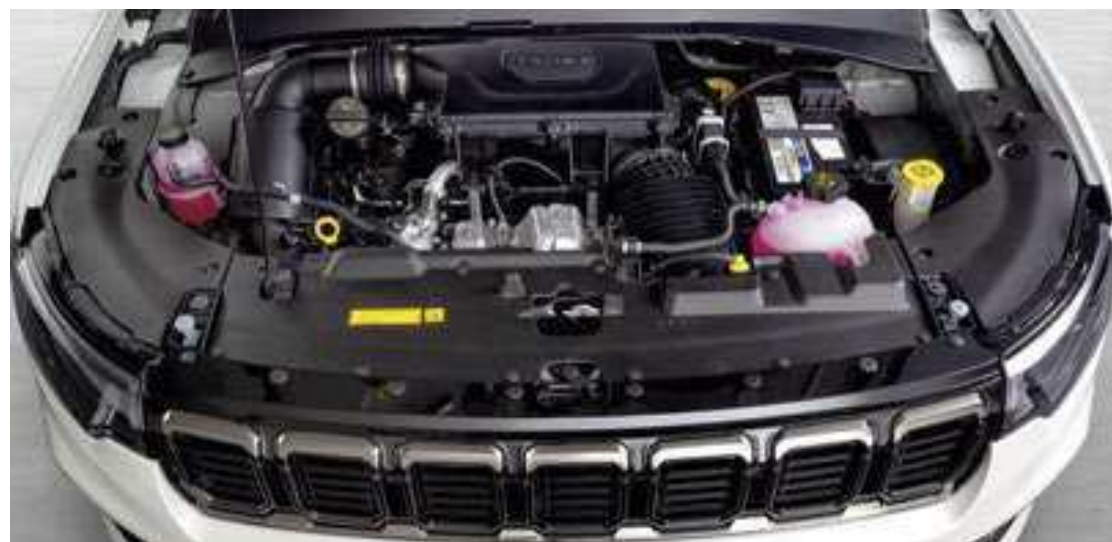
A aposta do Compass 2025 é o motor Hurricane 2.0 turbo, com quatro cilindros em linha e a gasolina