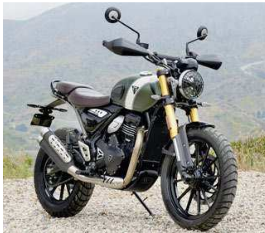
A Scrambler 400 X investe em toques tradicionais, como o cilindro refinado com aletas e braçadeiras no coletor de escapamento