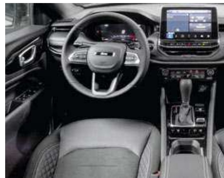
Na central multimídia de 10,1 polegadas, a tela Full HD com navegação embarcada de série tem a Adventure Intelligence