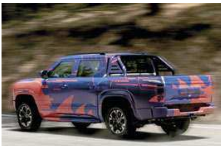
A picape da BYD virá de fábrica com a bateria Blade, que tem as vantagens de segurança dos materiais de fosfato de ferro e lítio

tros, com aproximadamente cem quilômetros de alcance no modo 100% elétrico.