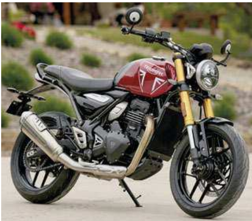
A Speed 400 tem esquema de pintura de dois tons, cada um com um gráfico de tanque Triumph proeminente, refletindo seu estilo roadster dinâmico

A Scrambler 400 X tem as carcaças do motor revestidas a pó preto, garfos anodizados dourados rígidos, pintura de alta qualidade e detalhes do logotipo. O modelo inclui ainda proteção para o farol, radiador e carter, protetores de mão, apoio de guidão acolchoado e para-lama dianteiro mais longo. A Scrambler 400 X está disponível em dois esquemas de cores, ambas com a distinta faixa de tanque 'Scrambler' e o emblema triangular da Triumph: Matt Khaki Green e Fusion White e Phantom Black e Silver Ice. (Edmundo Dantas - Automotrix)