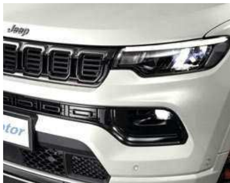
A linha 2025 do Compass recebeu nova grade dianteira, com variações para cada versão

Entre os sistemas de segurança de série do Compass estão sete airbags, sistema de detecção de pressão dos pneus, controle de tração, Panic Brake Assist, assistente de partida em aclives, Dynamic Steering Torque, sistema eletrônico anticapotamento, Trailer Sway Control, freio ABS e controle de estabilidade. (Luiz Humberto Monteiro Pereira - AutoMotrix)