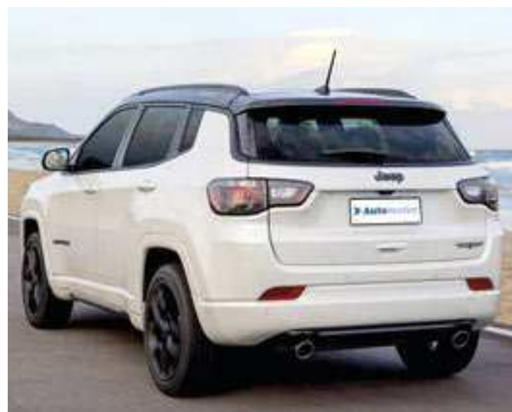
Na Blackhawk, o porta-malas tem abertura e fechamento eletrônicos e sensor de presença