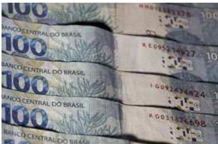
Em relação às Receitas Administradas pela Receita Federal, o valor arrecadado, em março, foi R$ 182,87 bilhões

sempenho é explicado pelo acréscimo na arrecadação no setor de combustíveis com a retomada da tributação incidente sobre o diesel e gaso-