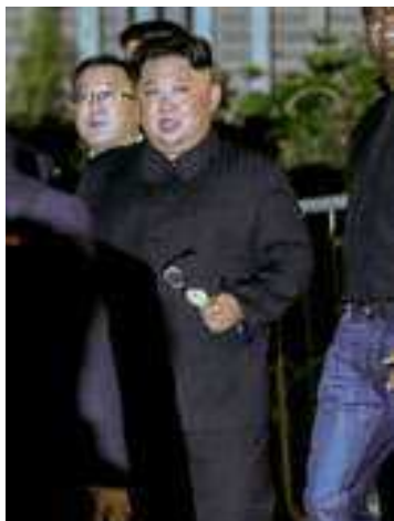
Kim Jong-un acompanhado de um exercício neste mês

confiabilidade dos sistemas de comando, administração, controle e operação de toda a força nuclear", de acordo com a agência oficial norte-coreana.