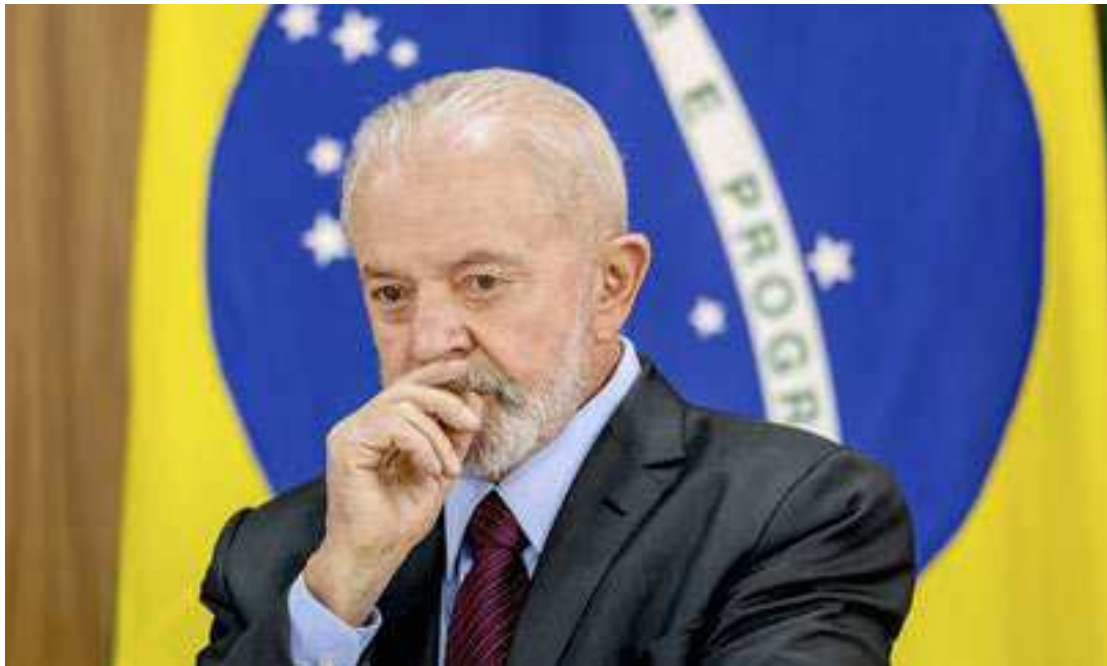
Lula desafiou os profissionais de imprensa a estudar o que tem ocorrido no país nos últimos 14 meses

"O problema é que tudo no Brasil é tratado como gas-