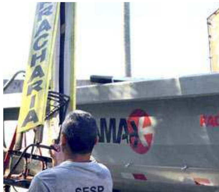
Dentre os itens retirados, estão cavaletes, placas, banners, bikes e bandeiras. Todas as ações são respaldadas pela legislação

Caso o munícipe presencie um demonstrativo de publicidade ilícita, deve acionar a GCM pelo telefone 153. (DL)