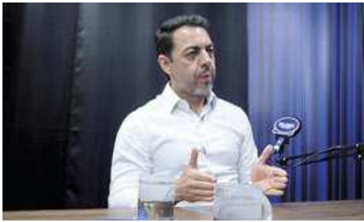
Pomini destacou que serão necessários três quilômetros de obras para realizar a segunda fase da Perimetral

Pomini destacou que serão necessários três quilômetros de obras para realizar a segunda fase da Perimetral, que segregará o alto fluxo de caminhões com destino aos terminais portuários, não interferindo no fluxo viário do Município. Desta maneira, a Rua Idalino Pinez volta ao