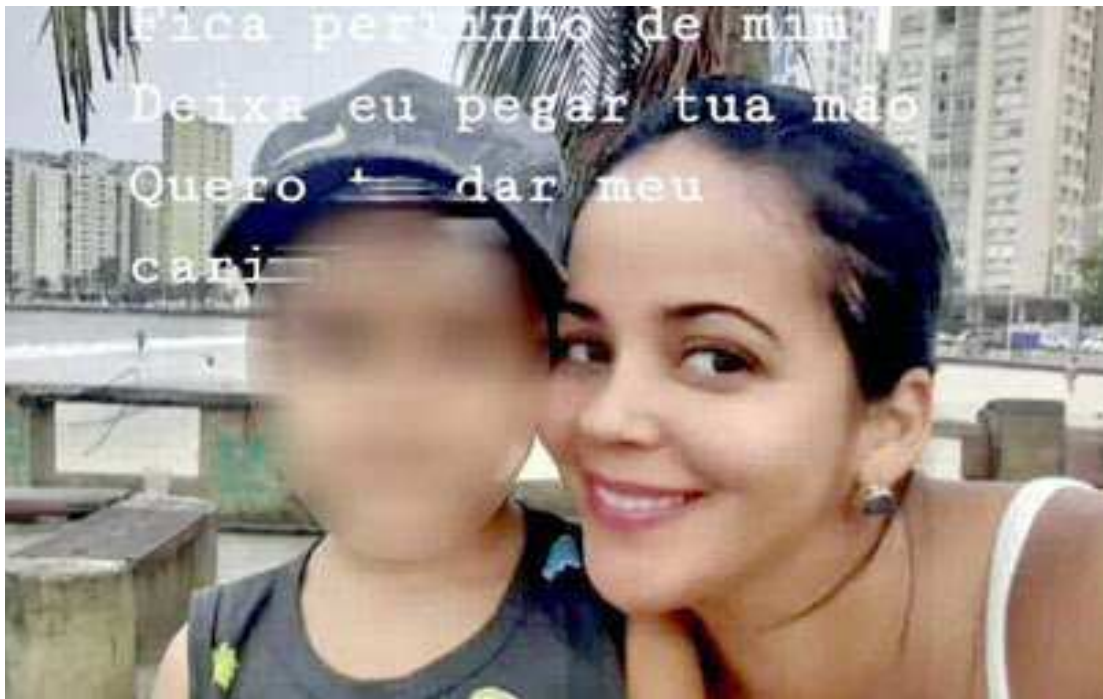
Pai afirma que mãe já havia ameaçado levar o menino para o nordeste