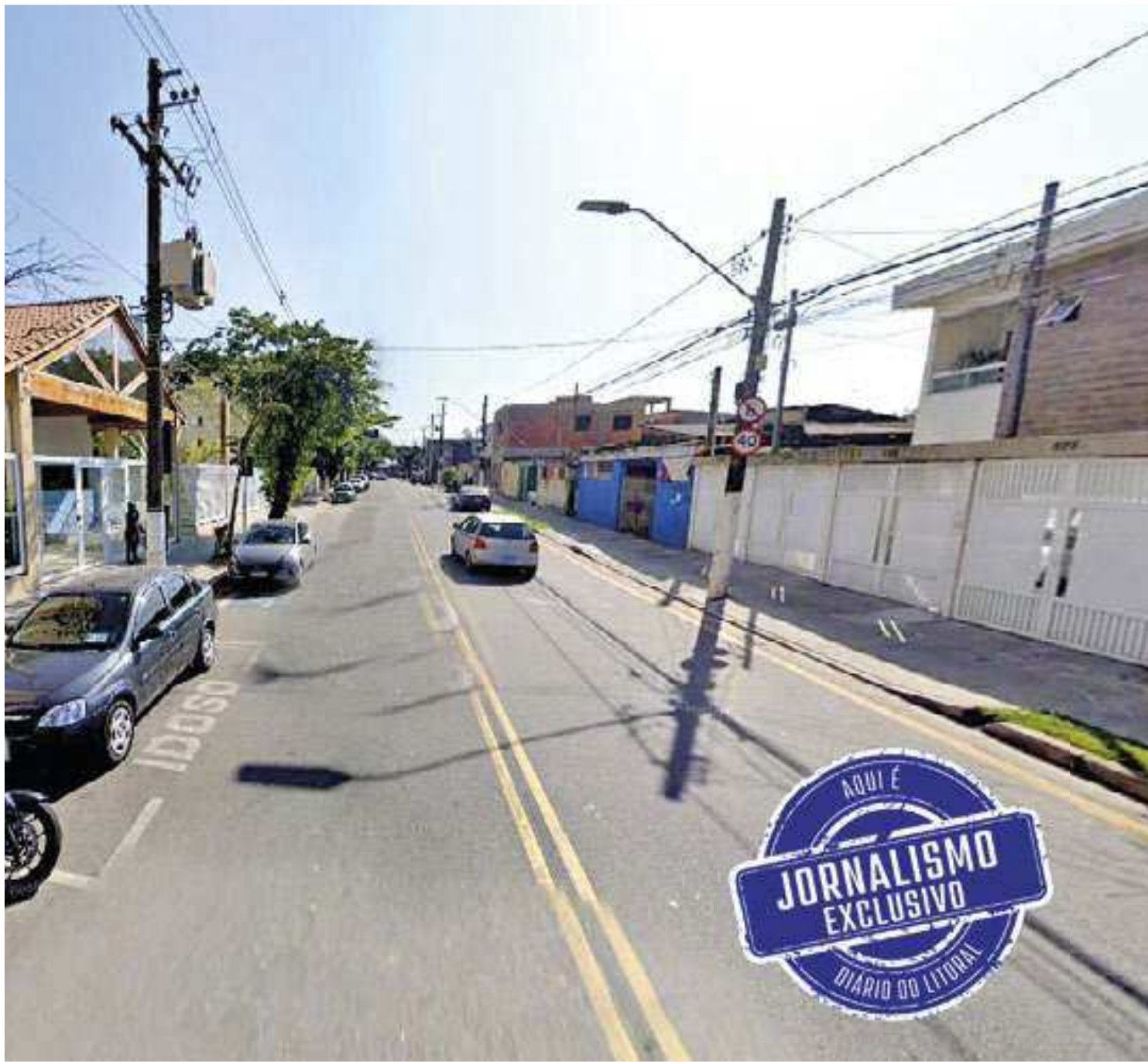
Obra do Hospital Pediátrico será realizada na Avenida Manoel Ferramenta Júnior, na Zona Noroeste de Santos