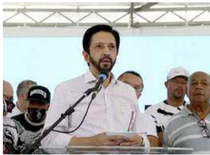
Nunes recebeu apoio do Mobiliza para reeleição à Prefeitura de SP

O entorno do prefeito ainda afirma ter a possibilidade do União Brasil e da federação PSDB-Cidadania embarcarem em sua pré-campanha. O presidente do diretório municipal do PSDB, José Aníbal, porém, já afirmou que não deve apoiar Nunes por não aceitar