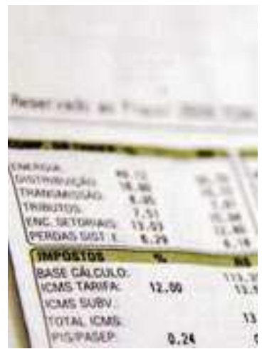
Proposta consta do projeto de regulamentação da reforma tributária

» As famílias mais pobres ou inscritas em programas sociais poderão receber de volta 50% da Contribuição sobre Bens e Serviços (CBS, tributo federal) paga nas contas de luz, água, esgoto e gás encanado. A proposta consta do projeto complementar de regulamentação da reforma tributária, enviado na quarta-feira (24) à noite ao Congresso. Em relação ao Imposto sobre Bens e Serviços (IBS), cobrado pelos estados e pelos municípios, a devolução ficará em 20% sobre as contas desses serviços. O ressarcimento também beneficiará apenas famílias de baixa renda. No caso do botijão de gás, a devolução será de 100% da