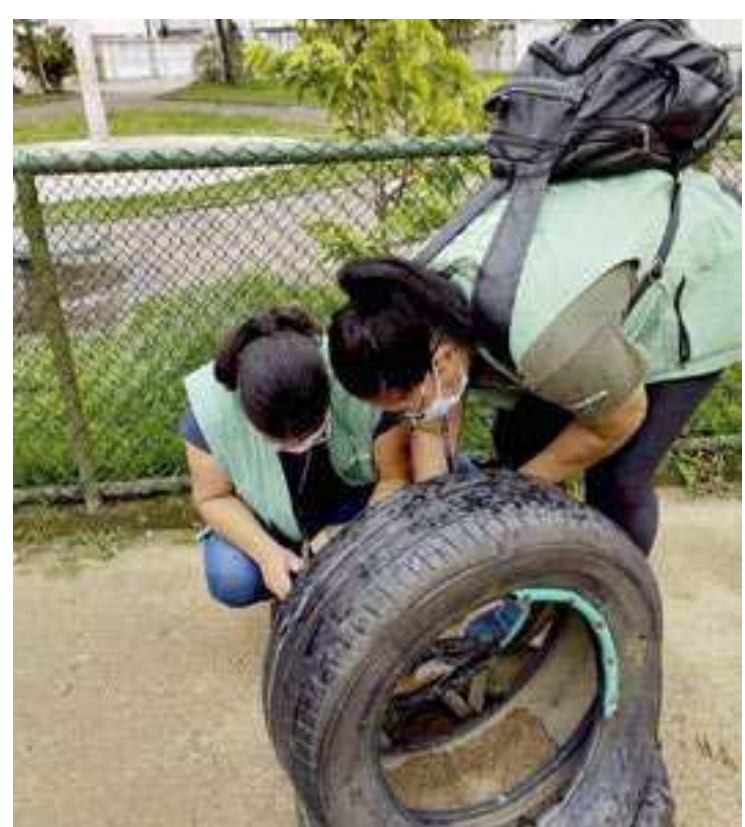
As mortes pela doença este ano também já representam um aumento de 52% em relação ao ano passado

O Brasil já chega a um coeficiente de incidência de casos de 1.897,4, número que indica situação epidêmica, de acordo com definição da OMS (Organização Mundial de Saúde). Para o órgão de saúde, a definição é quando há incidência acima de 300 casos por 100 mil habitantes. De acordo com a organização, a epidemia da dengue neste ano pode ser a pior da história. Em entrevista a jornalistas, a OMS afirmou que o aumento de casos é observado em toda a América Latina e no Caribe, porém três países encabeçam uma situação mais preocupante do cenário da doença: Brasil, Paraguai e Argentina, que representam 92% dos casos e 87% das mortes relacionadas ao vírus. A organização disse que a doença segue um padrão sa-