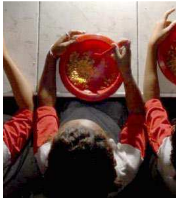
56,7 milhões de famílias brasileiras encontram-se nessa situação

ORÇAMENTOS FAMILIARES. Na comparação com o último levantamento sobre segurança alimentar, a Pesquisa de Orçamentos Familiares (POF) realizada em 2017 e 2018, no entanto, houve uma melhora na situação. O percentual de domicílios em situação de segurança alimentar subiu de 63,3% em 2017/2018 para 72,4% em 2023. Já aqueles que apresentavam insegurança alimentar moderada ou grave recuaram de 12,7% para 9,4%. A insegurança alimentar leve também caiu, de 24% para 18,2%. “A gente teve todo um investimento em programas