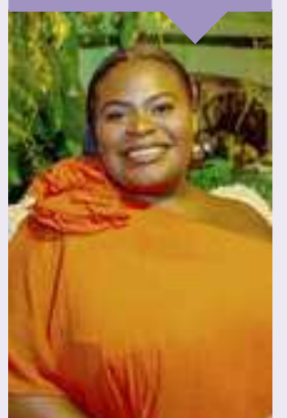
TOM ZÉ

"Como você pode chamar alguém de ordinária sem conhecer a pessoa?"