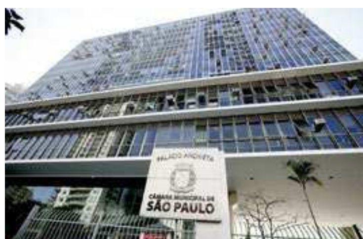
Na última quarta-feira (17), os vereadores aprovaram em primeira votação um projeto de lei que autoriza a privatização

“Nossa ação continua dando frutos. A Justiça proibiu a venda da Sabesp sem passar por todas as audiências. O mínimo. Nosso patrimônio não pode ser sucateado num processo que passa por cima da dis-