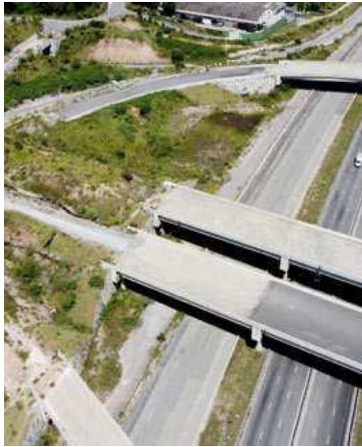
A obra foi orçada inicialmente em R$ 4,3 bilhões, mas, até 2019, já tinha consumido cerca de R$ 6,85 bilhões

A obra será dividida em duas etapas. Na primeira, entre as rodovias Presidente Dutra e Fernão Dias, com previsão de en-