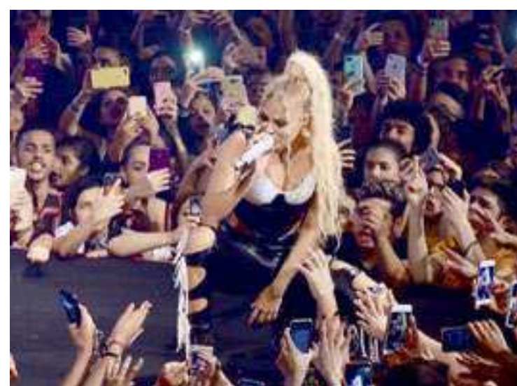
EDUARDO MARTINS / AGNEWS