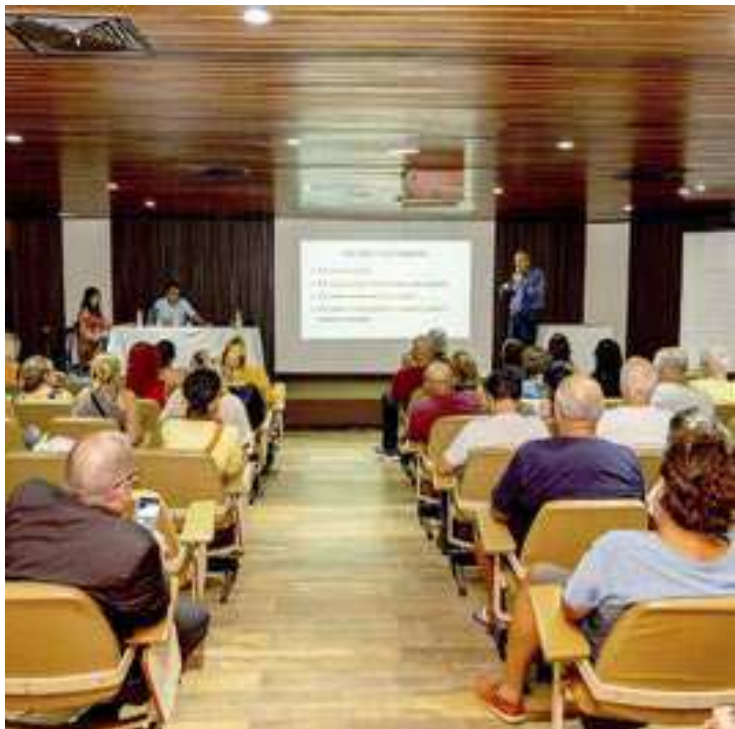
Prefeitura de Guarujá receberá a sociedade civil na Universidade do Oeste Paulista (Unoeste), às 18 horas, no próximo dia 6

Durante a agenda, a Secretaria Municipal de Meio Ambiente e Segurança Climática (Semam), que está à frente das tratativas, apresentará a nova sugestão de traçado da