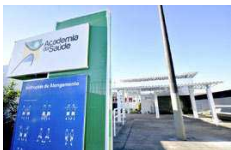
Unidades do Maracanã, Samambaia e Antártica são as primeiras

» Os usuários das Academias da Saúde do Maracanã, Samambaia e Antártica vão ter mais conforto e segurança para praticar as atividades físicas desenvolvidas nas unidades. Na próxima segunda-feira (03), será entregue a revitalização e ampliação da cobertura dos três equipamentos que realizam um fundamental trabalho de promoção da saúde e prevenção e controle de doenças. Em breve, outras unidades também serão beneficiadas. A ampliação da cobertura permitirá a realização de atividades mesmo em dias de chuva, além de proteger os frequentadores em dias de sol. Além disso, poderão ser programadas outras atividades além das físicas, como trabalhos de grupo, rodas de terapia comunitária e demais