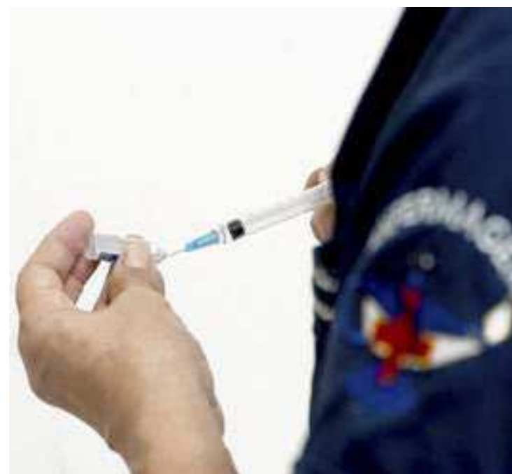
A nova vacina é baseada na cepa XBB da variante Ômicron

comprometida ou não). Estudos científicos mostraram que a resposta imunológica proporcionada por esta dose aos atuais vírus em circulação é superior à dos imunizantes fabricados a partir da cepa original do coronavírus. A meta estipulada pelo Ministério da Saúde é de que os municípios devem vacinar 90% da população. Para a ampliação do público a ser imunizado, o Município depende das orientações do Ministério da Saúde. Pela primeira vez a vacina é utilizada no Brasil, após ter sido aprovada e registrada