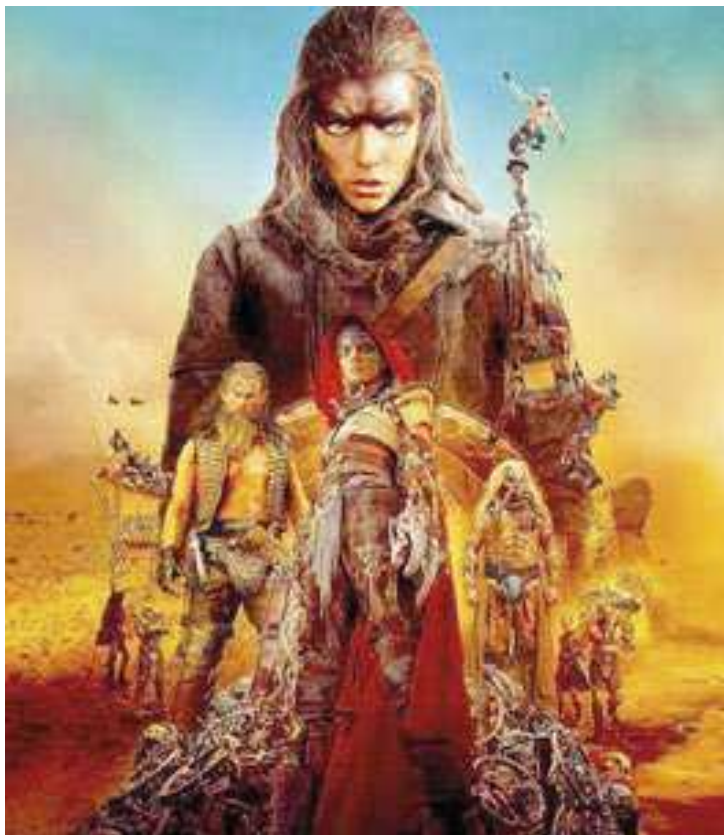
"Furiosa: Uma Saga Mad Max" não apresenta a fúria esperada