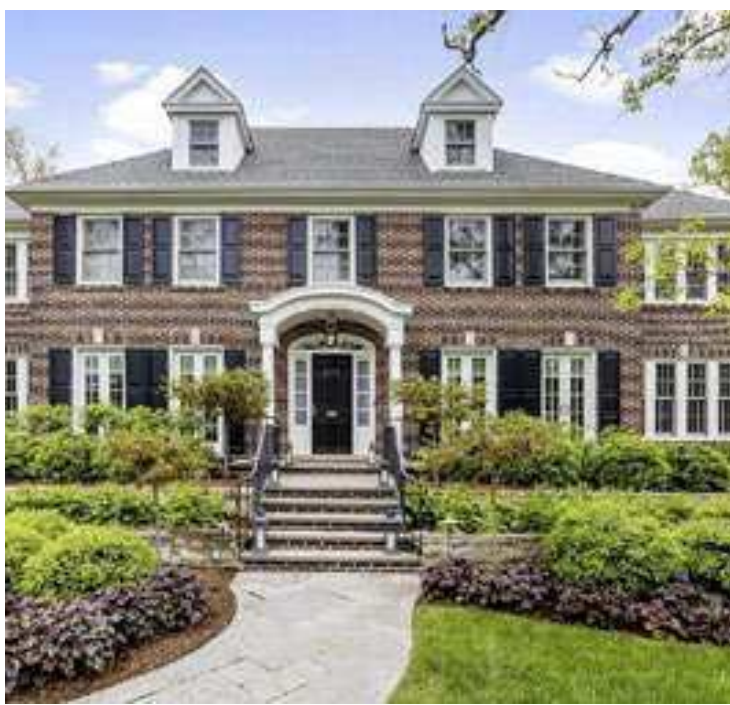
O casarão é definido como “uma casa de férias dos sonhos”

Segundo o anúncio, a casa, localizada em Ilinois, nos EUA, tem área de 847 m², cinco quartos, seis banheiros, quadra esportiva, cinema e uma ampla sala de estar. O imóvel, no longa, ficou conhecido por ser palco de várias armadilhas feitas pelo personagem de Macaulay Culkin, que era esquecido pelos pais em casa no Natal e tinha de se defen-