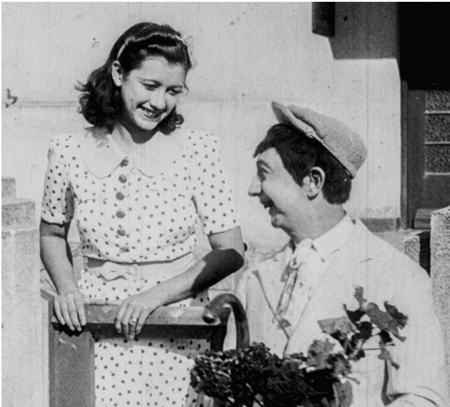
A Cinemateca passou por outros incêndios antes em 1957, 1979 e 1982, e as chamas consumiram, no total, metade de sua coleção