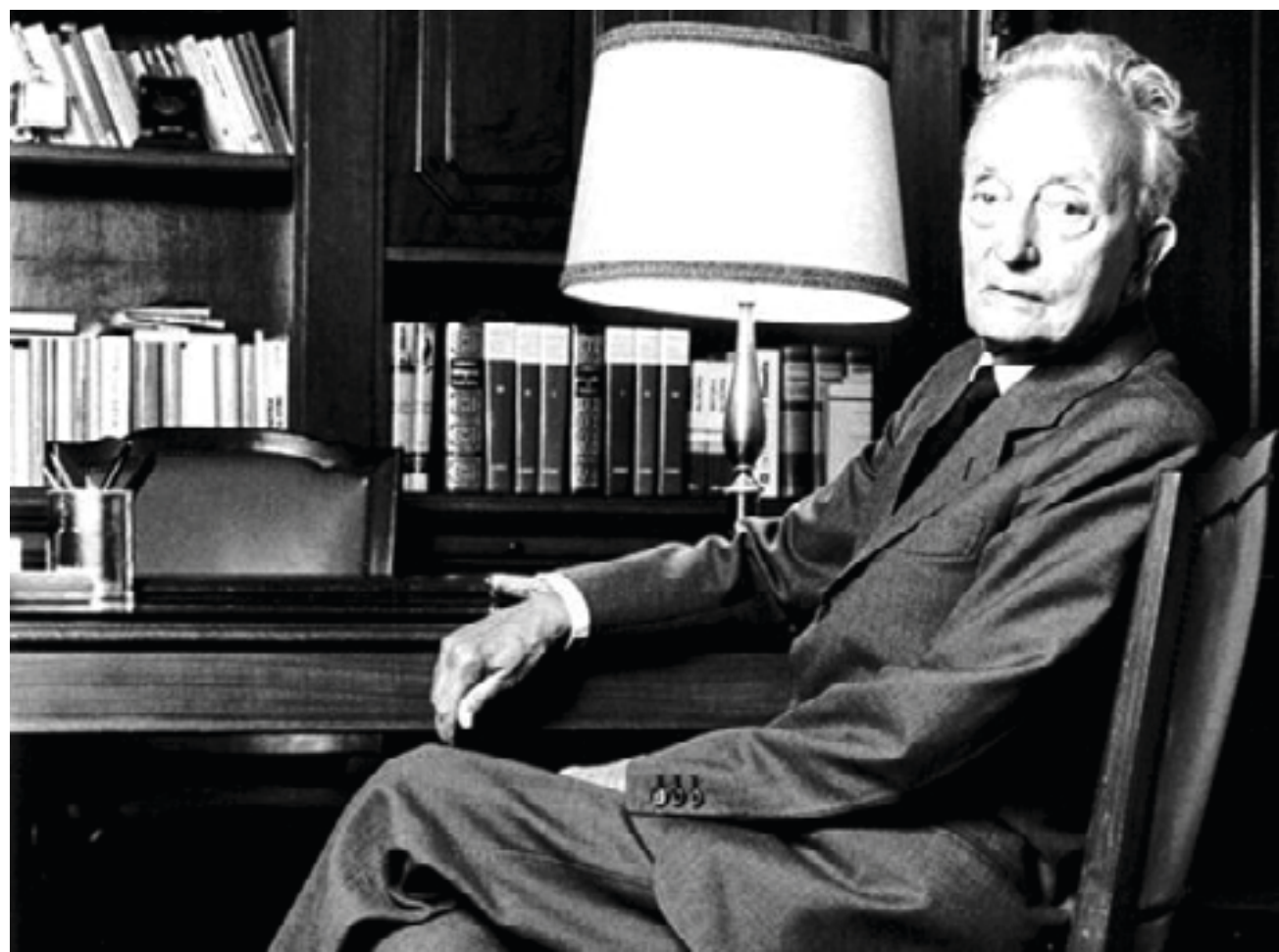
O filósofo Nicola Abbagnano, em seu Dicionário de Filosofia, tentou se aproximar do conceito inicial de Paideia entre os gregos