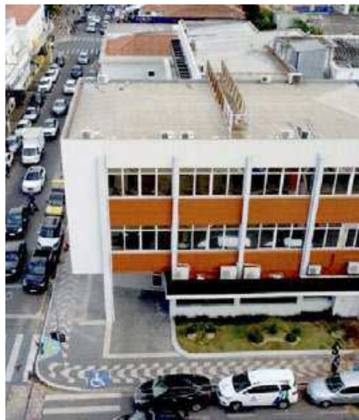
Prefeitura de Capivari, em Campos do Jordão, anunciou a abertura das inscrições para um novo concurso público

Para mais informações sobre o processo seletivo, os interessados devem fazer a leitura do edital com todas as informações. (GSP)