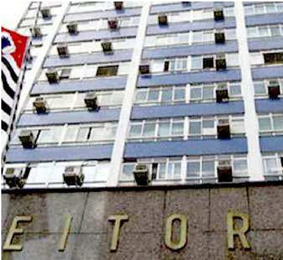
Ao todo, são 116 oportunidades e técnico judiciário, com 273 vagas a serem preenchidas

Todas as oportunidades serão distribuídas em Tribunais Regionais Eleitorais de