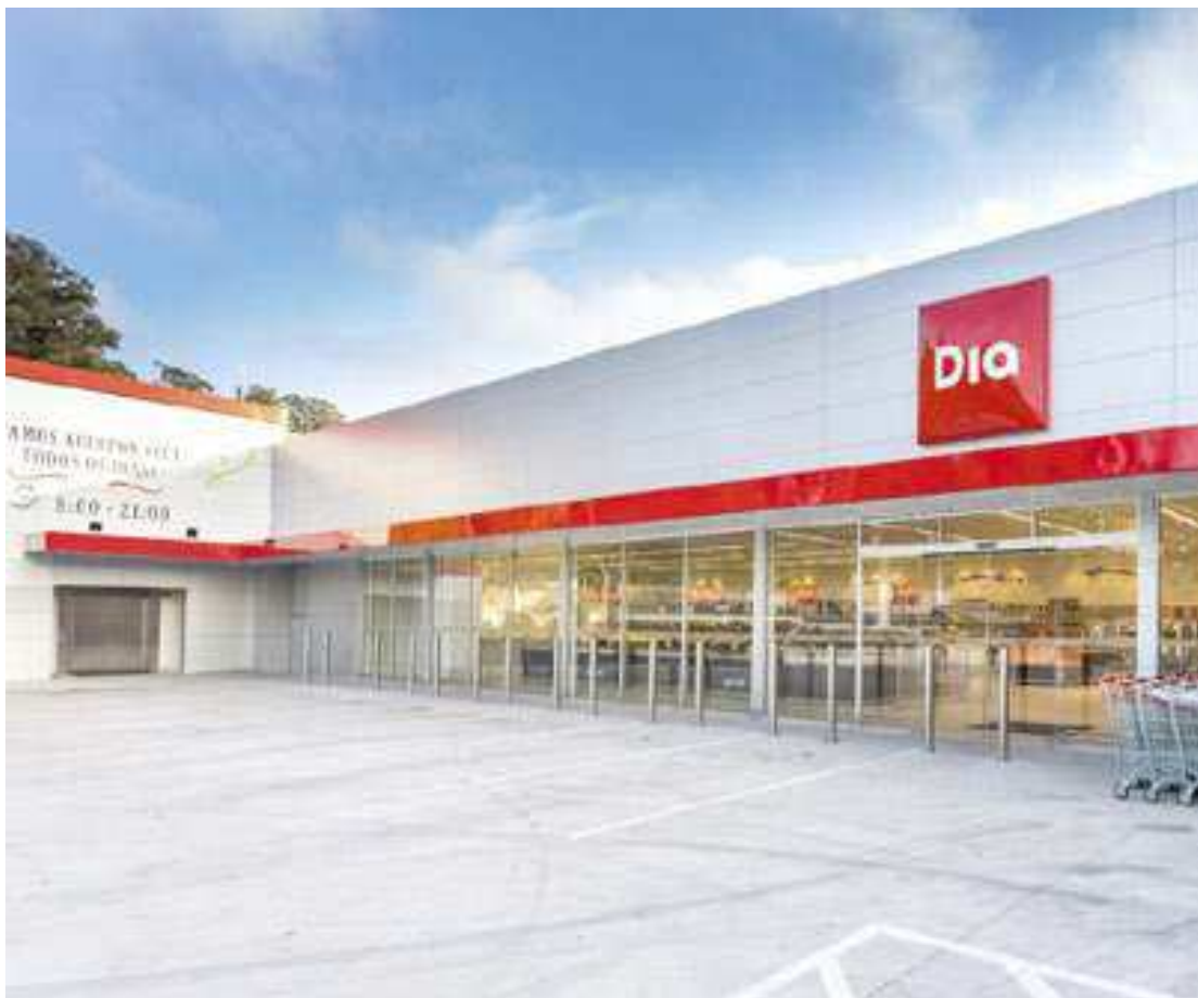
Segundo o Grupo Dia, os investimentos feitos no Brasil ‘não trouxeram o retorno esperado’

A conclusão da operação ainda depende da aprovação das entidades financeiras e do sindicato de bancos responsáveis pela autorização do negócio.