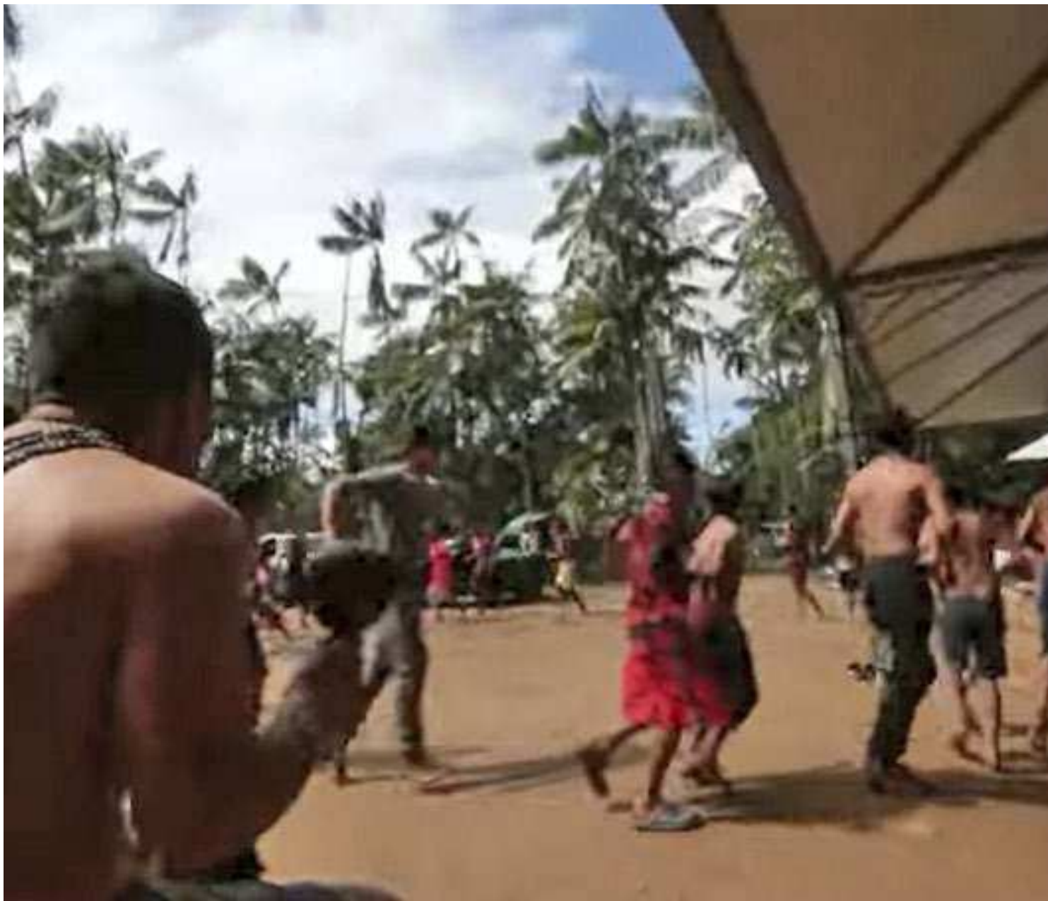
Cacique Adolfo Wera Mirim explica o dia Ano Novo Guarani; episódio do Diário de Um Repórter será exibido no próximo dia 11

Tem como parceiros a Direção-Geral do Livro, dos Arquivos e das Bibliotecas (DGLAB), a Rede de Bibliotecas Escolares (RBE) o Plano Nacional de Leitura (PNL), a Associação José Afonso, o