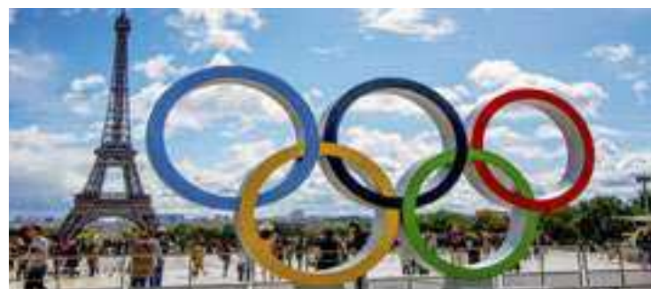
O Brasil competirá em 39 modalidades nos Jogos de Paris 2024

Com a ascensão de atletas brasileiras também aumenta a expectativa por conquista