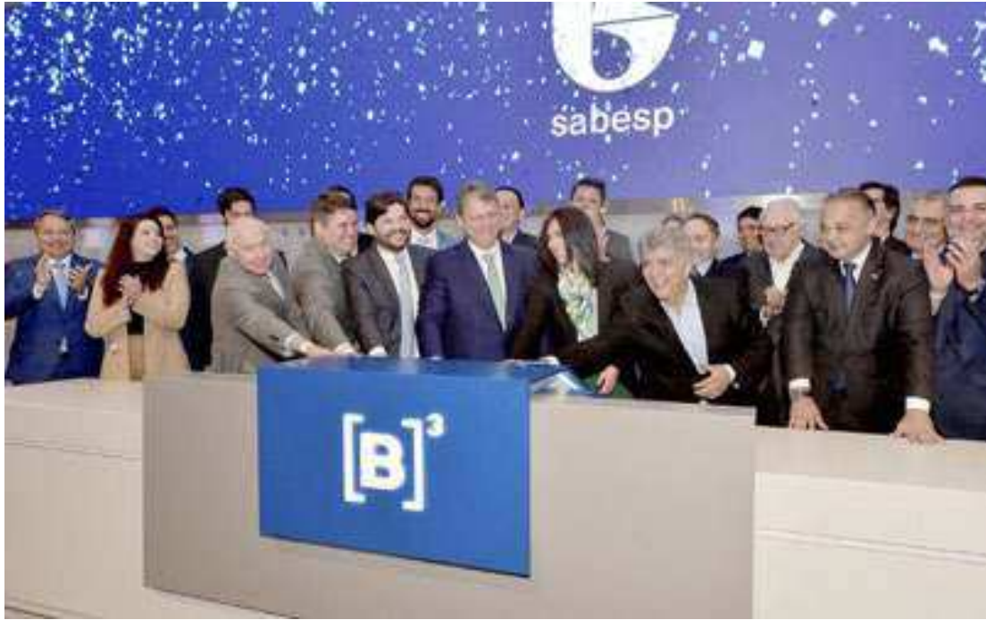
A venda de 32% da empresa resultou em R$ 14,8 bilhões aos cofres do governo paulista

O governador prometeu redução de até 10% nas tarifas social e vulnerável para famílias inscritas no Cadastro Único (CADÚnico) e para que tem renda familiar per capita entre R$ 218 e R$