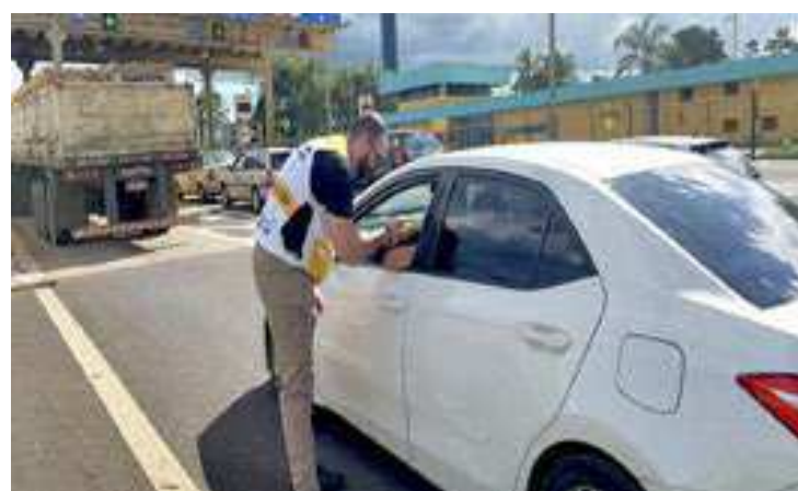
Segundo o Detran-SP, nos seis primeiros meses deste ano foram fiscalizados 201.298 veículos em estradas e vias públicas

“Antes, o policial precisava preencher na mão todos