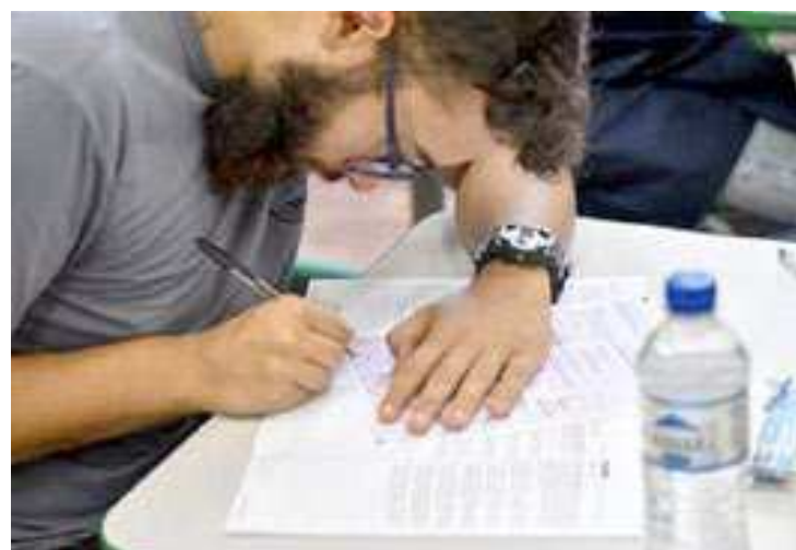
Em toda a rede estadual de SP, mais de 2,6 milhões de estudantes devem prestar as provas

A prova que dá acesso direto à Universidade de São Paulo (USP), Universidade Estadual Paulista (Unesp), Universidade Estadual de Campinas (Unicamp), Faculdades de Tecnologia do Estado de São Paulo (Fatecs) e Universidade Virtual do Estado de São