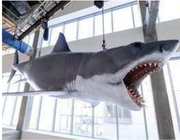
Boneco mecanizado de 7,6 metros de extensão usado em “Tubarão”

Algumas obras ganham espaço especial ali, como “Casablanca”, de Michael Curtiz, filme para o qual o seu estúdio, a Warner, não dava mui-