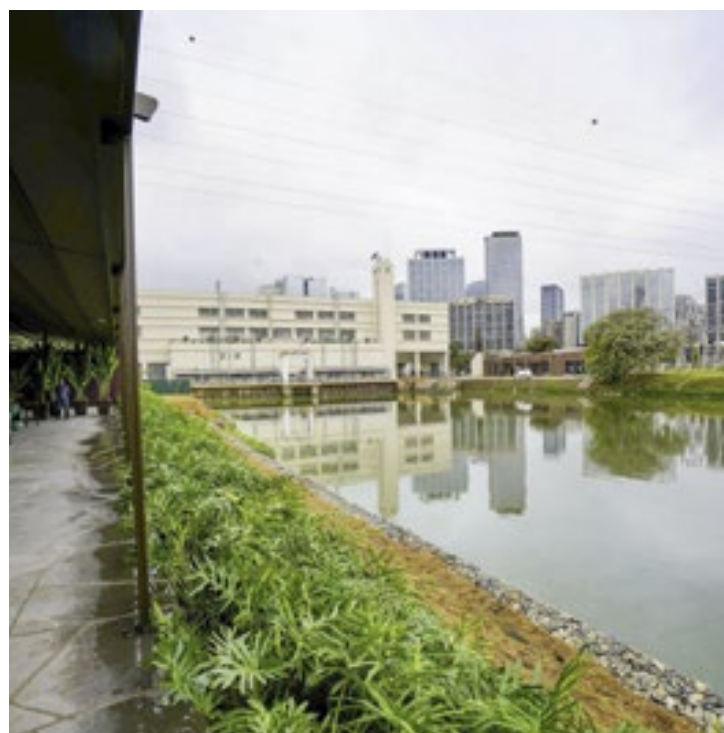
O entorno da Usina São Paulo, na Vila Olímpia, também conta com um novo projeto paisagístico e recuperação ambiental