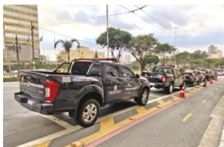
Os auditores fiscais da Secretaria da Fazenda e Planejamento de São Paulo atuaram, principalmente, na apreensão digital de documentos.

O objetivo da ação foi combater a sonegação fiscal e a prática de fraude fiscal estruturada. Foram cumpridos três mandados de busca e apreensão simultaneamente pelas autoridades envolvidas. Essa é a segunda operação para coibir e desarticular a prática conhecida como simulação de estabelecimento, em que empresas, apesar de estarem funcionando normalmente em São Paulo, declaram em seus cadastros fiscais estarem sediadas em outra localidade,