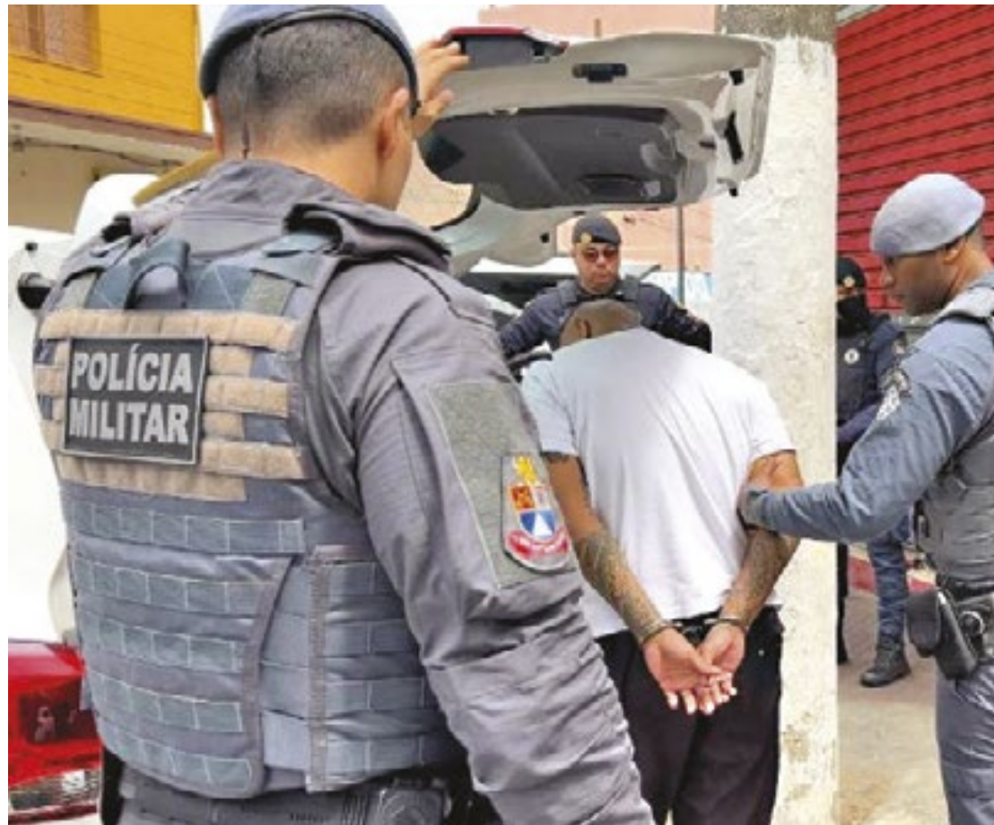
Homens foram recapturados após serem flagrados violando regras impostas pela Justiça para ter direito ao benefício

Um acordo de cooperação entre a Secretaria da Segurança Pública (SSP) e o Tribunal de Justiça de São Paulo (TJ-SP) permite que os policiais tenham acesso às informações dos presos beneficiados com a “saidinha”. Dessa forma, é possível verificar durante a abordagem se as regras para a saída temporária determinadas pela Justiça estão sendo cumpridas, sem a