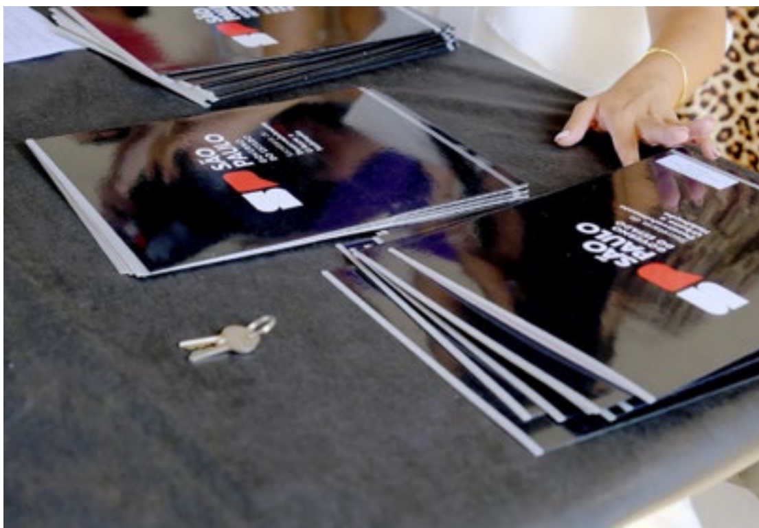
As 165 moradias regularizadas na RA de Santos totalizam um investimento de R$ 643,5 mil

Com os núcleos regularizados, os moradores podem obter o título de propriedade das suas moradias. A partir da