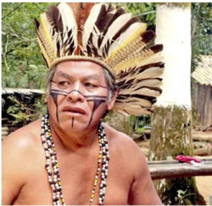
Segundo o cacique, se as queimadas continuarem, haverá falta de água, alimento e até medicamentos