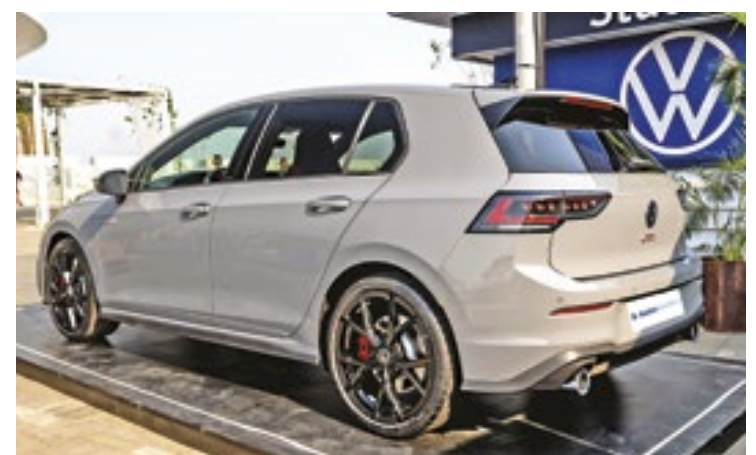
O GTI acelera de zero a 100 km/h em 5,9 segundos