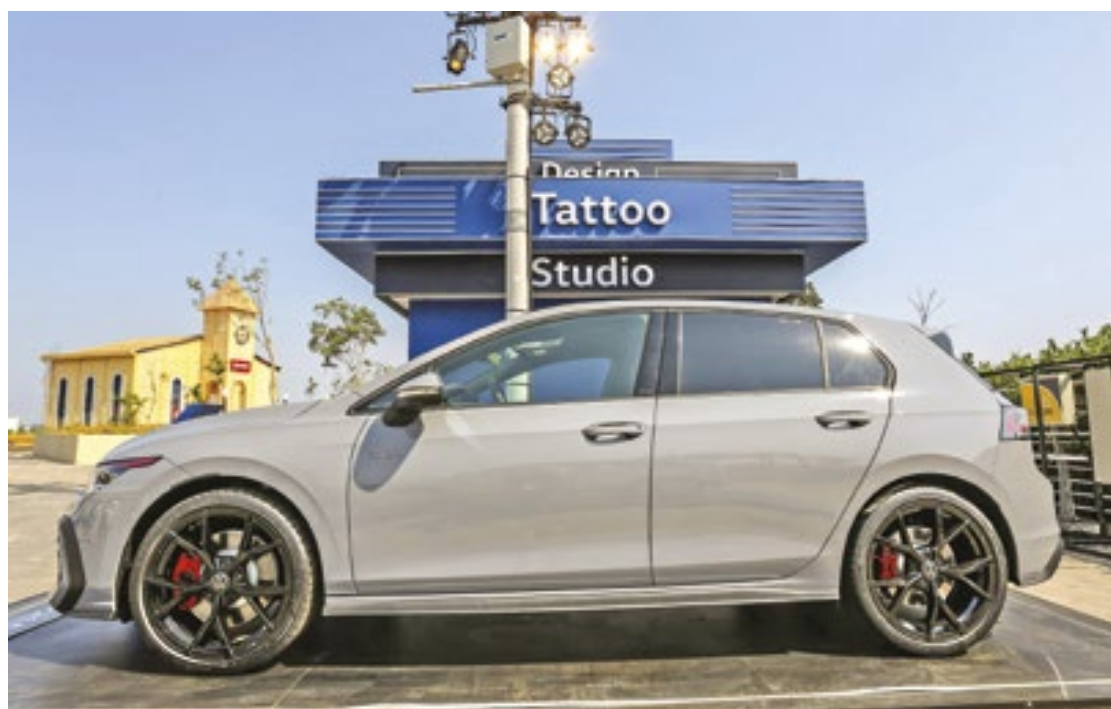
Mostrado no “Rock in Rio”, o exemplar do Golf GTI exposto no festival tem motor 2.0 turbo TSI de 265 cavalos

ção, controladas por superfícies sensíveis ao toque. O Cockpit Digital Pro se combina com o sistema de navegação Discover Pro, com duas telas, de 10 polegadas – de painel de instrumentos – e de 10,5 polegadas – da multimídia –, que podem ser interligadas. A central de multimídia se personaliza com as funcionalidades preferidas do motorista, como em um smartphone. O Golf GTI pode ter opcionalmente o Head-Up Display projetado no para-brisa, com informações como velocidade do carro, notificações dos sistemas de assistência ao condutor ou avisos de navegação, com projeção legível mesmo em contraluz. (Daniel Dias-AutoMotrix)