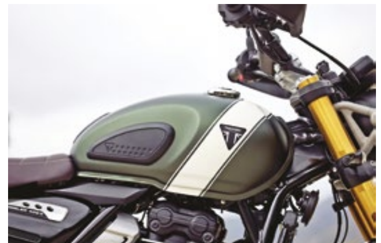
A moto conta ainda com tomada USB-C, iluminação full-led com luzes de rodagem diurnas (DRLs) e chave codificada