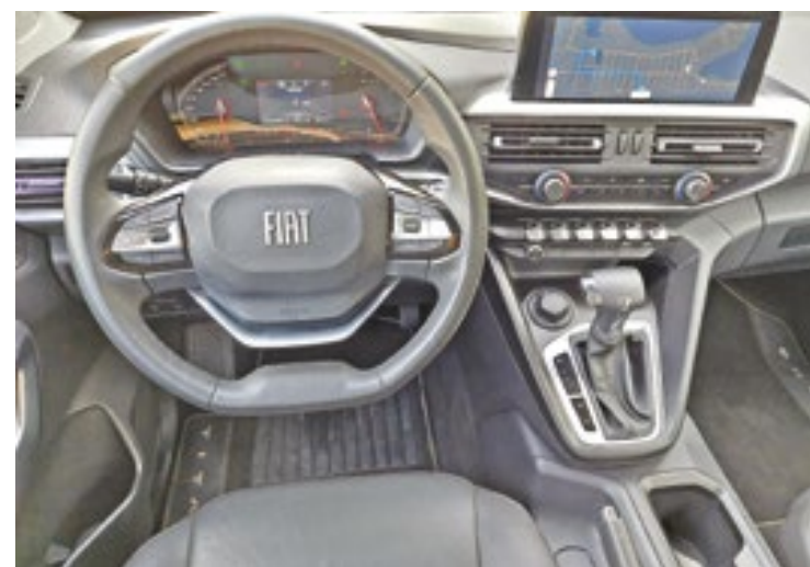
O painel de instrumentos tem tela digital colorida de 4,2 polegadas e a central multimídia tem tela de 10 polegadas