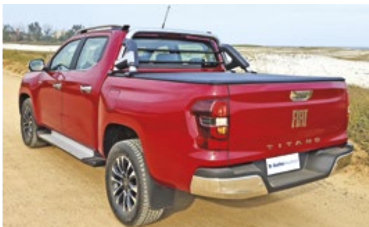
A Titano Ranch é equipada com o motor 2.2 turbodiesel de 180 cavalos de potência a 3.750 rotações por minuto e 40,8 kgfm de torque