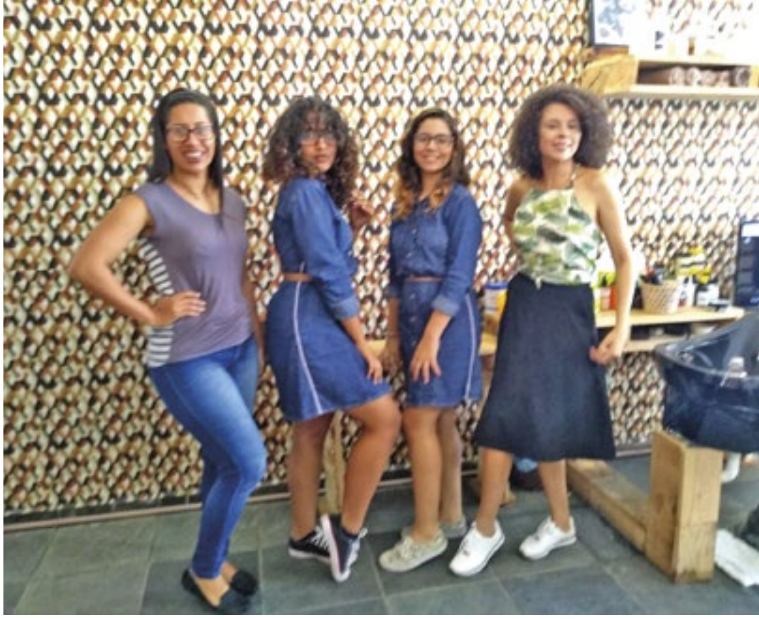
O salão “Confraria dos Cachos” já está em novo espaço com novidades, no bairro Vera Cruz, em Mongaguá