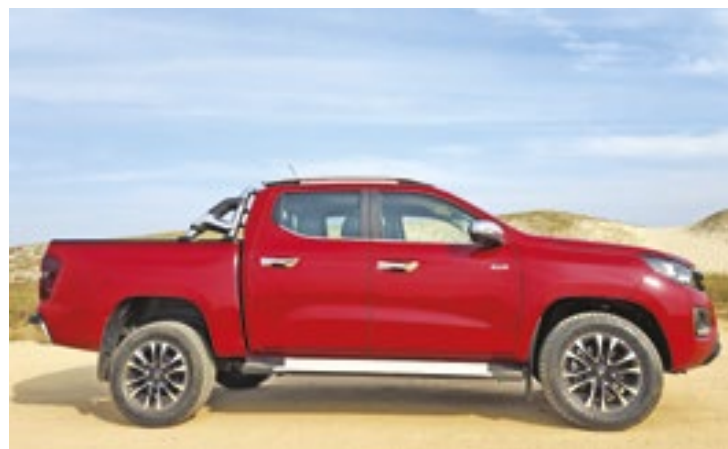
Contudo, apesar dos preços e da caçamba avantajada, a Titano ainda não vende tão bem quanto a Fiat esperava

nos segmentos de picapes menores, com a compacta Strada – o veículo mais vendido no mercado nacional há mais de três anos – e a intermediária Toro – primeira colocada de sua categoria – contaram a favor da decisão. Para adaptação às exigências do mercado brasileiro, a Titano recebeu novos coxins de cabine, suspensões, rodas, bancos e calibrações na suspensão.