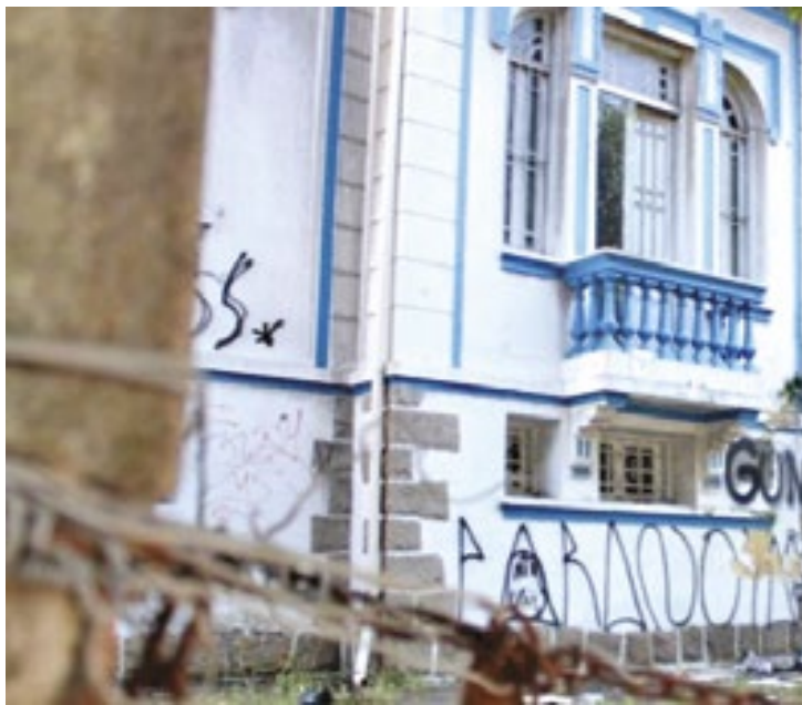
O Comitê espera que o imóvel sirva para preservar a história

Segundo o Comitê Popular, o imóvel que, após o fim da Ditadura e chegou a abrigar a 16ª Circunscrição Regional de Trânsito de Santos (16ª Ciretran) até 2015, serviu ao antigo Departamento de Ordem Política e Social (DOPS) de Santos – órgão da repressão que ficou marcado na história por monito-