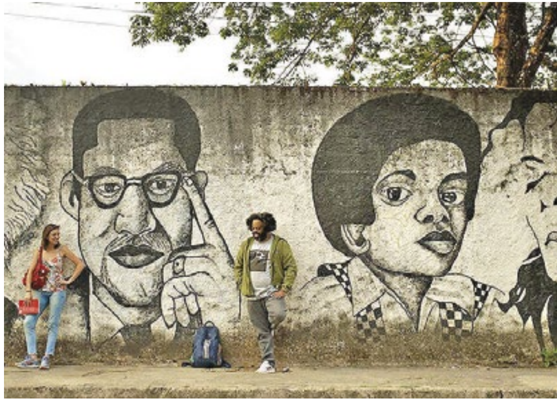
“O Dia que Te Conheci” é um filme da contemplação. Porque assim são seus personagens: observam o mundo, mas sabem que não podem interferir no andamento das coisas

Passamos do vazio ao pleno com essa desenvoltura que só os grandes minimalis-