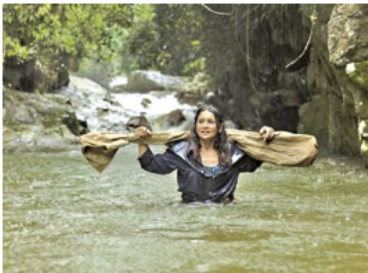
Atriz alça título de cineasta ao dirigir, produzir e atuar