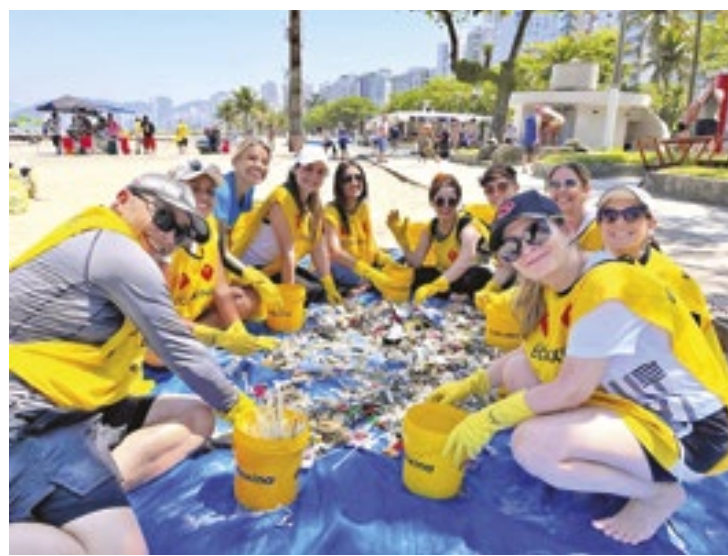
Bitucas de cigarro, eletrônicos e até geladeiras já foram recolhidos

“Nosso maior objetivo é a estruturação de uma área para a criação de uma coope-