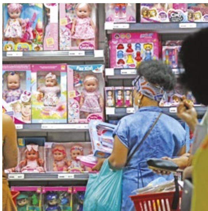
Os brinquedos estão no topo da lista de tipos de presentes, sendo a preferência de 82% dos consumidores

Em relação aos tipos de presentes, a preferência é clara: os brinquedos estão no topo da lista, sendo a preferência de 82% dos consumidores. Roupas também aparecem com destaque (65%), seguidas de calçados (61%). Foram mencionados, ainda, artigos eletrônicos, como celulares, tablets e videogames (42%), artigos de informática (39%) e artigos esportivos (22%). Livros e per-