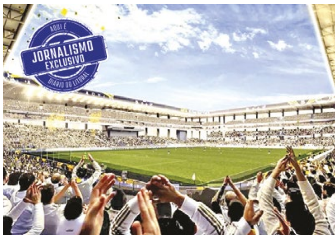
A expectativa é que o novo estádio da Vila Belmiro tenha capacidade para 30 mil espectadores