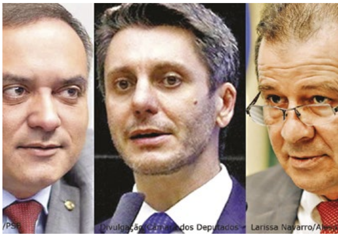
Três candidatos estão tecnicamente empatados na cidade do ABC paulista