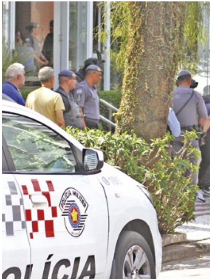
Criminosos invadiram o condomínio e fizeram seis pessoas reféns

Eles teriam invadido o prédio em um veículo clonado e teriam tido a entrada facilitada por um fun-