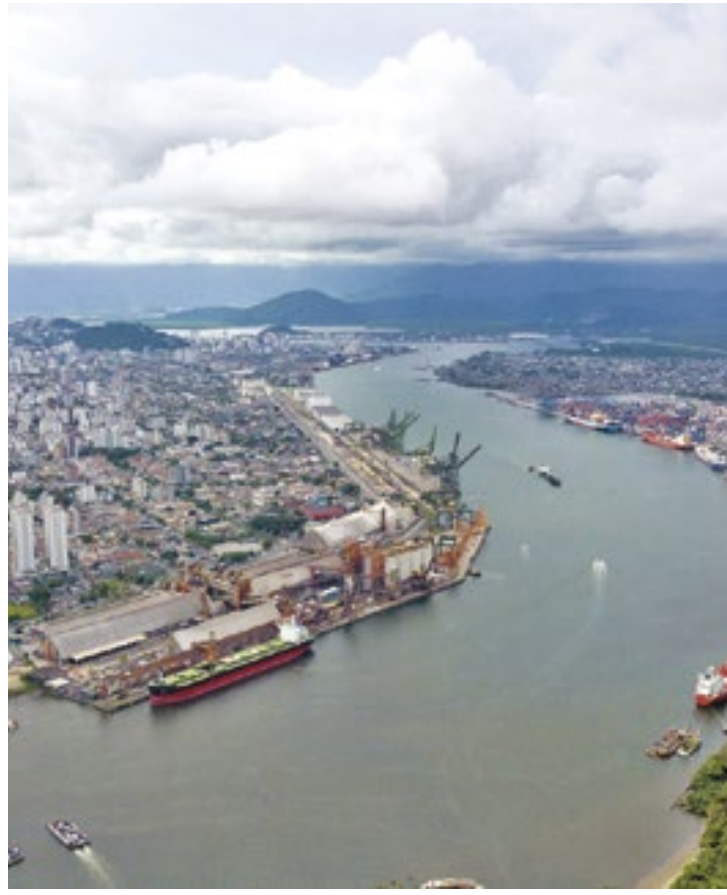
A migração das importações para o Portal Único começou nesta terça-feira (19) e vai até o fim de 2025

Embora exista há seis anos, a Duimp era aplicada em fase de testes, até agora. Para a secretária do Mdic, a migração total das importações do Siscomex para o Portal Único de Comércio Exterior gerará uma redução adicional de tempo, de nove para cinco dias no prazo médio da compra de bens do exterior. O novo sistema be-