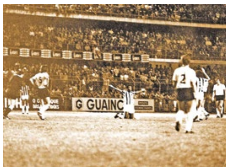
A famosa foto do Rei Pelé ajoelhado e se despedindo do Estádio Urbano Caldeira, a Vila Belmiro

O placar, este que menos importava pela grandiosidade de Edson, terminou em dois a zero para a equipe mandante. Os gols foram marcados pelo também atacante Cláudio Adão e Geraldo, lateral ponteiro, contra.