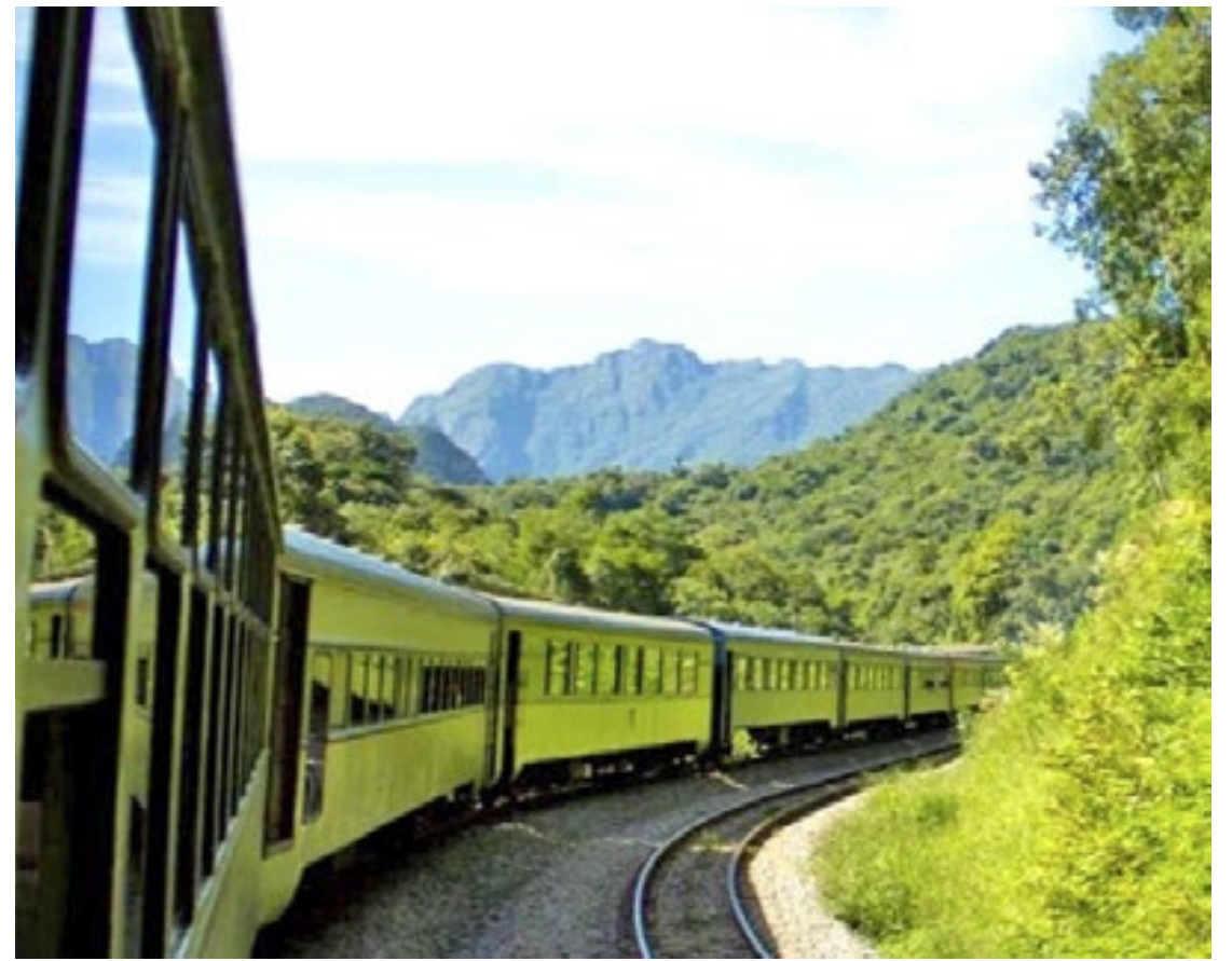
Conhecido também como o passeio de Trem Serra do Mar, é operado pela Serra Verde Express

Esse passeio de trem, considerado um dos melhores do mundo, permite não só explorar a riqueza natural do Brasil, mas também viajar pela história, apreciando a engenharia e a beleza da ferrovia centenária que atravessa a paisagem deslumbrante da Serra do Mar.