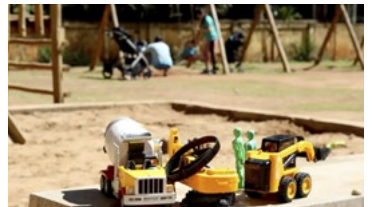
Certas crianças vivem em situação de pobreza ou monoparentais

Isso ficou ainda mais claro em 2022, após a decisão do Supremo Tribunal Federal (STF) de ampliar a obrigatoriedade da oferta de ensino também para creches. Até então, os municípios podiam negar a matrícula alegando