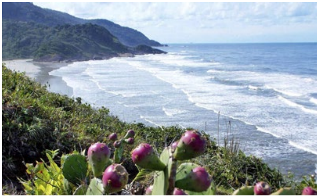
A vila de Barra do Una vem sofrendo com o avanço do mar e mudanças no curso do rio

Saindo do Perequê, a estrada passa pela pequena vila do Barro Branco e logo em seguida corta os morros do Tocaia, palco de lutas por terras em outras épocas. O morro do Una abrigava engenhos de cana-de-açúcar, muitos escravizados e alguns casarões. Saindo das subidas e descidas do Tocaia, a vista magnífica da Praia do Caramborê, nos