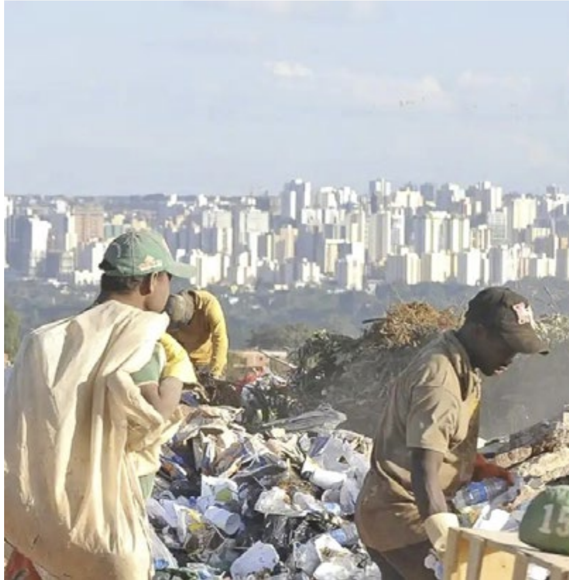
Melhorar a gestão desse material é um dos desafios para os 5.569 prefeitos que assumirão em 2025

De acordo com o Sistema Nacional de Informações sobre Saneamento - Resíduos Sólidos (SNIS-RS 2022), do Ministério das Cidades, dos 5.060 municípios pesquisados, 2.585 municípios informaram já terem elaborado o Plano Municipal de Gestão Integrada de Resíduos Sólidos (PMGIRS). O documento é a primeira etapa no planejamento para a adequação dos aterros sanitários, mas também apresenta um diag-