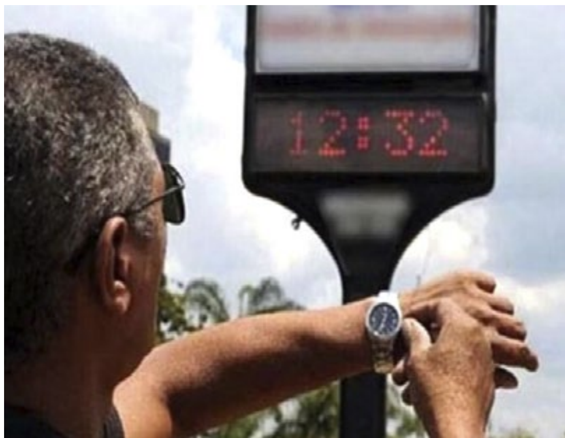
O horário de verão costumava iniciar em outubro ou novembro e se estender até fevereiro

Caso seja retomada, a medida pode voltar a seguir esse calendário, com o objetivo de ajudar no equilíbrio do consumo de eletricidade no país.