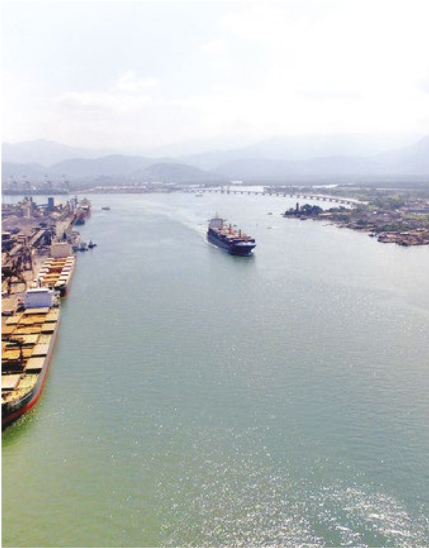
Fundo fechou 2023 com um patrimônio líquido de R$ 660,9 milhões. Só em juros e encargos, faturou R$ 56,8 milhões

A Marinha do Brasil informou ontem que "a Lei Orçamentária Anual do ano de 2023