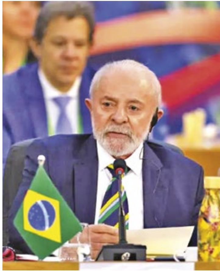
Internamente, iniciativa é considerada o principal legado do mandato brasileiro ao fórum, que é sediado neste ano no RJ

Um dos pilares da proposta se apoia em uma espécie de repositório de políticas de assistência social consideradas exitosas, ao qual países interessados poderão recorrer