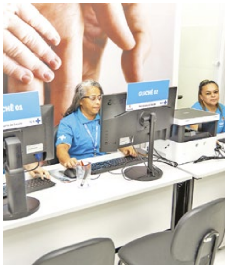
Nova sede da Unidade Básica de Saúde do bairro do Pernambuco está na Rua dos Bambus, 69 e com atendimento ampliado