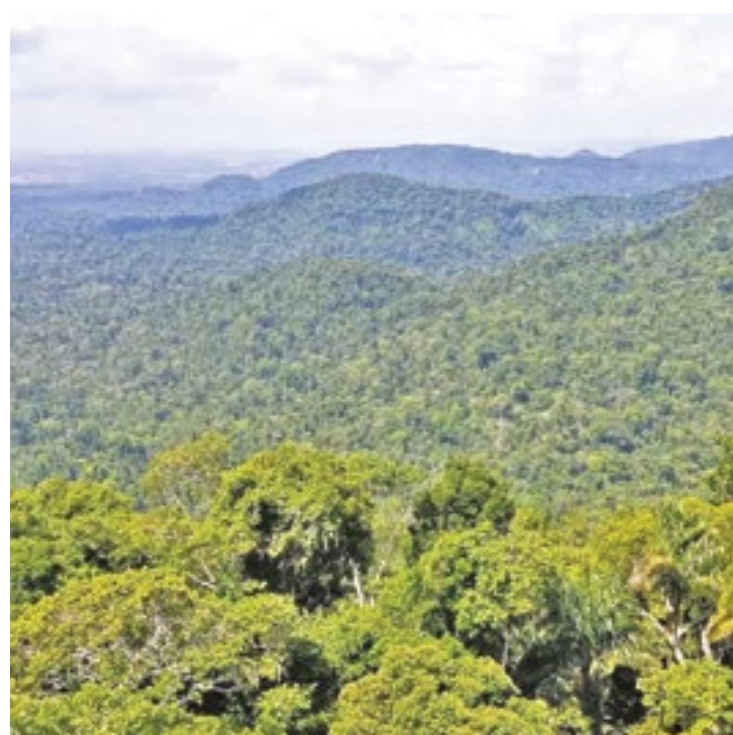
Fundo é gerido pelo BNDES, sob coordenação do Ministério do Meio Ambiente e Mudança do Clima (MMA)

Para o presidente do BNDES, Aloizio Mercadante, é mais uma demonstração importante da confiança do mundo e, em especial, da Noruega, ao compromisso do governo do presidente Luiz Inácio Lula