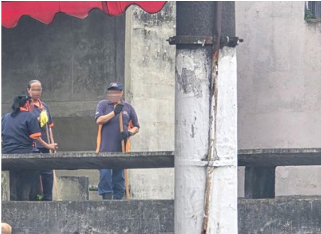
Técnicos também responsabilizam lei do Condepasa pelo estado do prédio

Vale lembrar que em uma carta endereçada à Prefeitura e Câmara de Santos, o Núcleo DCOMOMO São Paulo alertou a possibilidade da Câmara responder por crime federal, conforme preconiza o inciso 4º do artigo 216 da Constituição. O prédio está sob responsabilidade da Câmara desde 2019, que não se manifesta oficialmente sobre a questão.