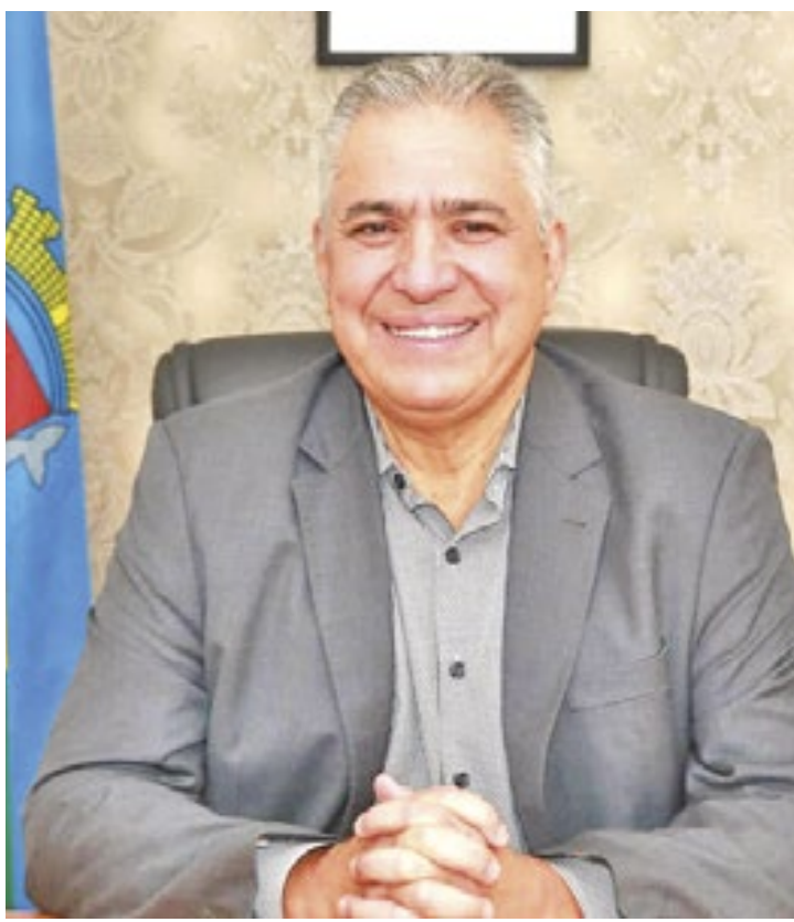
Prefeito afirmou que, nos últimos 8 anos, foram cerca de 400 intervenções, incluindo ruas, avenidas e canais

Todas as obras executadas podem ser acompanhadas em tempo real pela internet. (Ana Clara Durazzo)