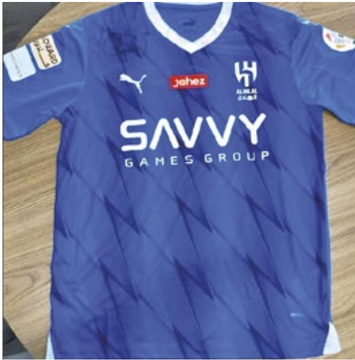
O valor dos itens varia de R$ 3 mil a R$ 150 mil, sendo o press kit da Boca Rosa o mais barato e o BYD o item mais caro

na Ferraz na casa do comprador da experiência;