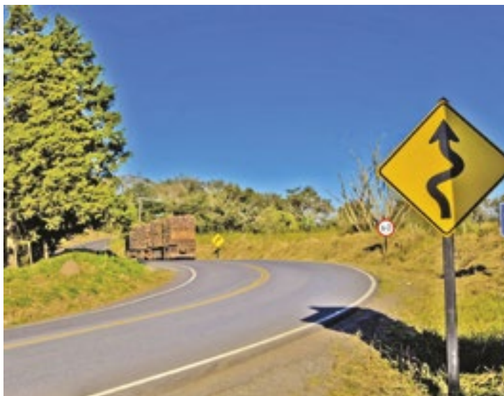
As reuniões serão abertas para pessoas físicas ou jurídicas interessadas no projeto, que promete um investimento de R$ 2,5 bilhões

privada (PPP), o projeto prevê ampliação, operação e manutenção do trecho rodoviário que liga Itapetininga a Ouri-