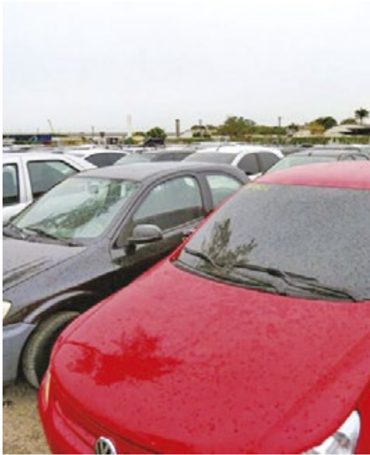
O leilão, divulgado no Diário Oficial do Estado, faz parte de uma série de nove pregões programados pelo Detran-SP para o mês de dezembro

Os pré-lances poderão ser registrados a partir de quarta-feira (10/12). Essa modalidade permite que o participante