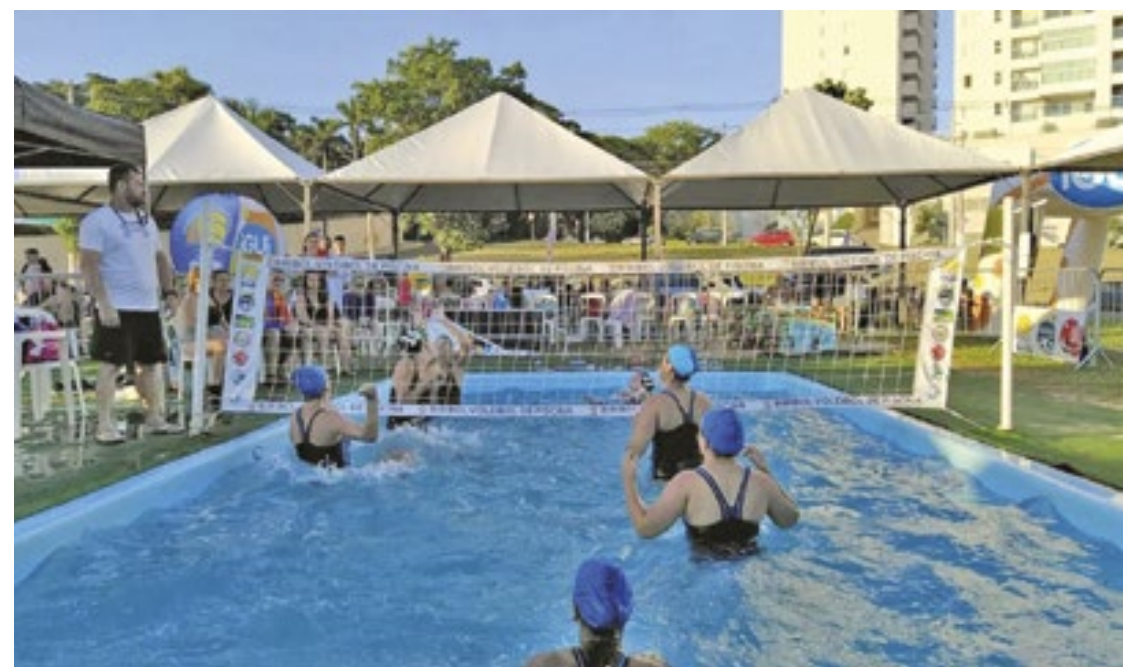
CONFEDERAÇÃO NACIONAL DE BIRIBOL