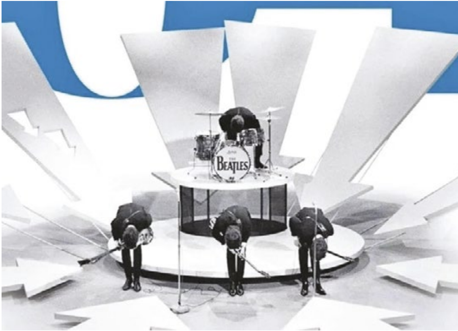
Em duas semanas, os Beatles desembarcaram em Nova York e detonaram a Beatlemania no país inteiro, com duas aparições na TV

O diretor de "Vinyl", Tedeschi, foi chamado para mais uma parceria com Scorsese em "Beatles 64". Os dois fizeram entrevistas recentes com muitas pessoas