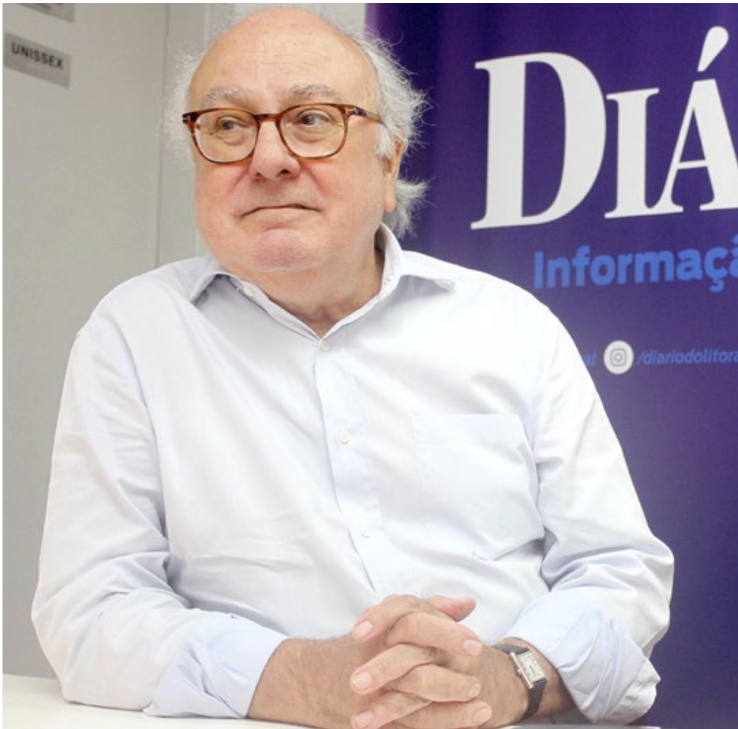
Caio: “Os terminais precisam trabalhar com agendamento e a Autoridade Portuária de Santos precisa fiscalizar esse procedimento e multar”

“A questão é muito mais complexa. Os terminais precisam trabalhar com agendamento e a Autoridade Portuária de Santos (APS) precisa fiscalizar esse procedimento