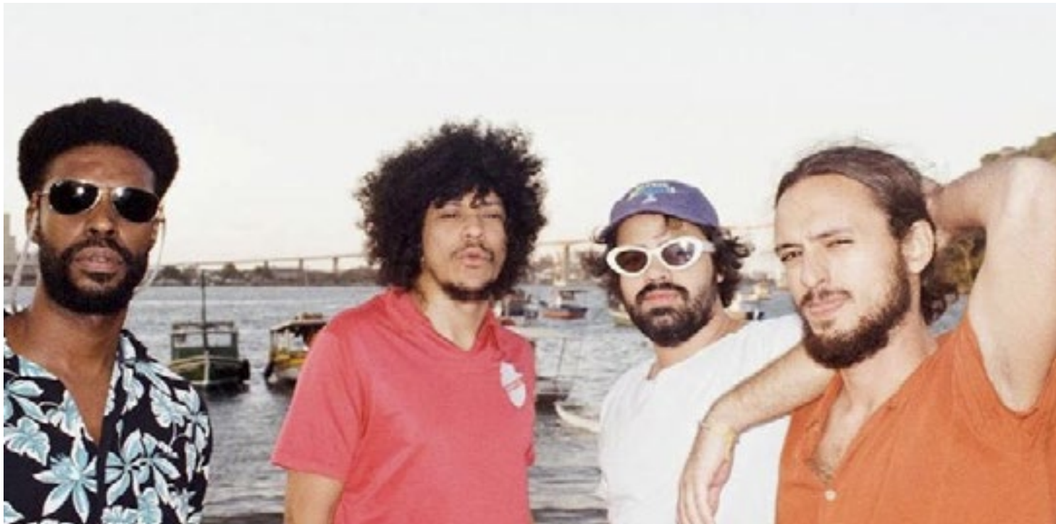
Boogarins fez um show de lançamento em 6 de dezembro no Cine Joia, em São Paulo: de volta a uma filosofia mais "caseira"