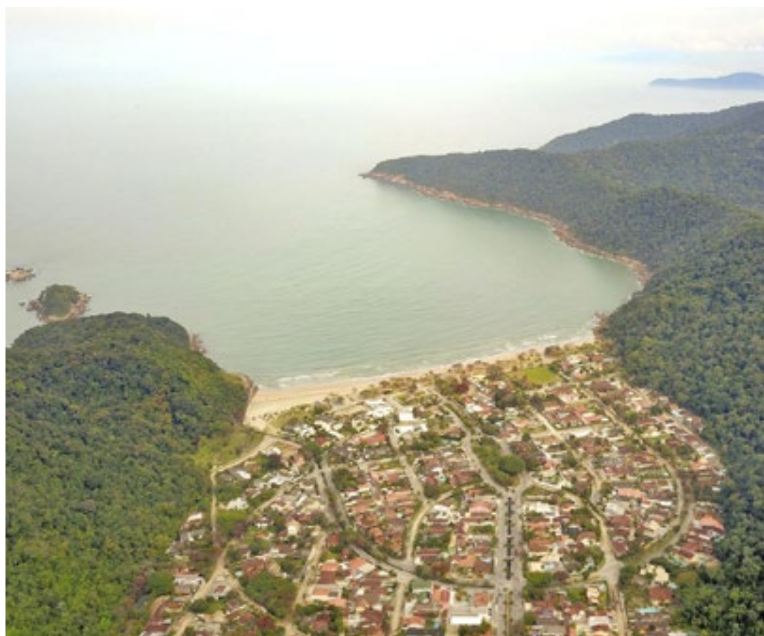
A praia de Guaiúba faz parte da Área de Proteção Ambiental (APA) Cabeça do Dragão, no Guarujá

“Trata-se de uma ferramenta de gestão e proteção