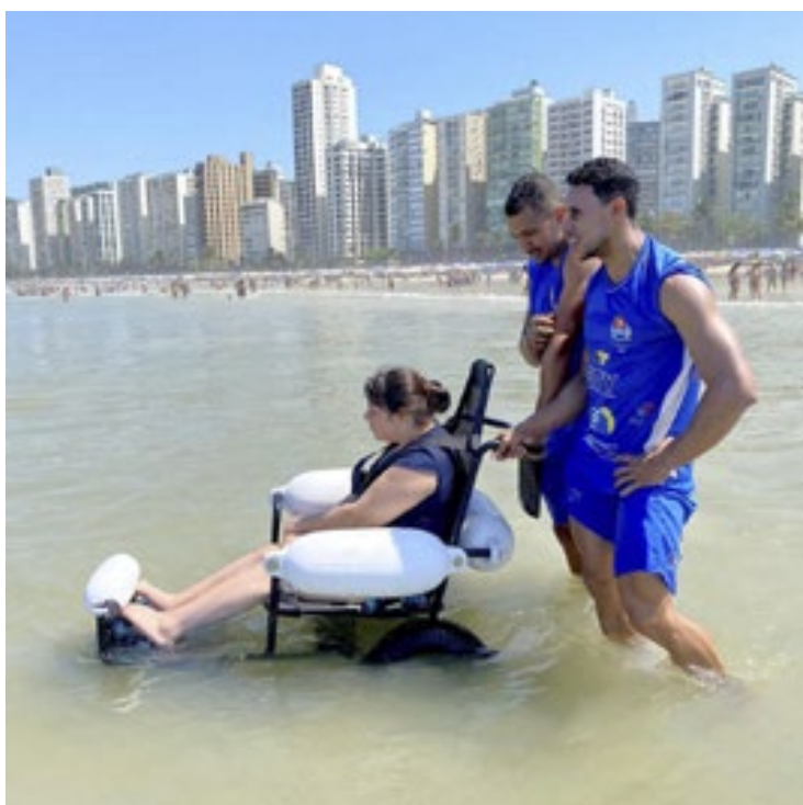
O programa acontece das 10 às 14 horas, entre sexta-feira e domingo do mês, até 29 de dezembro, na Pitangueiras

O acesso ao mar é garantido por meio das cadeiras anfíbias, que podem ser utilizadas gratuitamente. O equipamento é fabricado com um pneu especial, que passa com facilidade pela areia, não afunda dentro da água e possui uma altura compatível com a possibilidade de o usuário sentir a água.