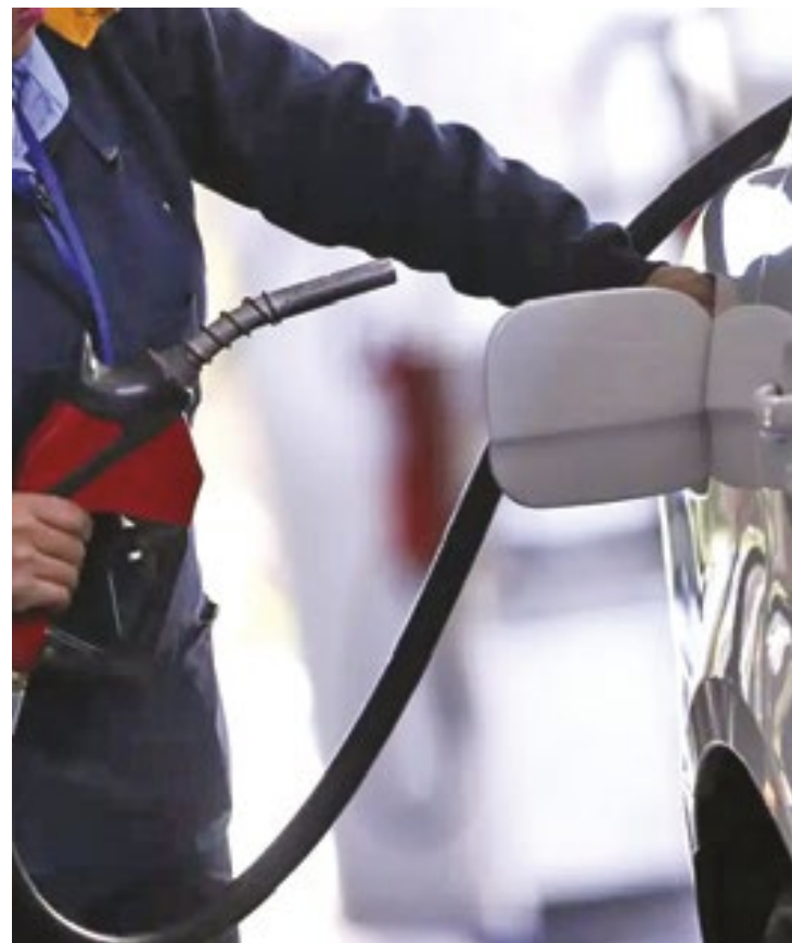
Alta do dólar voltou a pressionar os preços dos combustíveis, elevando a defasagem em relação às cotações internacionais

Apesar de passar grandes períodos com elevada defasagem durante o ano, a Petrobras não promoveu nenhum reajuste no preço do diesel em 2024 - o último foi no fim de 2023, antes da retomada da cobrança integral de impostos sobre o combustível. No caso da gasolina, o preço médio nas refinarias brasileiras está R$ 0,16 por litro abaixo da paridade medida pela Abicom. Nas refinarias da Petrobras, o valor é R$ 0,17 por litro. Esse combustível tende a ter menor consumo no Hemisfério Norte durante o inverno. (FP)