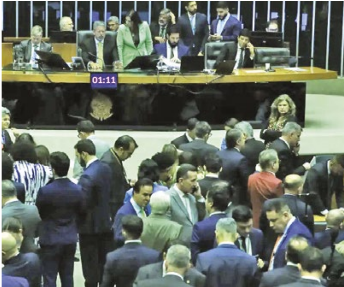
Texto desidratou e governo sofreu revés em relação a extinguir brechas que permitem supersalários

Para evitar a derrota da PEC, o governo concordou com que o relator do texto na Câmara, Moses Rodrigues (União Brasil-CE) enfraquecesse as verbas que podem ficar fora do teto de supersalários de R$ 44 mil. O texto original previa que uma lei complementar tratasse as verbas autorizadas a ficar fora do teto. Agora, o tema será regulamentado por meio de uma lei ordinária, que exige maioria simples. (AB)