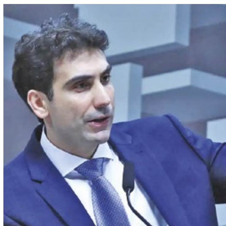
Gabriel Galípolo foi indicado para a presidência do BC pelo presidente Lula e toma posse em janeiro do ano que vem

A Procuradoria Nacional da União de Defesa da De-