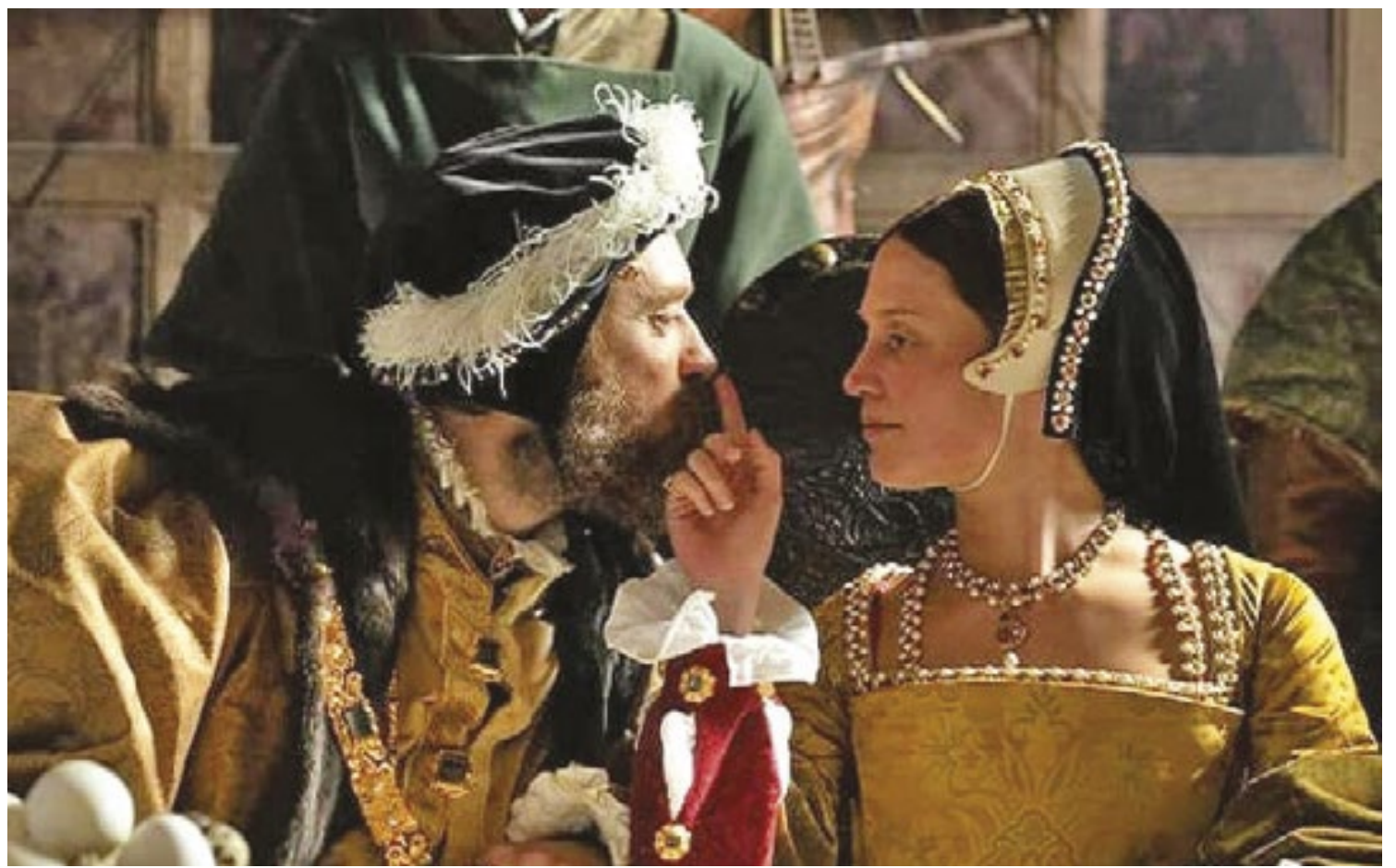
A estreia do cearense Karim Aïnouz numa produção internacional falada em inglês, chega aos espectadores brasileiros

Parr é interpretada pela ganhadora do Oscar Alicia Vikander, que divide a tela com Jude Law. Eles formam o estranho casal da realeza britânica cuja interação se configura entre a opressão e brutalidade dele e os medos e impetuosidades dela. Tudo