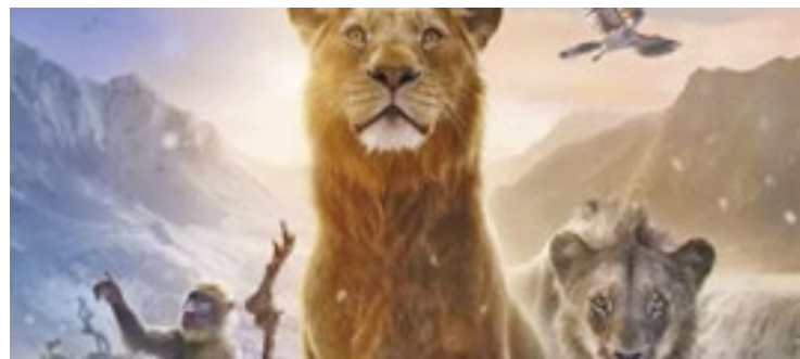
Filme estreou na última quinta-feira (19) nos cinemas do país

A Disney aprendeu a importância das cores nos cinco anos que separam o live-action "O Rei Leão" de sua continuação, o novo "Mufasa". A sequência repete o visual hiper-realista do primeiro capítulo, é verdade, mas avança com uma estética mais extravagante que a sobriedade anterior.