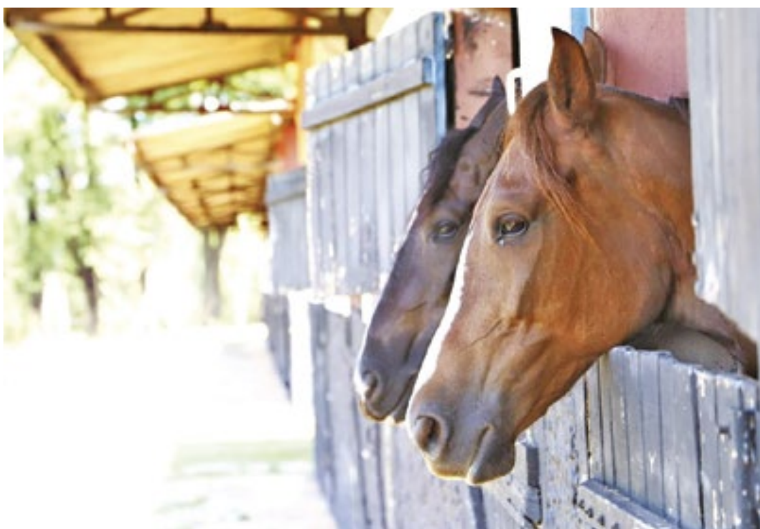
Com 'Passaporte Equestre Paulista', criador ganha mais facilidade no transporte de cavalos

Além disso, o próprio GEDAVE foi otimizado. A partir de agora, o sistema permite que o criador possa solicitar a GTA para fora do estado. Antes, isso só era possível por meio de autorização de uma unidade de defesa agro-