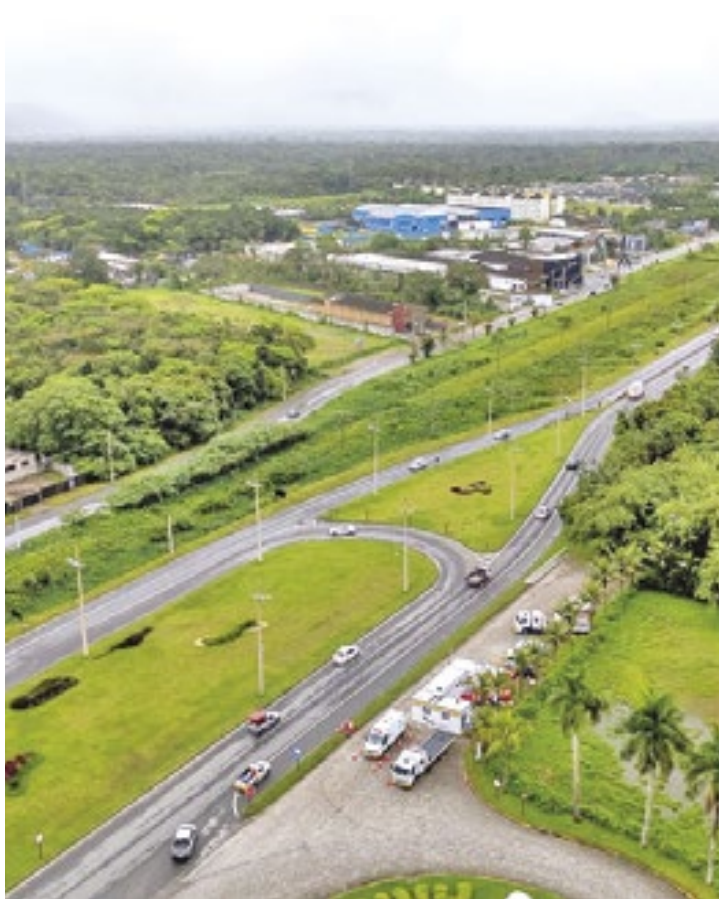
Na Rodovia dos Tamoios (SP-099), que ligar ao Litoral Norte, a previsão é que cerca de 139 mil veículos circulem entre os dias 22 e 27

Aproximadamente 947 mil veículos circularão no Sistema Anhanguera-Bandeirantes durante os feriados do fim de ano. Para o Natal, os horários de maior movimento serão na segunda-feira (23), das 16h às 20h, na terça-feira (24), das 9h às 14h, na quarta-feira (25), das 16h às 21h e na quinta-feira (26) das 7h às 11h. No dia 25 de dezembro entrará em