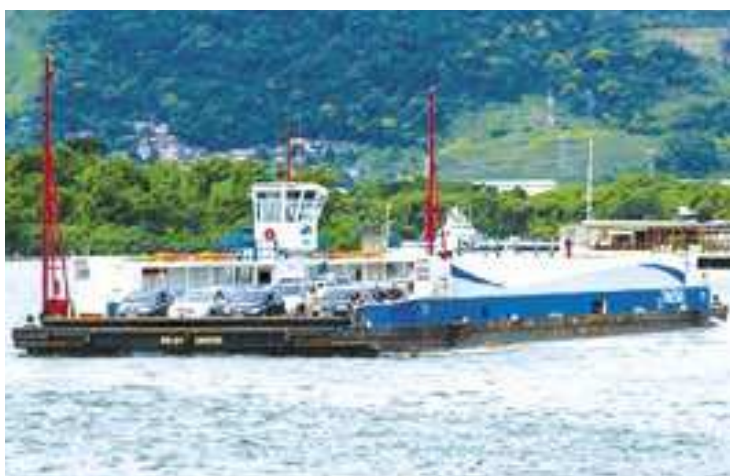
Segundo prefeita, o excesso de caminhões congestionam o serviços de balsas que transportam os veículos entre Ilhabela e o continente

A proibição vai se restringir aos fins de semana e feriados,