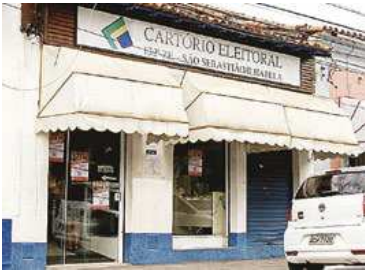
Cartório Eleitoral fica na rua Antônio Cândido, 120, no Centro

Para o atendimento, os eleitores devem estar mun-