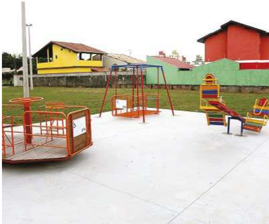
Praça do Idoso conta com playground, bicicletário, mesa de jogos e aparelhos de ginástica

A instalação de Eco pontos faz parte do Plano de Resíduos Sólidos desenvolvido pela Prefeitura de Caraguatuba, por meio da Secretaria de Meio Ambiente. A cidade já conta com outros dois Eco pontos: Martim de Sá e Balneário Golfinhos. (GSP)