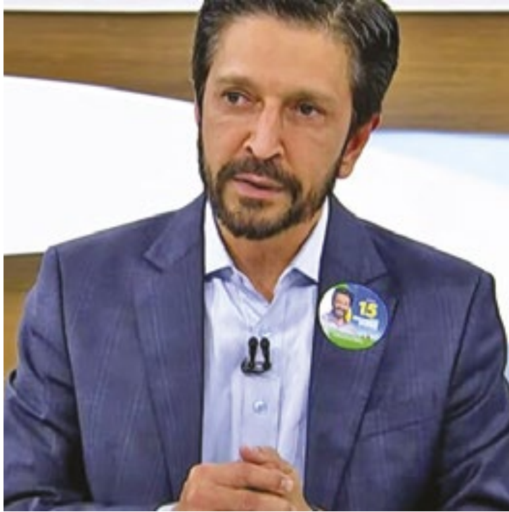
O Prefeito Ricardo Nunes também classificou como "gangue" parte da cúpula que apoia o Pablo Marçal