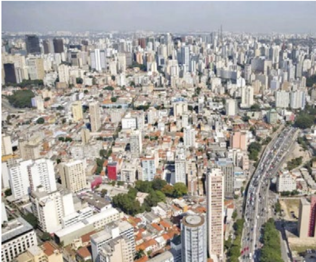
Estado de São Paulo foi apontado com o maior índice de liberdade econômica no Brasil

O Brasil, de maneira geral, subiu para 4,38 ante 4,06 do relatório passado. (Crisley Santana)