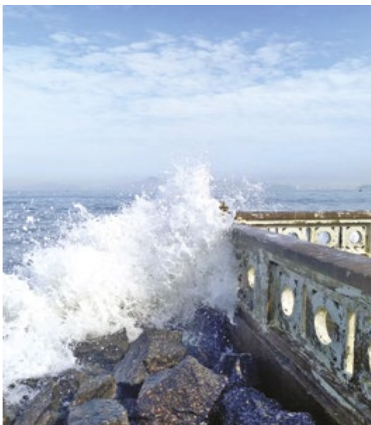
O boletim Saric será emitido toda vez que uma praia entra em estado de atenção ou alerta

O Saric também gera mapas que permitem a visibilidade de cada praia da costa e seus riscos. Eles permitem prever inundações e erosões