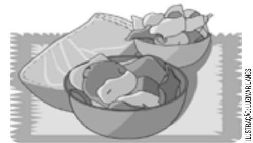
ILUSTRAÇÃO: LUIZMAR LAINES

Modo de preparo: em uma MANDOLINA, corte o aipim no sentido LONGITUDINAL; e a cenoura, as batatas e a beterraba, no HORIZONTAL. Empane somente as RODELAS de beterraba e cenoura na farinha de arroz. Em uma PANELA grande, aqueça o óleo de girassol e frite as RAÍZES, deixando a beterraba e a cenoura por último. Tempere com sal e orégano a gosto. Escorra-as no PAPEL toalha e sirva em seguida como ENTRADA ou até LANCHE.