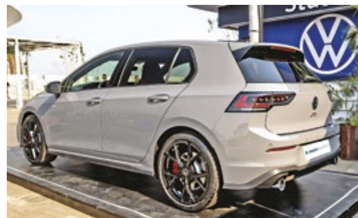
O GTI acelera de zero a 100 km/h em 5,9 segundos