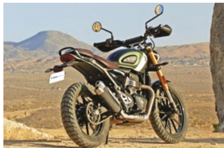
A Scrambler 400 X ostenta um aspecto mais aventureiro, com uma pegada leve para as trilhas