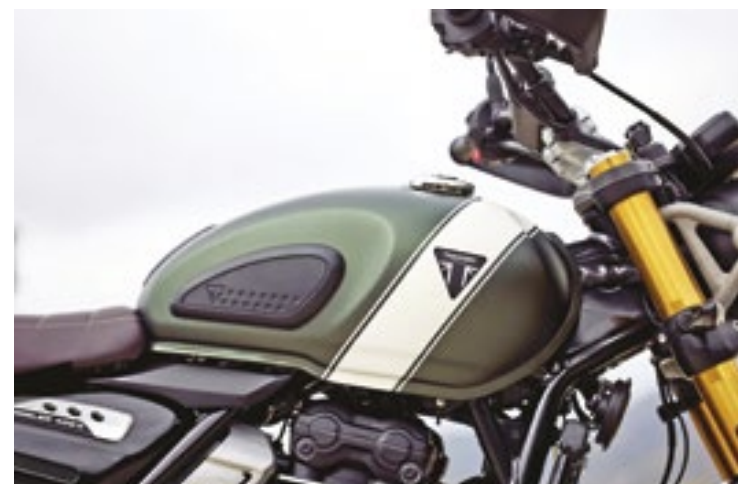
A moto conta ainda com tomada USB-C, iluminação full-led com luzes de rodagem diurnas (DRLs) e chave codificada