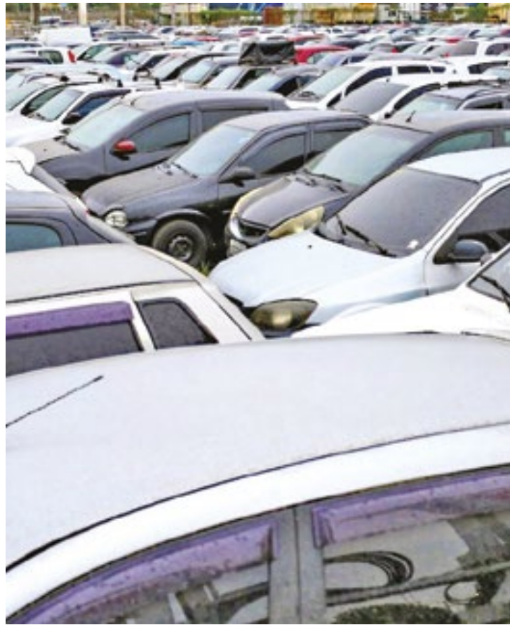
A avaliação estimada para cada veículo é calculada com base nos valores praticados pelo mercado e no estado de conservação

Os pré-lances podem ser feitos desde 11 de setembro.