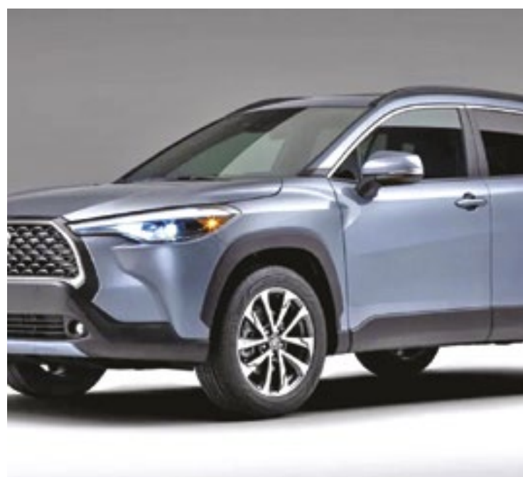
O evento acontece virtualmente, por meio do Sistema de Leilão Eletrônico, com a possibilidade de pessoas físicas e jurídicas participarem

Veja alguns dos lotes mais interessantes do leilão, que põe a venda celulares, eletrônicos,