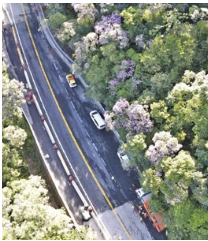
No total, três dispositivos serão instalados nos quilômetros 78,1, 84,4 e 88,5 da Mogi-Bertioga