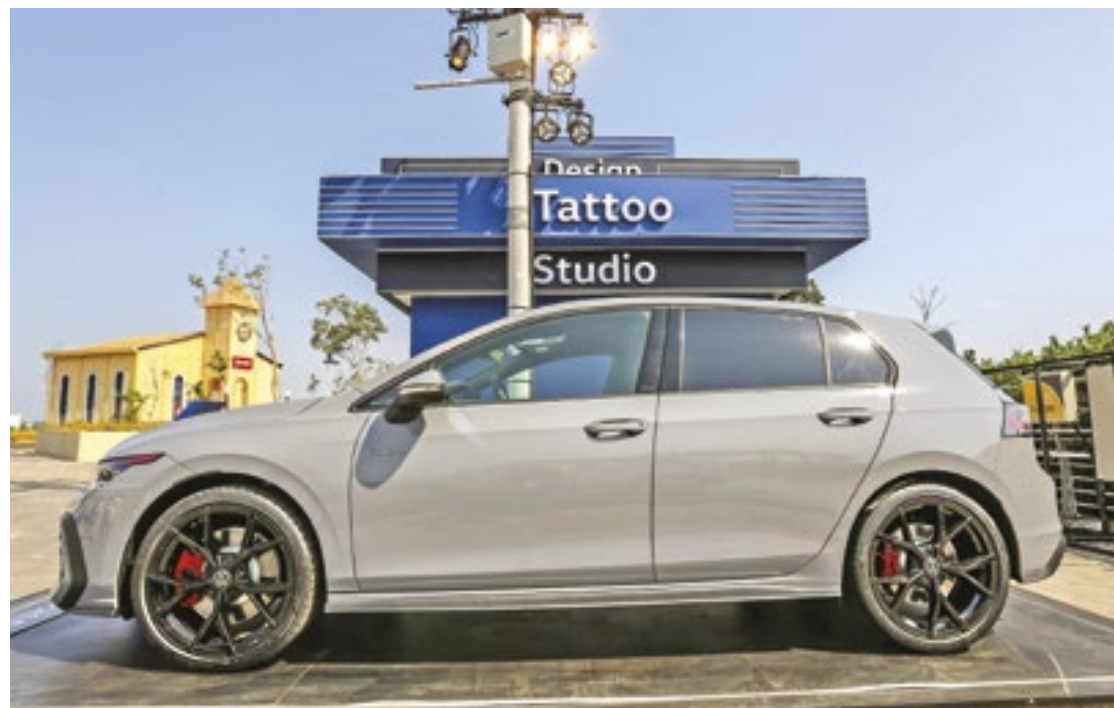
Mostrado no “Rock in Rio”, o exemplar do Golf GTI exposto no festival tem motor 2.0 turbo TSI de 265 cavalos

ção, controladas por superfícies sensíveis ao toque. O Cockpit Digital Pro se combina com o sistema de navegação Discover Pro, com duas telas, de 10 polegadas – do painel de instrumentos – e de 10,5 polegadas – da multimídia –, que podem ser interligadas. A central de multimídia se personaliza com as funcionalidades preferidas do motorista, como em um smartphone. O Golf GTI pode ter opcionalmente o Head-Up Display projetado no para-brisa, com informações como velocidade do carro, notificações dos sistemas de assistência ao condutor ou avisos de navegação, com projeção legível mesmo em contraluz. (Daniel Dias-AutoMotrix)