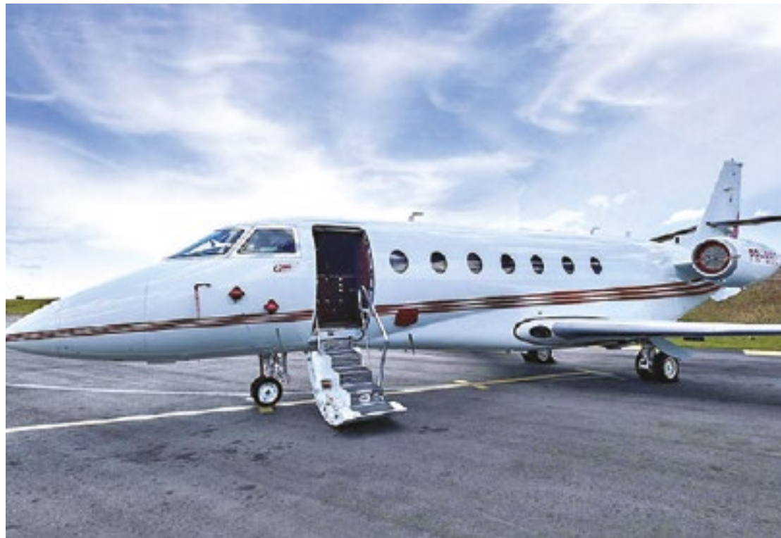
O Gulfstream 200 foi fabricado em 2008 e possui mais 3 mil quilômetros de alcance

O jato executivo é marcado, em seu interior, pelas cores bege, branco, dourado e