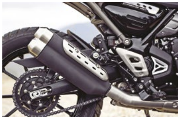
O motor monocilíndrico tem 398 cm 3 , rende 40 cavalos de potência a 8 mil rpm e 3,7 kgfm de torque a 6.500 rpm

A Scrambler 400 X investe em toques tradicionais, como o cilindro refinado com aletas e braçadeiras no coletor de escapamento, que combinam detalhes mais atuais como o silenciador virado para cima e tecnologia incorporada de forma elegante, como resfriamento a líquido oculto e um escape fluido com silenciador primário, também escondido. Os detalhes estilizados continuam com as carcaças do motor revestidas a pó preto, garfos anodizados dourados rígidos, pintura de alta qualidade e detalhes do logotipo. Acentuando a atitude para todo o terreno, o modelo inclui proteção para o farol, radiador e cárter, protetores de mão, apoio de guidão acolchoado e para-lama dianteiro mais longo. A Scrambler 400 X está disponível em dois esquemas de cores, ambos com a faixa de tanque “Scrambler” e o emblema triangular da Triumph, sendo as cores Matt Khaki Green e Fusion White e Phantom Black e Silver Ice. Quanto às revisões, o primeiro intervalo é de mil quilômetros. (Depois da primeira revisão, os intervalos são a cada 16 mil. As revisões têm preço fixo – com as duas primeiras custando R$ 100 –, com a mão de obra incluída. (Eliana Maliza, do “Aceleradas”, com colaboração de Edmundo Dantas/AutoMotrix)