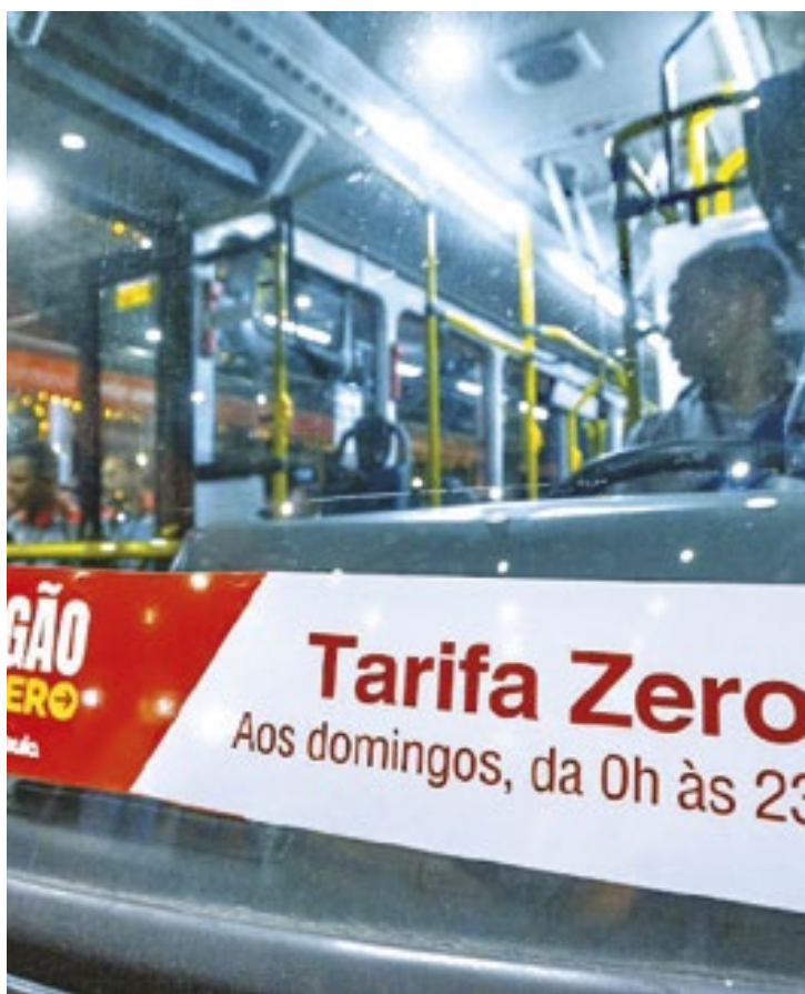
PSOL alega que Nunes descumpriu legislação em relação a publicidade em período eleitoral

"Nesse sentido, além das inserções de rádio e TV já citadas acima, também nas redes