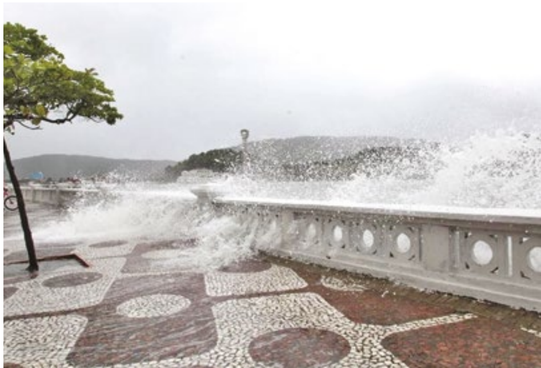
A plataforma monitora a velocidade dos ventos, o nível máximo das marés e a altura das ondas

O Seric já atende Cananéia, Ilha Comprida, Iguape, Peruibe, Itanhaém, Mongaguá, Praia Grande, São Vicente, Santos, Guarujá, Bertioga, São Sebastião, Ilhabela, Caraguatatuba e Ubatuba. (Pedro Henrique Fonseca)