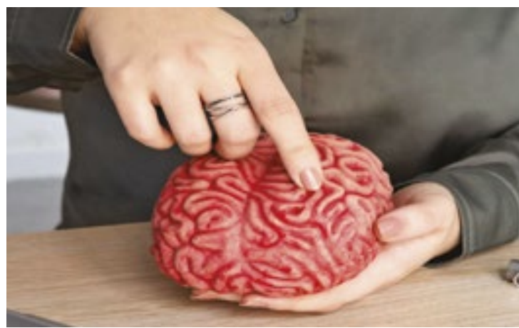
Contribuição das altas temperaturas ambientais para piora na saúde e para as mortes precoces por AVC aumentou em 72% desde 1990

As descobertas desta análise do estudo Global Burden of Disease (GBD) serão apresentadas no Congresso Mundial de